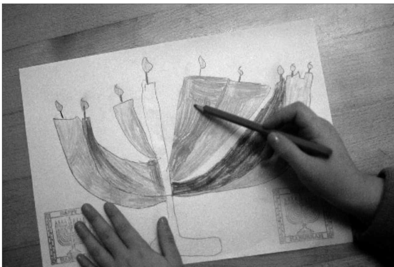
Hier dreht sich alles um die „Kleinen“: In zahlreichen jüdischen Gemeinden gibt es eigene Kitas in denen traditionell-jüdische Erziehung im Mittelpunkt steht.