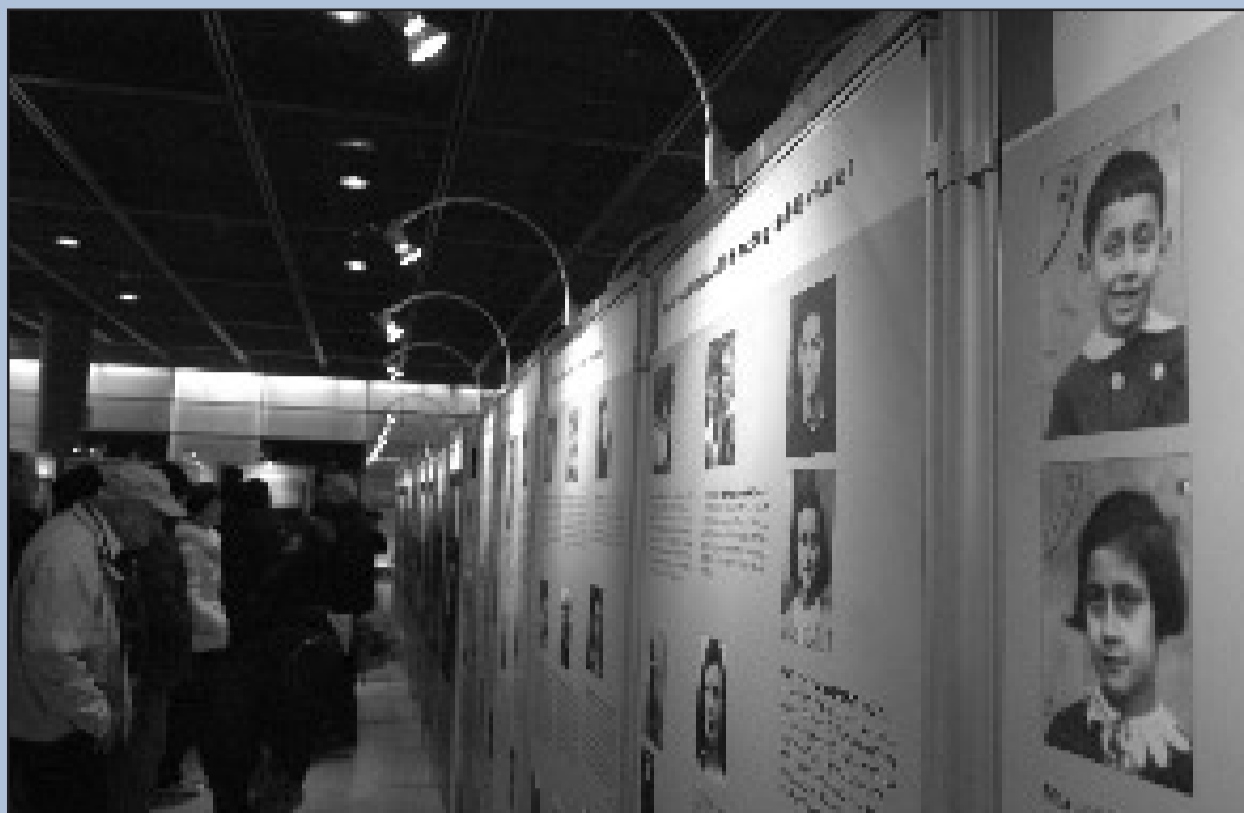
Бewegende Bilder: Im Mittelpunkt der Ausstellung „Sonderzüge in den Tod“ stehen Fotos, Zeitzeugenberichte und Informationen zu den Deportationszügen der Reichsbahn während des Dritten Reiches.

Bahn zeigt Ausstellung zu Deportationen in der NS-Zeit