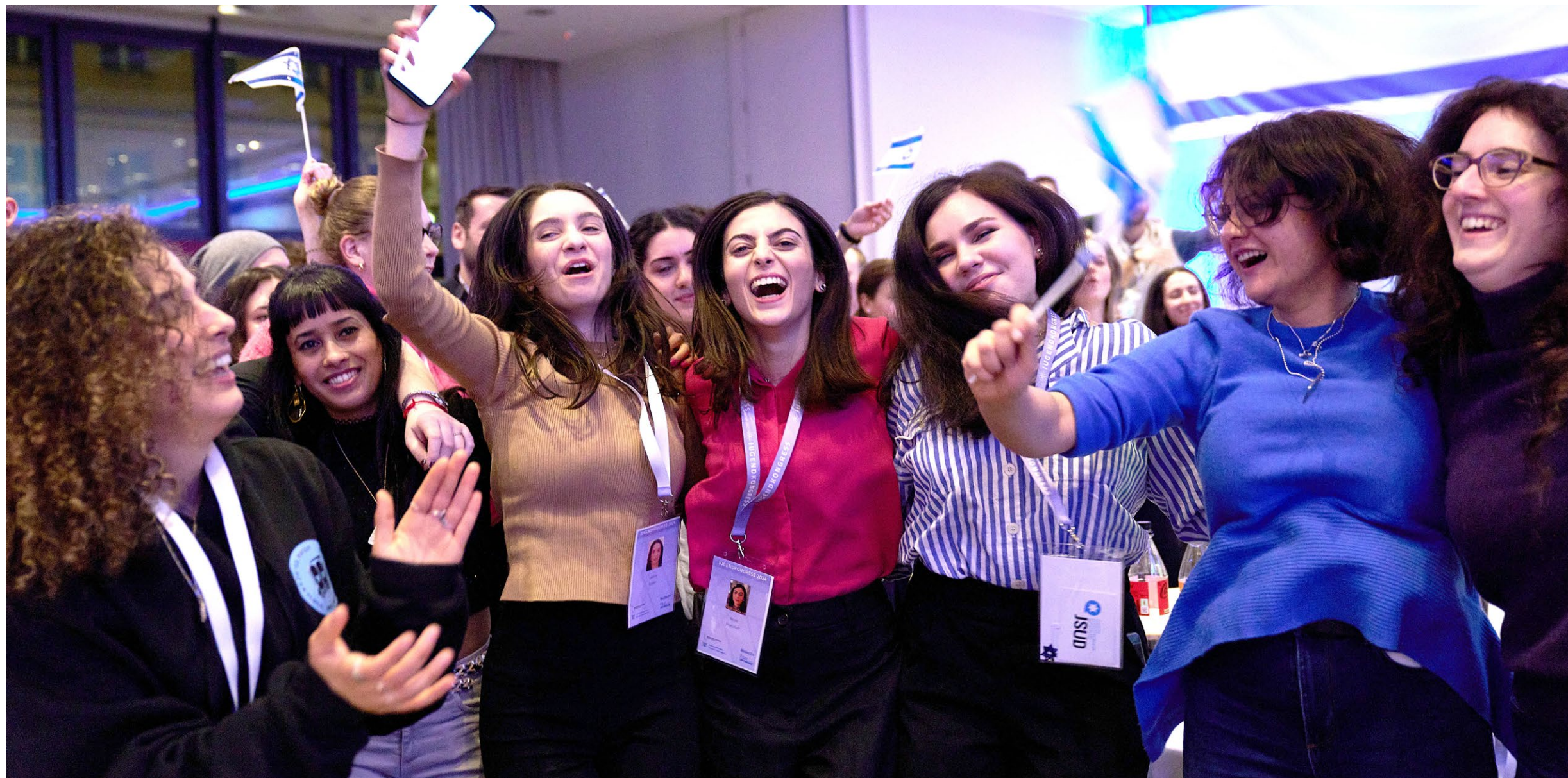
Kontakte, Freundschaften, Netzwerke: junge jüdische Erwachsene beim Jugendkongress 2024 in Berlin; vom 27. Februar bis 2. März findet der Juco in diesem Jahr in Hamburg statt.

Die Teilnehmer erwarten ein dichtes Programm aus Diskussionsrunden, in denen unter anderem die Balance zwischen Tradition und Moderne im jüdischen Leben thematisiert wird. Netzwerktreffen bieten die Möglichkeit, Kontakte zu Aktivis-