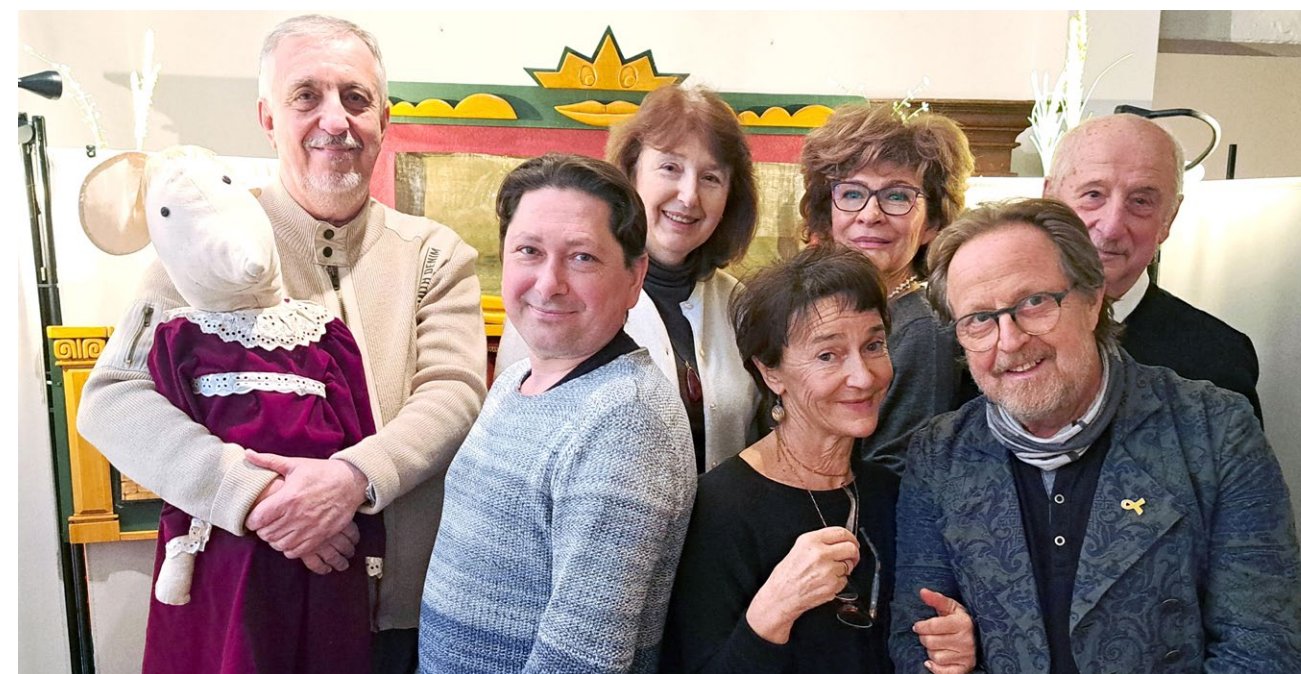
Alle zusammen auf der Bühne: die Puppentheatergruppe der Gemeinde; im Januar hat sie »Kalif Storch« aufgeführt. ★ Kollektiv kukulnogo teatra evreyskoy obshchiny;