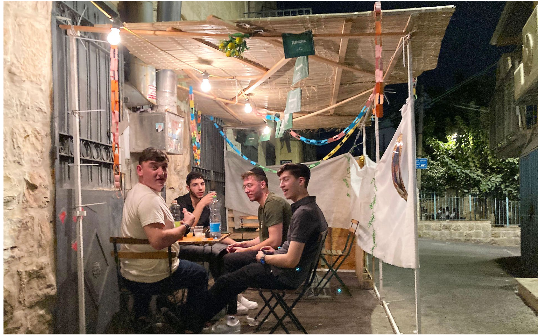
Junge Israelis feiern das Sukkotfest in Jerusalem.

Im Schatten des Vertrauens, also im Unsichtbaren statt im Sichtbaren, sollen wir unseren Halt finden. Die Sukka ist daher auch ein Sinnbild für das vergängliche Leben im Diesseits, das instabil und voller Brüche ist – genau dort befindet sich der Ort, um Vertrauen zu lernen. Im Schatten der Sukka zu sitzen, bedeutet, im Schatten des Vertrauens zu sitzen, da die Sukka eine materielle Manifestation des Vertrauens ist. Die Sukka steht auch für die Barmherzigkeit des Schöpfers. Sie gibt uns die Möglichkeit, unser Schicksal zum Besseren zu verändern. Laut unseren Weisen wird an Rosch Haschana das göttliche Gericht über den Menschen gehalten. Danach haben wir zehn Tage Zeit, Einfluss auf das Urteil zu nehmen und es zu verändern, bevor es dann am Jom Kippur besiegelt wird. Doch die Weisen lehren uns auch, dass das Urteil, das an Jom Kippur besiegelt wird, erst am letzten Tag von Sukkot »abgesendet« wird. Ab Simchat Tora wird das göttliche Urteil ausgeführt.