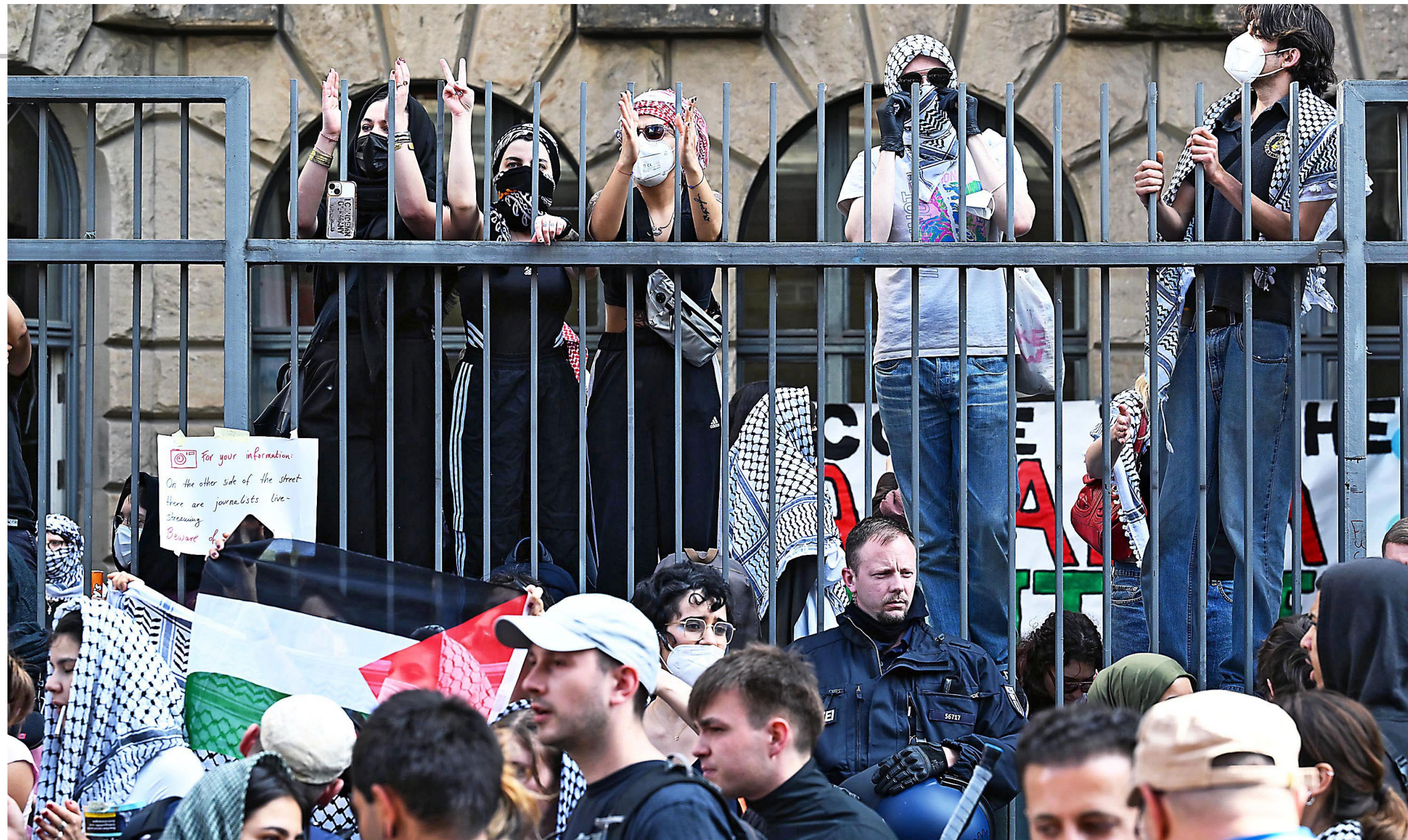
Radikale »propalästinensische« Aktivisten besetzten am 23. Mai das Institut für Sozialwissenschaften der Humboldt-Universität in Berlin. 23 мая радикальные «пропалестинские» активисты

Eine Woche nach der Besetzung am Institut für Sozialwissenschaften meldete sich der Fachschaftsrat noch einmal zu Wort, diesmal mit einem langen Statement, welches »ein Produkt einer intensiven und auch schmerzhaften Auseinandersetzung« der Studierenden sei. Darin verurteilt die