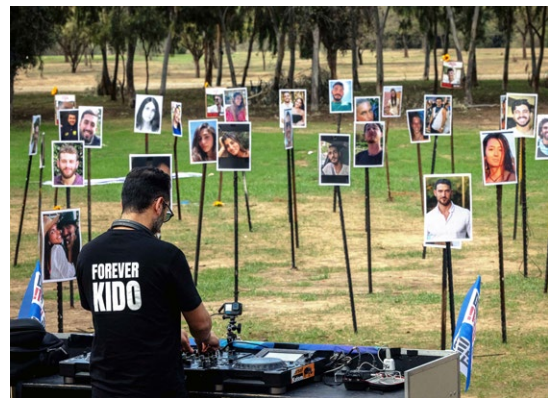
Gedenken auf dem Gelände des Nova-Musikfestivals * На территории фестиваля «Супернова»