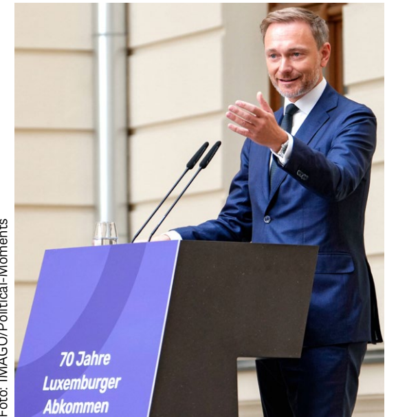
Bundesfinanzminister Christian Lindner ★ Министр финансов ФРГ Кристиан Линднер

В середине сентября Израиль и Германия подписали соглашение о дополнительной финансовой помощи лицам, пережившим Холокост и ныне нуждающимся в уходе. Министр социальных дел Израилля Мерав Коэн назвала соглашение »историческим«. Оно предусматривает дополнительную ежегодную выплату 58 миллионов евро в пользу переживших Холокост израильтян. »Это очень важное соглашение, в рамках которого тысячи нуждающихся в уходе лиц ежемесячно будут дополнительно получать 1200 шекелей (350 евро)«, – сказала Коэн. Это коснётся около 14000 выживших. Соглашению предшествовали интенсивные переговоры между министерствами социальных и иностранных дел Израилля, Клеймс Конференс и министерством финансов ФРГ. На церемонии подписания министр финансов Кристиан Линднер сказал, что не считает искупление вины достижимой целью, а скорее видит в нём стимул к действию: »Нами движет постоянное стремление к искуплению. Этот процесс никогда не может быть завершён«.