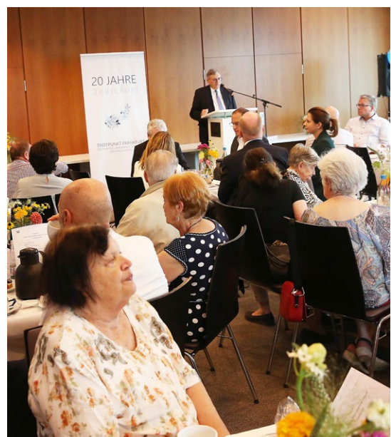
Am Rednerpult: Zentralratsvize Abraham Lehrer ★ Речь вице-президента ЦСЖГ Авраама Лерера