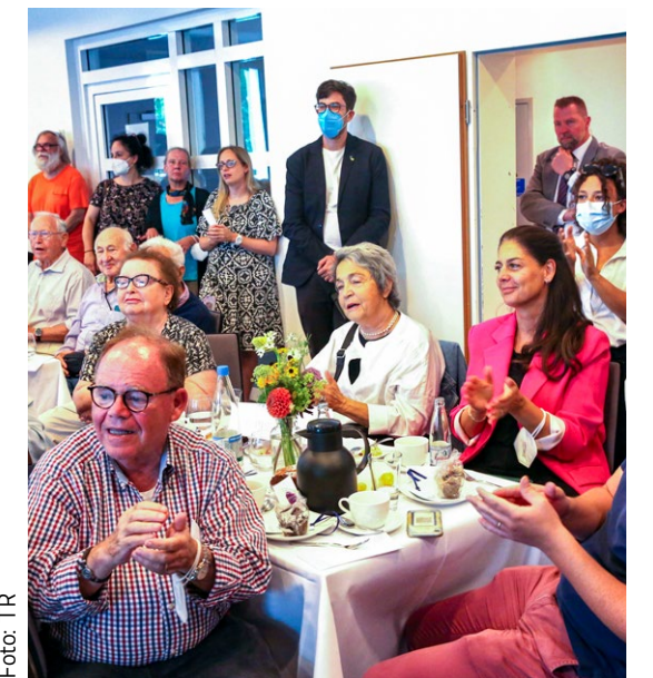
Гäste des »Treffpunkt«-Jubiläums ★ Гости юбилея »Треффпункта«

»Треффпункт« во Франкфурте отметил своё 20-летие