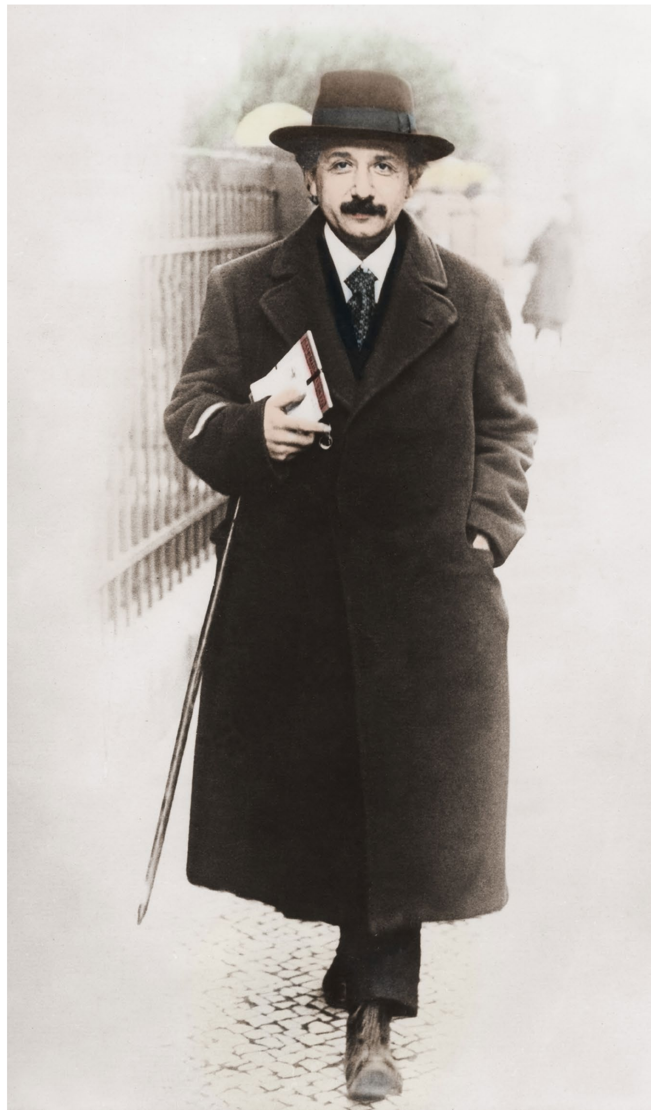
Alles andere als ein sprunghafter Gesellschaftsdenker: der Physiker Albert Einstein (1879–1955)

Einstein, der nach der Erfahrung der Schoa vor allem besorgt um das Schicksal vieler aus Deutschland Geflüchteter war, wollte sich nicht davon abbringen lassen, dass gerade ein jüdischer Staat an humanistischen Idealen ausgerichtet sein müsse. Dabei war er weder kommunistisch noch anarchistisch eingestellt. Vielmehr vertraute er auf ein liberales modernes Menschenbild, in dem der Einzelne frei und selbstbestimmt agieren sollte.