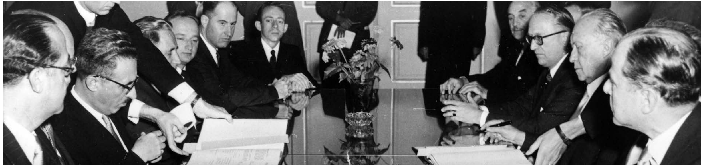
Israels Außenminister Mosche Scharet (3.v.l.) und Bundeskanzler Konrad Adenauer (2.v.r.) am 10. September 1952 bei der Unterzeichnung in Wassenaar ★ Minister интэрнэцных дел Израилля Моше Шарет (3-й слэва) и канцлер ФРГ Конрад Аденауэр (2-й справа) во время подписания соглашения 10 сентября 1952 г. в Вассенаре