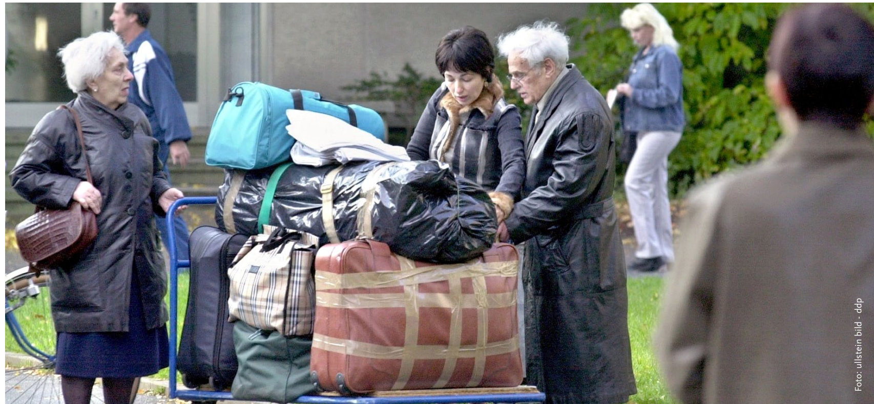
Zwischen 1990 und 2004 kamen knapp 220.000 jüdische Migranten aus der Sowjetunion und deren Nachfolgestaaten nach Deutschland. In период с 1990 по 2004 год из СССР и постсоветских стран в объединённую Германию иммигрировало почти 220000 евреев.