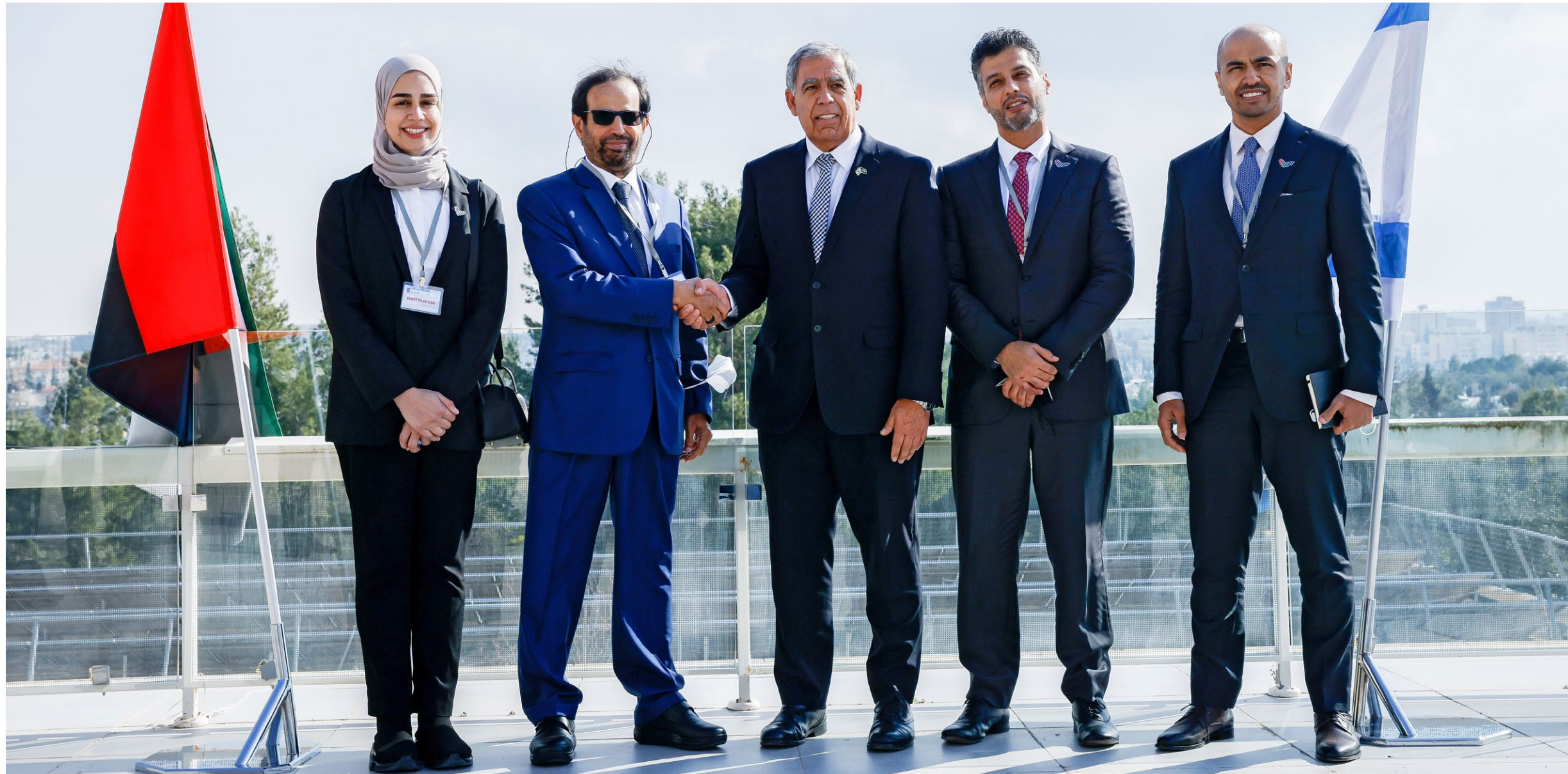
Knessetpräsident Mickey Levy (M.) begrüßt Parlamentarier aus den Vereinigten Arabischen Emiraten am 14. Juli 2021 in Jerusalem.

Bereits im Februar hatten beide Länder ein Tourismusabkommen unterzeichnet. Es war ein weiterer Schritt zur Stärkung der politischen und wirtschaftlichen Beziehungen zwischen Israel und den Emiraten. Viel mitbekommen von diesen positiven Entwicklungen hat man in den Medien jedoch nicht.