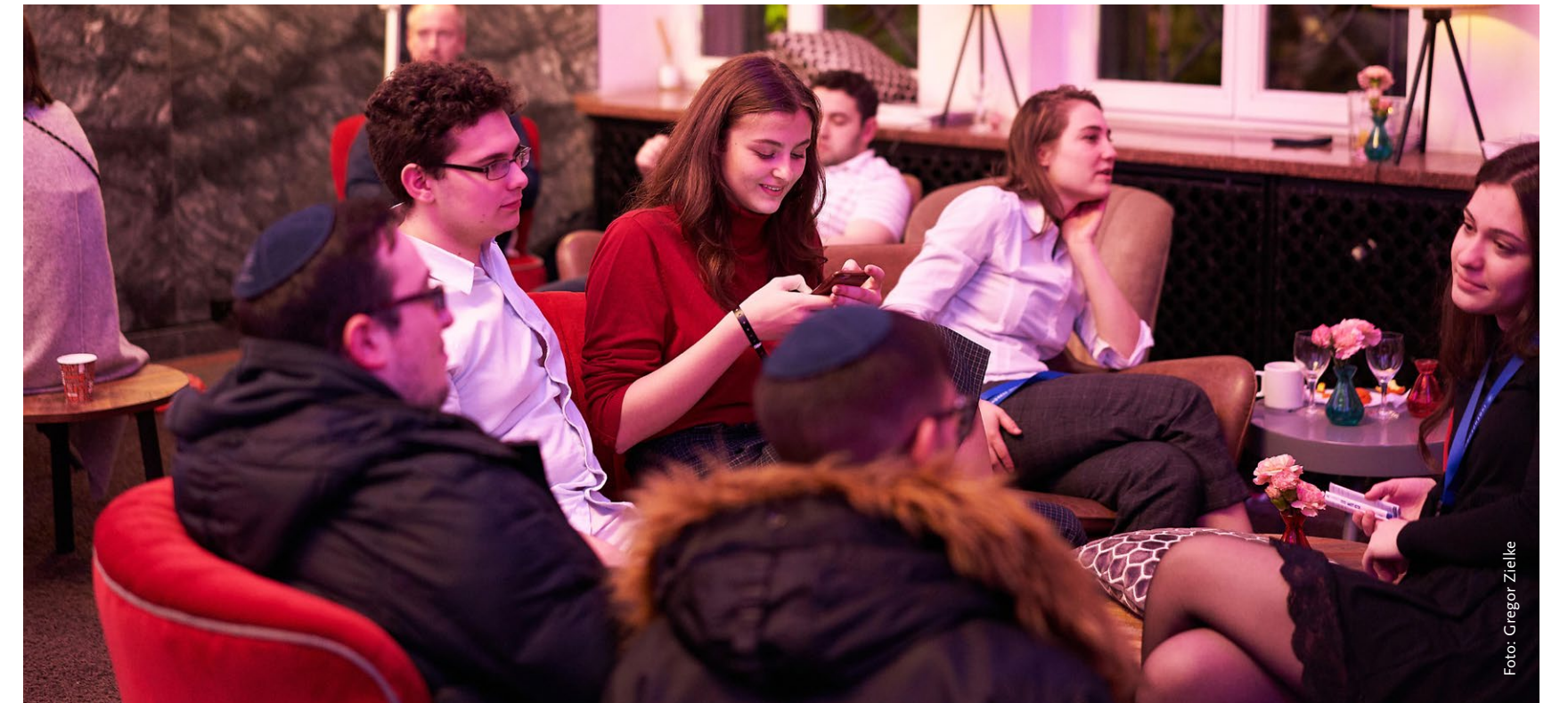
Aktiv und integriert: Teilnehmerinnen und Teilnehmer beim Jugendkongress des Zentralrats der Juden 2019 in Berlin. Aktive und integrierte: Teilnehmerinnen und Teilnehmer beim Jugendkongress des Zentralrats der Juden 2019 in Berlin.