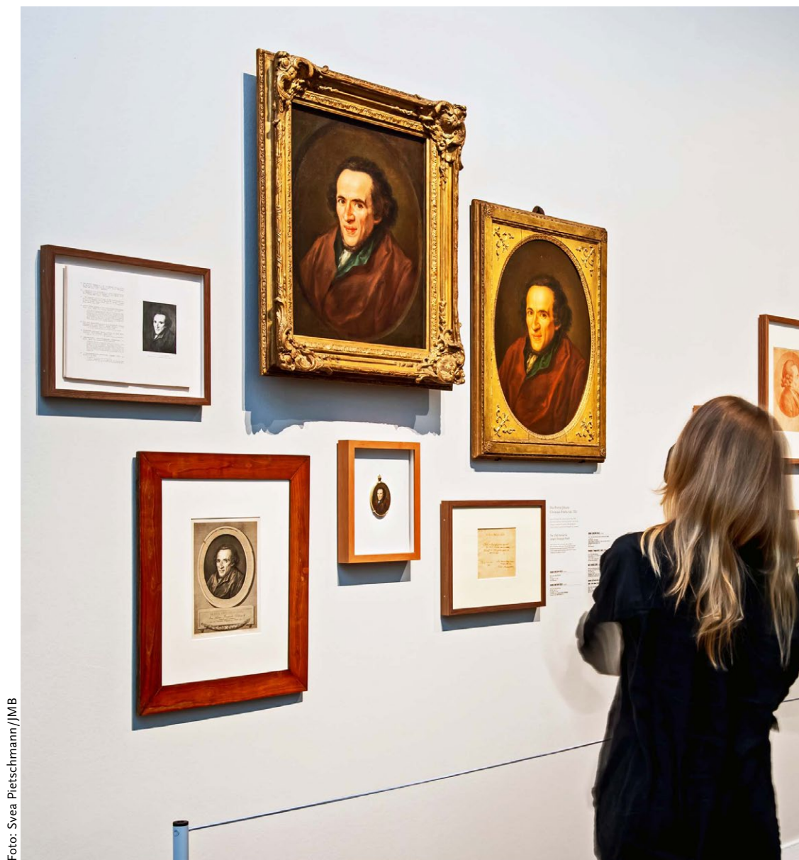
Mendelssohn-Porträts im Jüdischen Museum Berlin: Blick in die bis 11. September laufende Ausstellung Портреты Мендельсона на выставке в Берлине, которая продлится до 11 сентября.

Выставка в Берлине состоит из семи залов, в которых представлено 350 экспонатов. Она рассказывает о жизни Мендельсона, о его влиянии на свою эпоху и его посмертной славе. Будучи современным мыслителем, Мендельсон мечтал о Просвещении, видя в нём силу разума. Он считал, что разум должен одержать верх над своей противоположностью – «мечтательским духом». Мендельсон сформулиро-