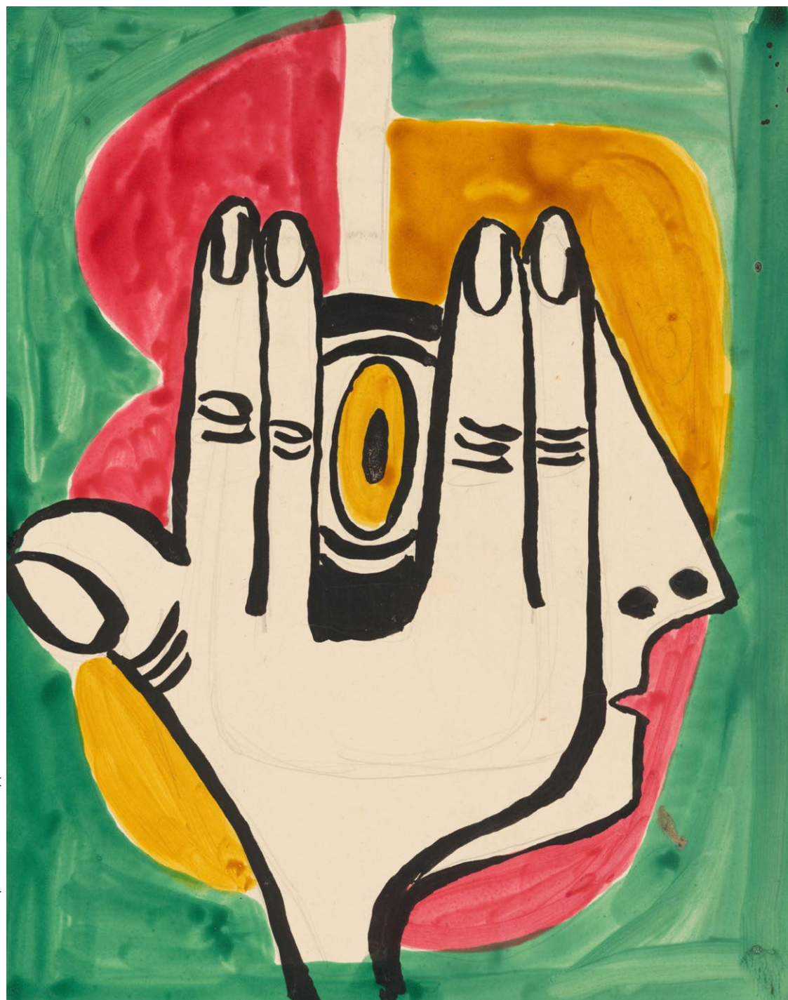
Aquarell »Durch die Hand geschaut«, um 1935

Der Mensch stand für Jankel Adler auch weiterhin im Mittelpunkt seines Schaffens – der Körper, den er in seinen Grafiken und Gemälden einer