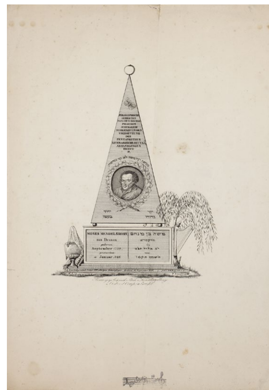
Zu sehen sind in der Ausstellung unter anderem ein von Mendelssohn gestifteter Toravorhang, eine Graphic Novel und ein Denkmalsentwurf (v.l.). В числе экспонатов выставки – пожертвованный Мендельсоном парохет, графический роман и эскиз памятника Мендельсону (слева направо).