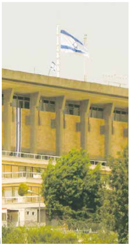
Berlin, Jerusalem, New York: Nach 1989 wanderten anderthalb Millionen Juden aus der Ex-Sowjetunion nach Deutschland, Israel und die USA aus

auf den damaligen Landesdurchschnitt von 10 Prozent und in den USA sogar weit darunter. In Deutschland standen dagegen noch am Beginn des neuen Millenniums mehr als 30 Prozent nicht in Lohn und Brot.