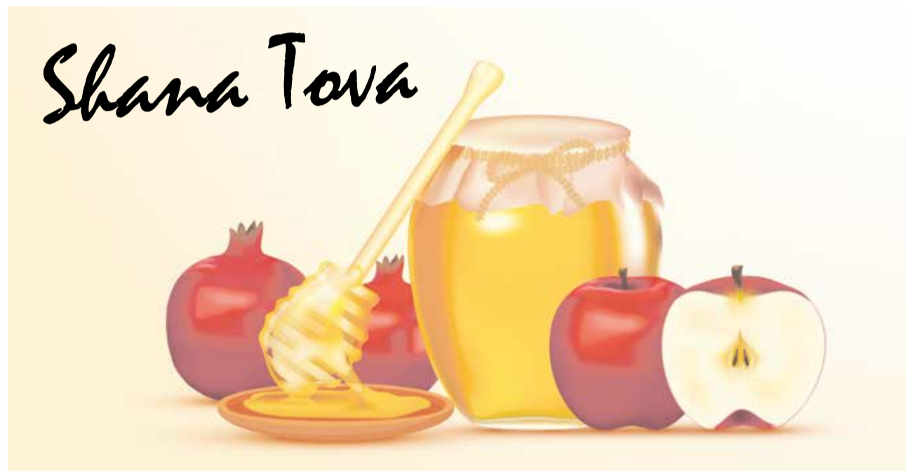
Ein gutes Jahr: Grußkarte zu Rosch Haschana

Wie ich schon sagte: Man muss neben dem Licht auch die Schatten sehen, und das ist ein Schatten, aus dem wir aber kein allgegenwärtiges Gespenst machen sollten. Ich habe davon abgeraten, sich als Einzelperson in Großstädten, etwa durch eine Kippa, nach außen als Jude zu erkennen zu geben. Als Dachorganisation der jüdischen Gemeinschaft haben wir die Verantwortung, Dinge klar zu benennen. Wer aber zu Vergleichen zwischen der heutigen Situation in Deutschland und den Dreißigerjahren des 20. Jahrhunderts greift, liegt völlig daneben. Heute steht der Staat in Deutschland nicht hinter den Antisemiten, sondern