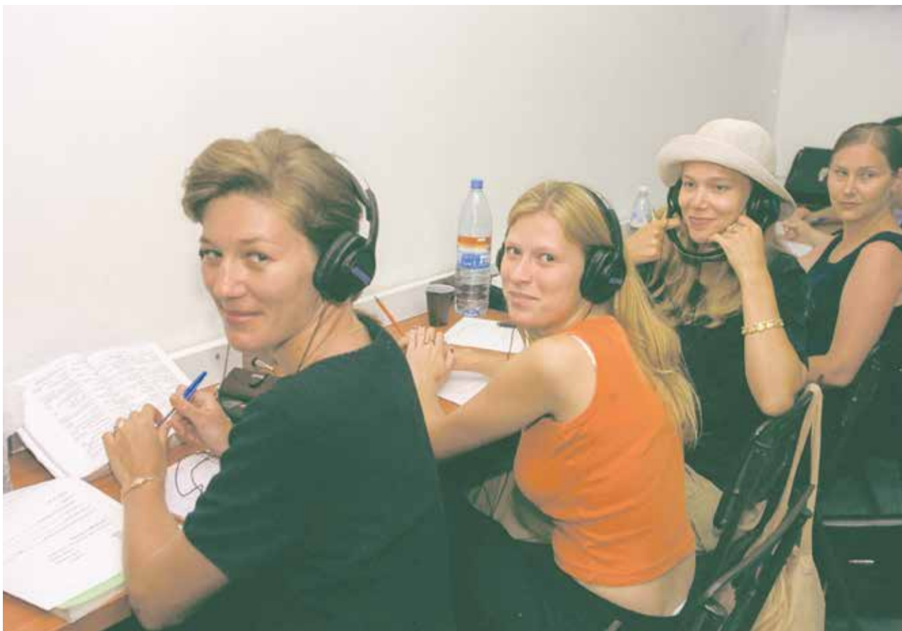
Brücke in eine neue Gegenwart: Sprachunterricht für Immigranten in Israel