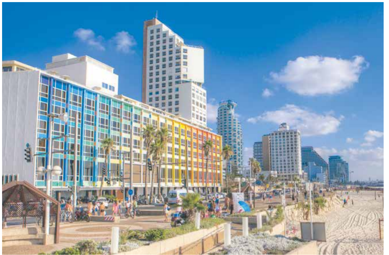
Eine Reise wert: der Strand von Tel Aviv

Auch wird es niemanden überraschen, dass der Anteil von Touristen, die Familien oder Freunde besuchten, unter Juden am höchsten war: 69 Prozent der Juden kamen hauptsächlich wegen der Familien oder Freunde ins Land – ein Mehrfaches der bei anderen Religionsangehörigen erreichten Zahl. Trotzdem sind Familienbande und Freundschaften nicht nur auf Juden be-