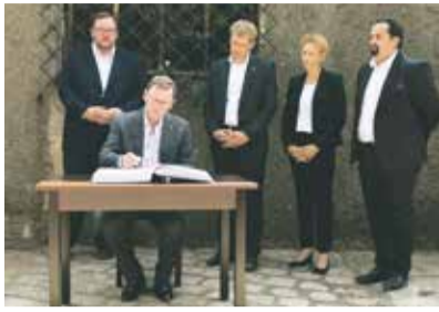
Совместная церемония подписания в мемориале Аушвиц.

В августе в мемориале Аушвиц состоялась совместная церемония в память жертв Холокоста, в которой приняли участие еврейские подростки и молодые беженцы-мусульмане.