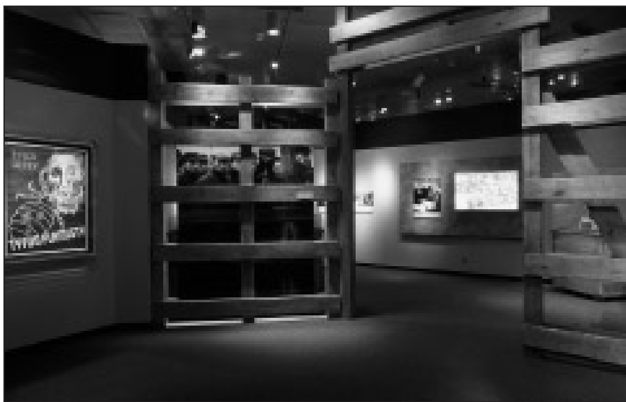
Sonderausstellung ist riesen Erfolg: Allein die Präsentation der Schau "Tödliche Medizin" zieht die Besucher in ihren Bann und vermittelt sehr vorsichtig grausame Wahrheiten.

Die Ausstellung "Tödliche Medizin" ist noch bis zum 24. Juni 2007 in Dresden zu sehen (für Kinder erst ab 12 Jahren in Begleitung Erwachsener empfohlen). Für Schüler gibt es Führungen auf Deutsch, Englisch, Französisch, Tschechisch und Polnisch. Weitere Informationen finden Sie im Internet unter: www.dhmd.de