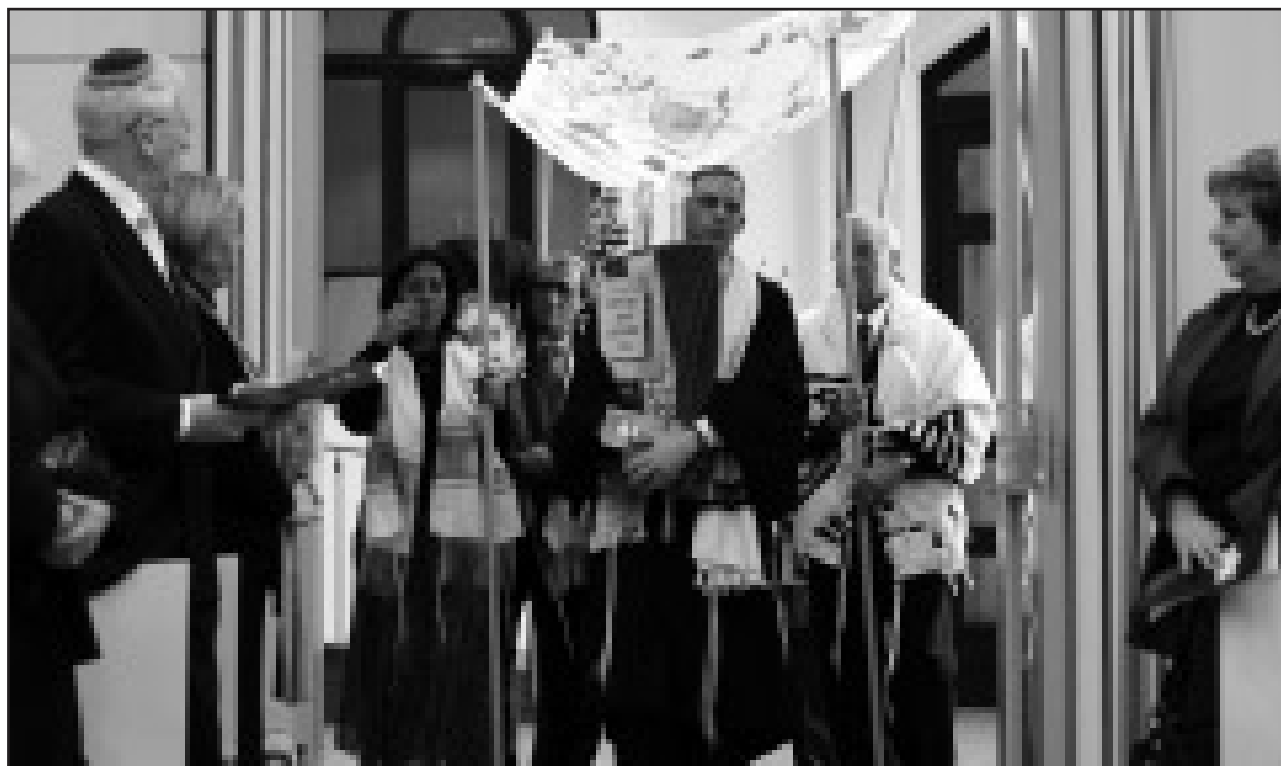
Feierliche Einweihung: Die Rabbiner tragen die vier Torarollen in die neue Synagoge.

Der Bau war ein Kraftakt für die Braunschweiger Gemeinde, vor allem finanziell. Doch gebaut werden musste. Für die heute 200 Mitglieder war die Synagoge im Ge-