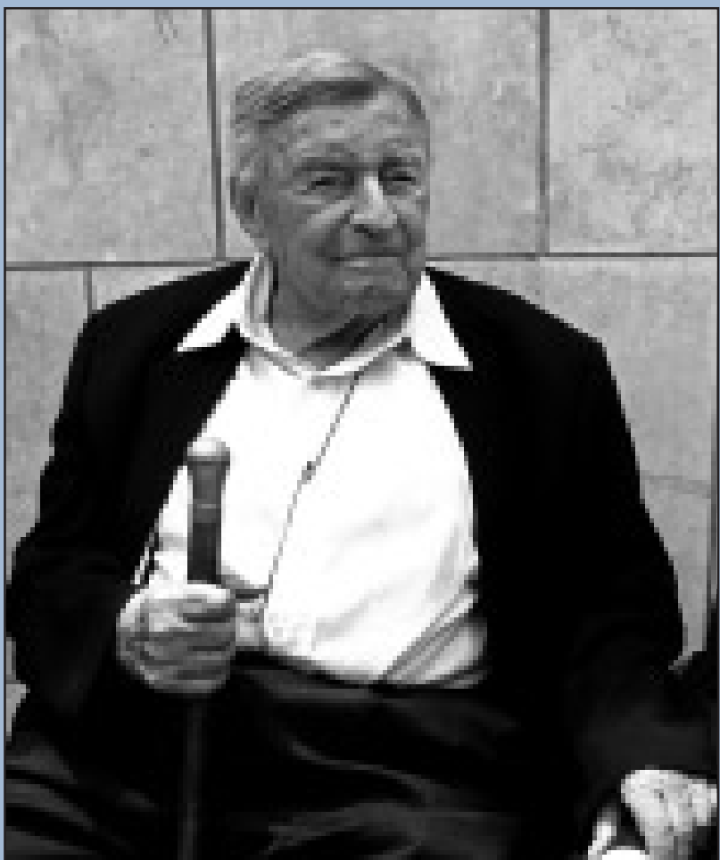
Ein Mahner und Macher: Teddy Kollek war eine Institution, er genoss weltweites Ansehen und kämpfte für ein friedliches Miteinander der Religionen und Kulturen.

Am 2. Januar 2007 starb Teddy Kollek, der langjähriger Bürgermeister von Jerusalem, im Alter von 95 Jahren in Jerusalem. Bis ins hohe Alter engagierte sich Kollek in der 1966 von ihm gegründeten Stiftung "Jerusalem Foundation", die sich um die Bewahrung Jerusalems und das bessere Miteinander von Juden, Christen und Muslimen in der Stadt kümmert. Für diese Ziele setzte sich Kollek selbst als Bürgermeister von 1965 bis 1993 ein.