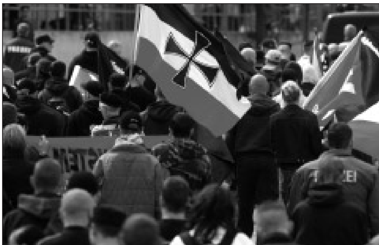
Rechtsextremistische Gewalt auf dem Vormarsch: Über 11 000 Straftaten wurden 2006 verübt.

Politiker und Experten nahmen diese Bilanz zum Anlass, um vor einer Verharmlosung von Fremdenfeindlichkeit zu warnen. Als eine der Ursachen für eine wachsende Fremdenfeindlichkeit in Ostdeutschland wird die Abwanderung in die alten Bundesländer vermutet. "Die, die zurückbleiben, haben das Gefühl, als Verlierer abgestempelt zu sein", so der frühere Regierungssprecher und