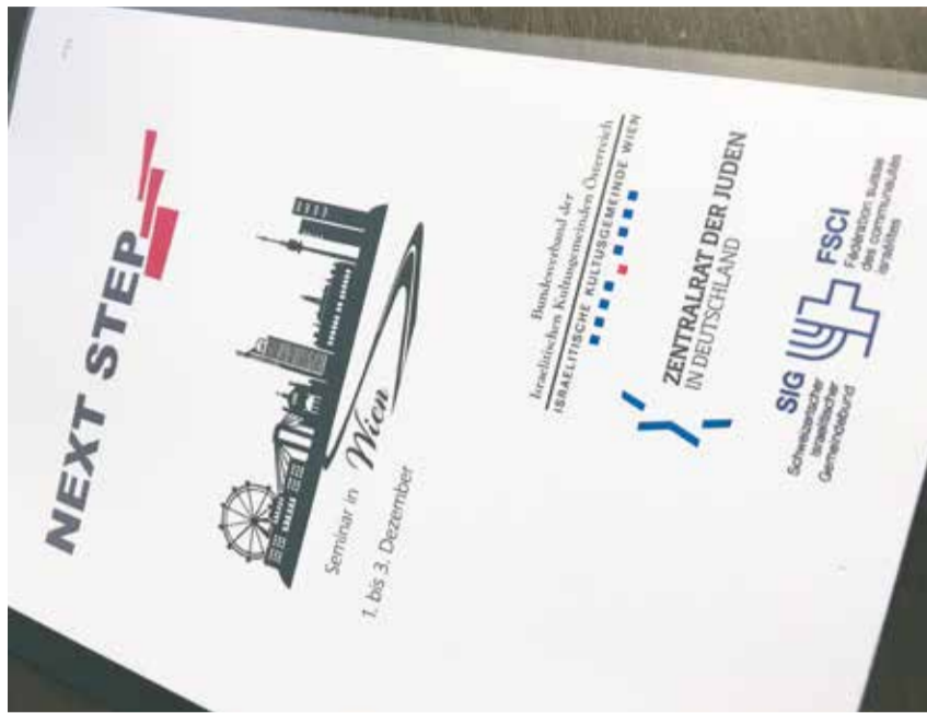
Gemeinsam lernen: Programm des Wiener Seminars

In Wien fand ein weiteres Seminar der Reihe Next Step statt