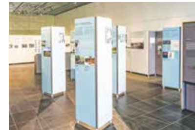
Blick auf das Grauen: Stelen der Ausstellung

die Schoa in den von Deutschland besetzten sowjetischen Gebieten. Zwischen 1941 und 1944 erschossen Angehörige der SS, der Wehr-