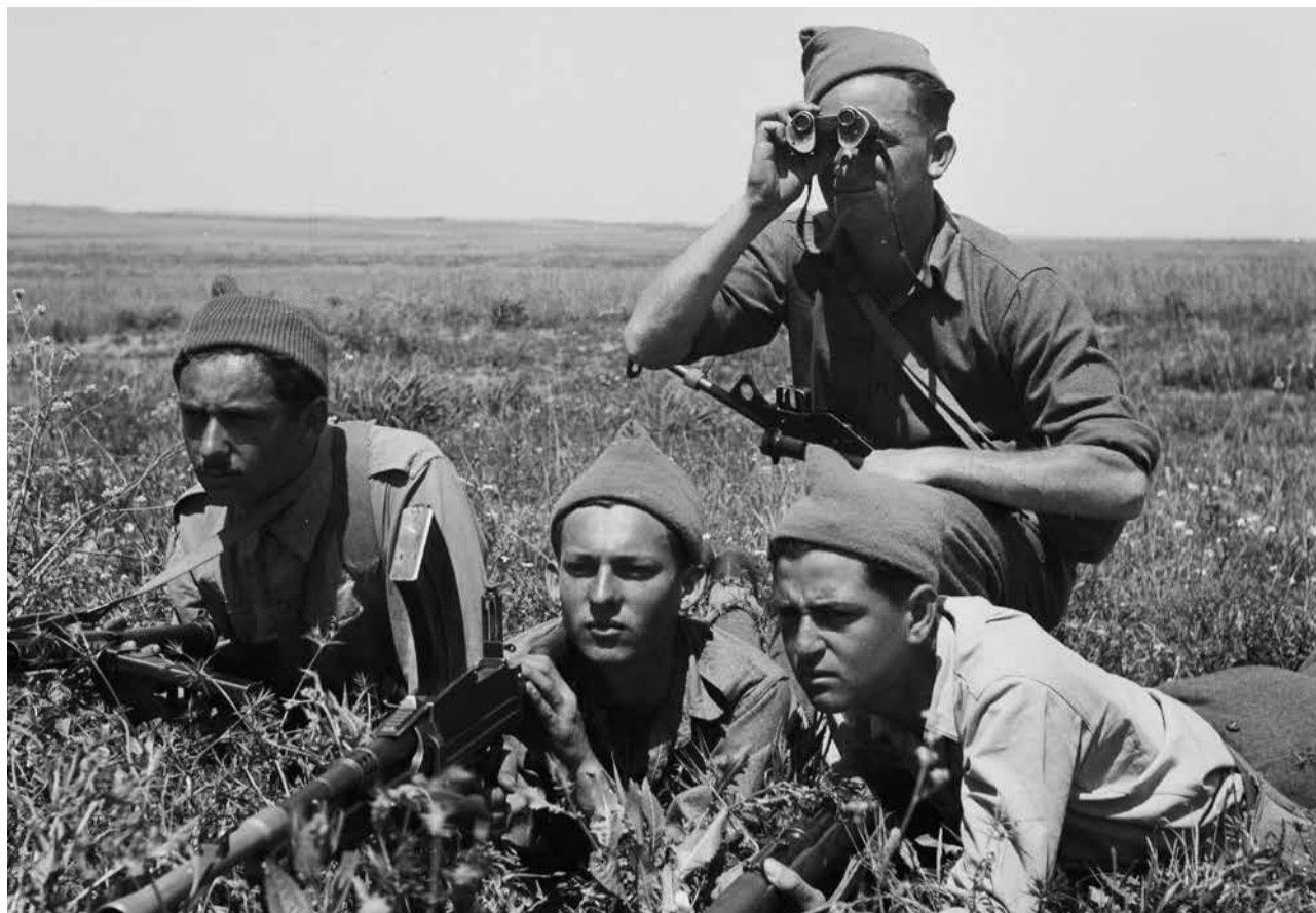
In Vorbereitung auf einen unvermeidlichen Konflikt: Kämpfer der jüdischen Untergrundarmee Hagana im Januar 1948

Im Rahmen ihrer proarabischen Nahostpolitik tat die britische Mandatsmacht ihrerseits nichts, um bei der