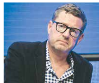
Freund: Kai Diekmann

Бывший главный редактор газеты «Бильд» Кай Дикман избран новым председателем Общества друзей мемориала Яд Ва-