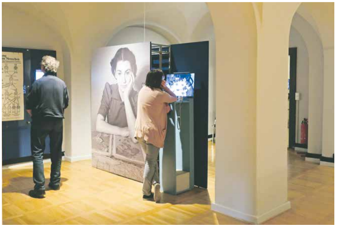
Spiegel der Zeit: „Berlin 1937“

Ein weiteres Objekt hat ebenfalls Bezug zu den Olympischen Spielen: Eine Coca-Cola-Flasche steht in einem Glasquader. Der Getränkehersteller war offizieller Sponsor der Spiele und betrieb