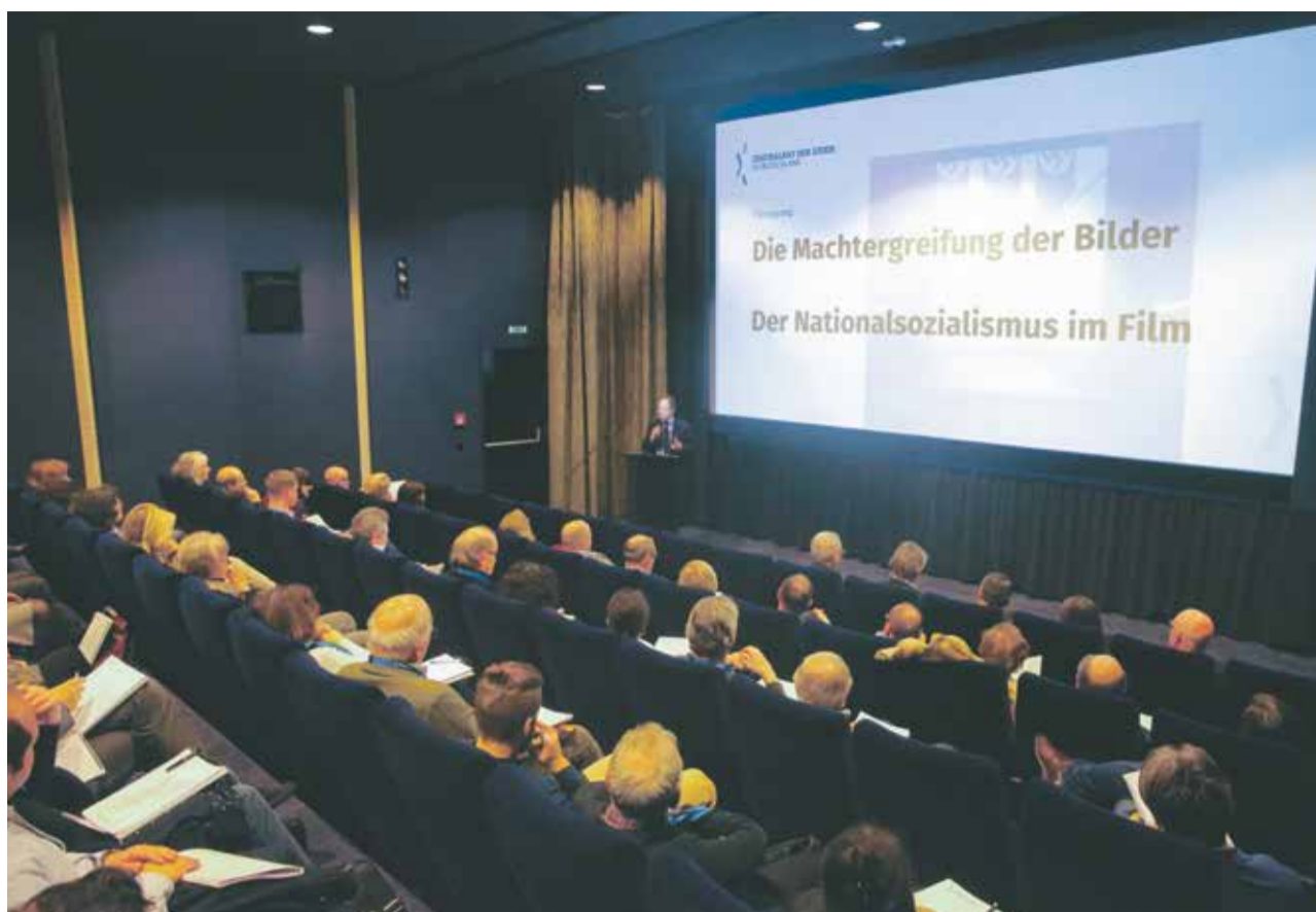
Bilder des Bösen: Die Wiesbadener Tagung griff ein komplexes Thema auf