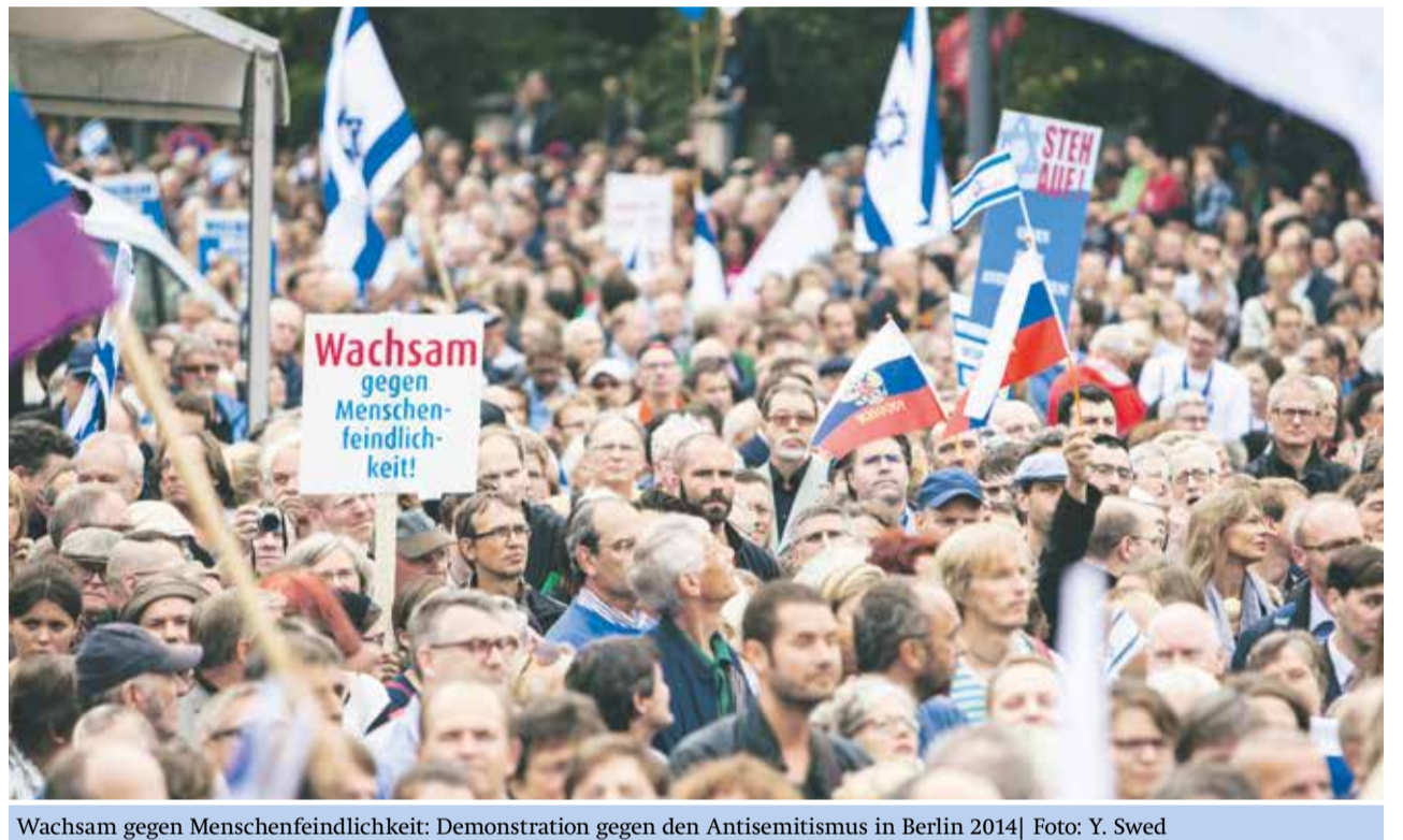
Wachsam gegen Menschenfeindlichkeit: Demonstration gegen den Antisemitismus in Berlin 2014

Gleichzeitig wurden Juden verteuflert: „Der Jude“ verfügte über Fähigkeiten, die das menschliche Maß übertrafen und setzte sie für seine satanischen Zwecke ein. Diese beharrliche Darstellung der Juden als Auswüchse des Bösen gab dem Antisemitismus auch ohne die Existenz realer Juden Nahrung. In Spanien etwa hielt sich hartnäckige Judenfeindschaft jahrhundertlang nach der Vertreibung