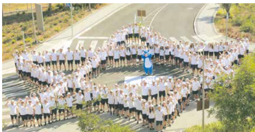
Gruppenbild mit Davidstern: Das Team von Makkabi Deutschland in Israel