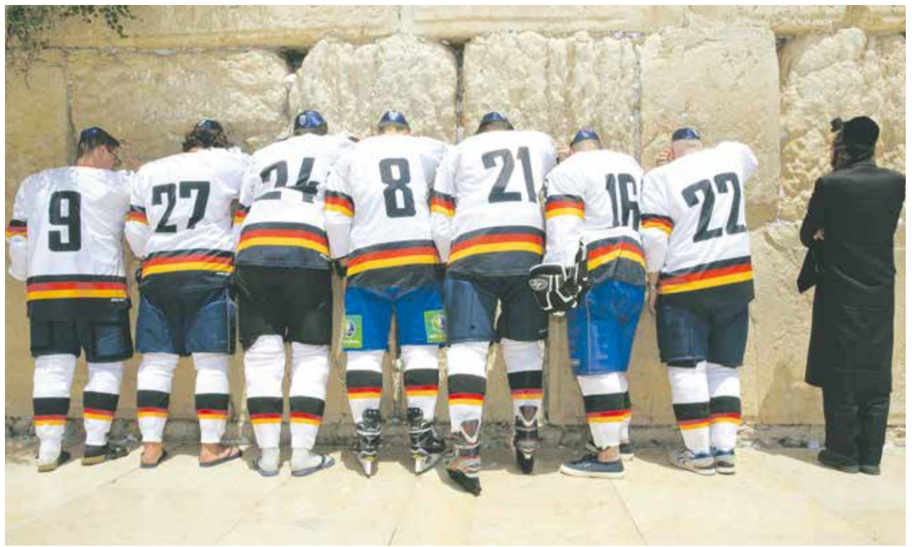
Jerusalem hat mehr zu bieten als Eishockey: Spieler von Makkabi Deutschland an der Westmauer

Bereits vor der Zeremonie hatten die Sportler von Makkabi Deutschland die Möglichkeit, mit Überlebenden des Terrorangriffs von München zu sprechen. „Es war wirklich ergreifend und für die jungen Leute sehr wichtig“, so Krymalowski. Für einige der Sportler war es ihr erster Israel-Besuch. Auf dem Vorbereitungslager stand denn auch gelebte jüdische Tradition auf dem Programm. wst