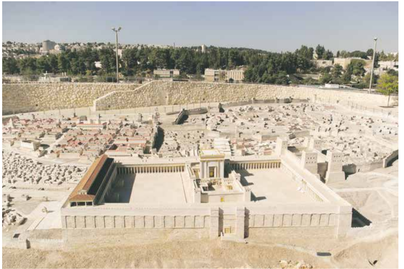
Imposanter Bau: Rekonstruktion des herodianischen Tempels im Modell des Israel-Museums

Architektonisch passte sich der Tempel in Jerusalem an die Tempel kanaanäischer Religionen an: drei Räume, deren Grad der Heiligkeit ab dem Eingang zunahm. Heute sind auf dem Gebiet des antiken Israels und in Nachbarländern rund 80 verschiedene Variationen dieser Bauweise archäologisch ausgewiesen, wobei alle die Drei-Raum-Struktur aufweisen. Im Jerusalemer Tempel war der heiligste Ort das im letzten Raum gebaute Allerheiligste (Kodesch ha-Kodaschim), das nur der Hohepriester – und auch das nur an Jom Kippur – betreten durfte.