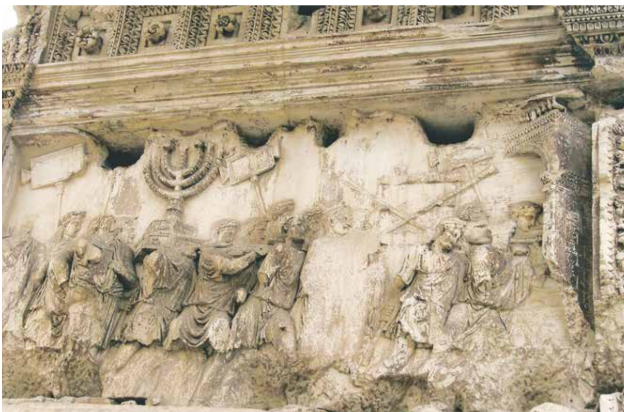
Нахspiel: Jüdische Kriegsgefangene in Rom mit Kultgegenständen aus dem von römischen Legionen zerstörten Tempel (Abbildung am römischen Titusbogen)