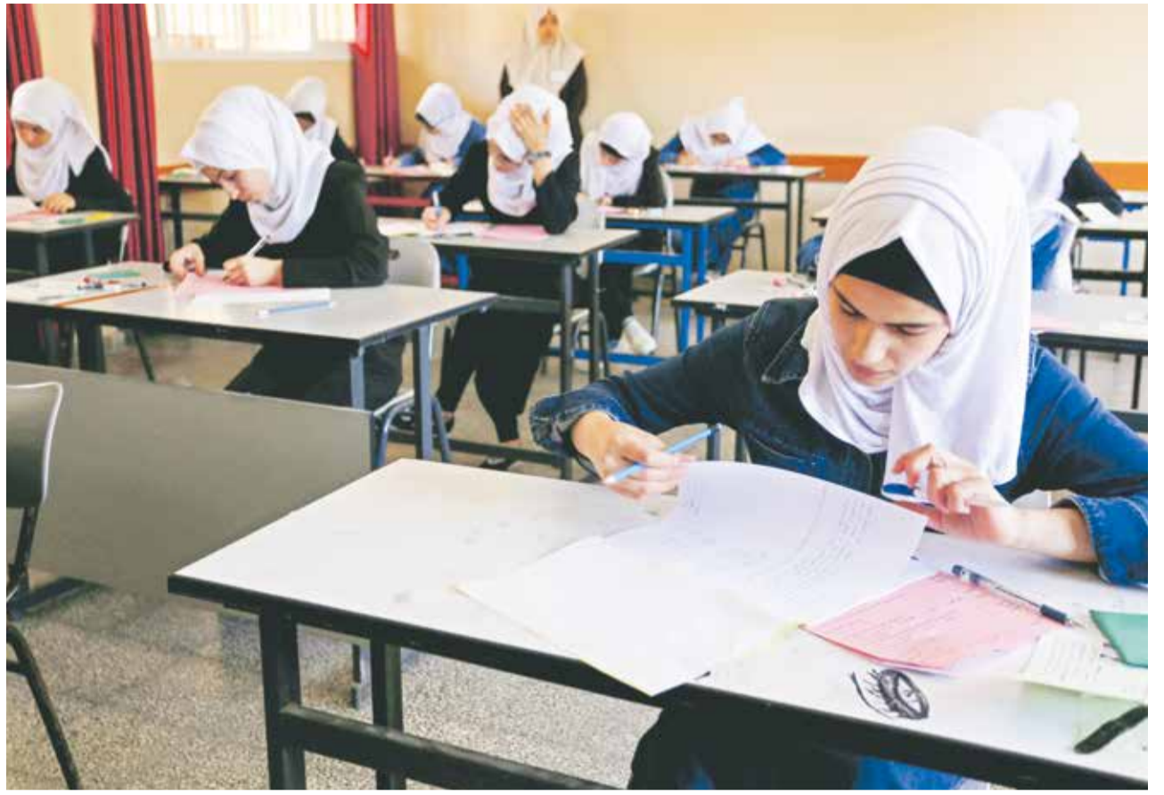
Bloß nicht Gutes über Juden: Klassenzimmer in Gaza | Foto: dpa

Es bleibt nicht bei einem verzerrten Geschichtsbild. Auch eine Friedensvision fehlt im Unterricht. So finde sich, brachte die Untersuchung ans Tageslicht, der Staat Israel nicht auf palästinensischen Schulkarten, seine Existenz werde unterschlagen. Textstellen, die an Verständigung appellierten, fänden sich in den Büchern nicht. Vielmehr sei oft von der „Rückkehr“ in das heutige israelische