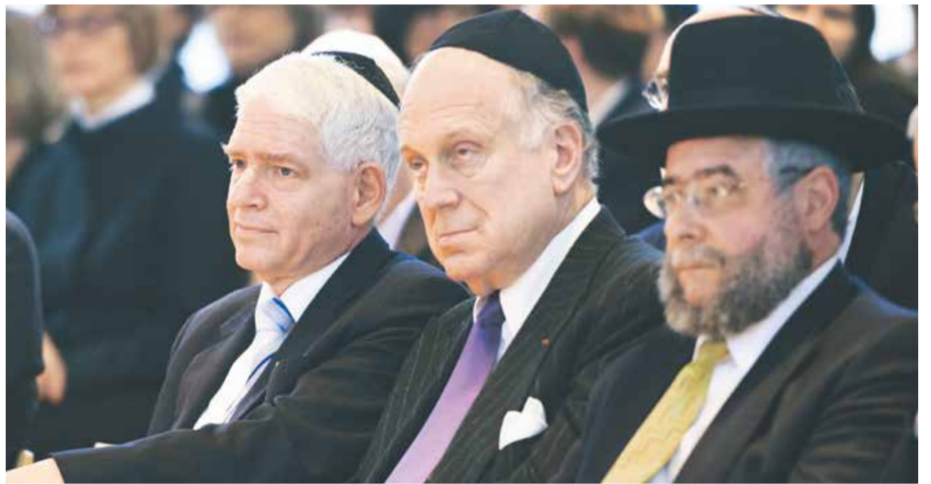
International vernetzt: Zentralratspräsident Dr. Josef Schuster mit dem Präsidenten des Jüdischen Weltkongresses, Ronald S. Lauder und dem Präsidenten der Konferenz Europäischer Rabbiner, Rabbiner Pinchas Goldschmidt (v. l. n. r.)

Kooperation ist ebenfalls ein wichtiges Stichwort. Ein Beispiel ist das