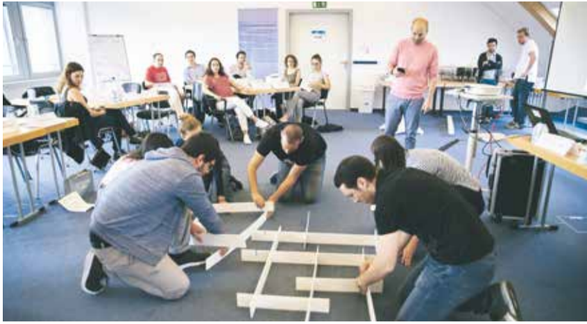
Teamwork: Teilnehmer des Next-Step-Seminars in Berlin

In Berlin fand ein Seminar der Fortbildungsreihe Next Step statt