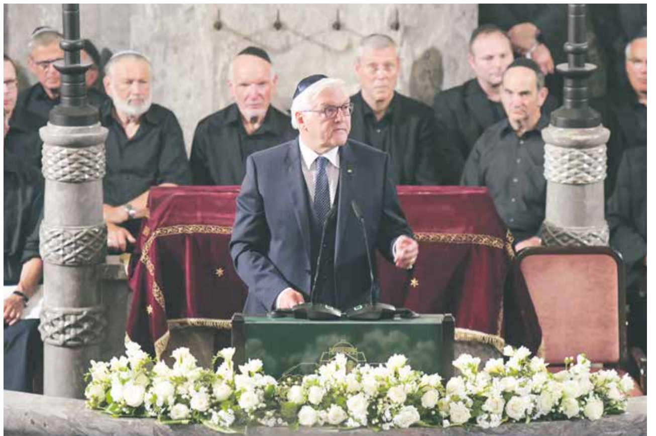
Zu Gast im Gotteshaus: Bundespräsident Dr. Frank-Walter Steinmeier beim Festakt in der Augsburger Synagoge

Der Bundespräsident zeigte sich außerordentlich beeindruckt von der Aura des Raumes: „Die Augsburger Sy-