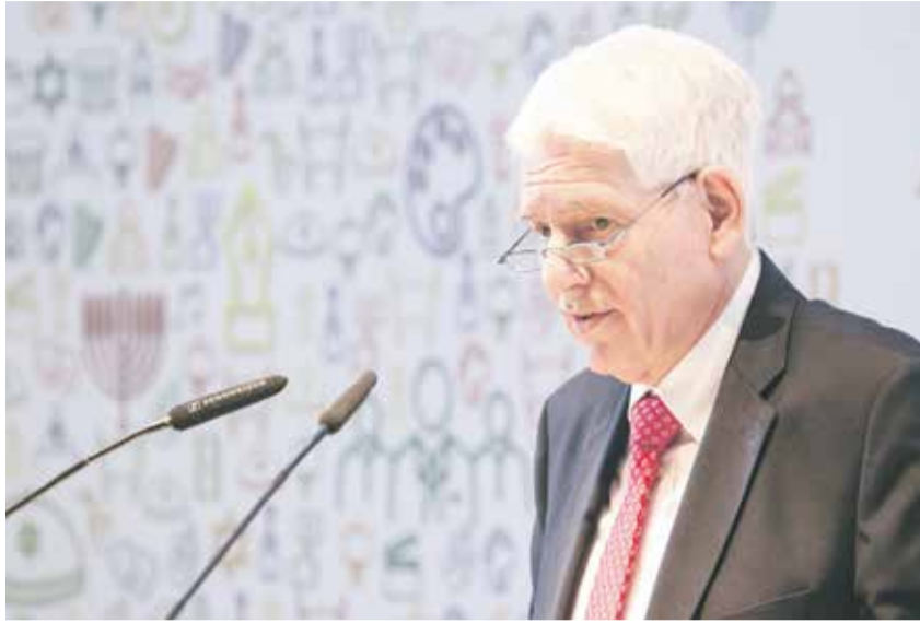
Politisches Denken: Dr. Josef Schuster bei der Tagung der Friedrich-Ebert-Stiftung

Im Lauf der Veranstaltung hob Dr. Schuster hervor, dass die jüdische Gemeinschaft in Deutschland sich aktiv am politischen Prozess beteilige. Juden brächten sich im gesamten politischen Spektrum ein und seien Mitglieder der demokratischen Parteien. Dabei beschäftige sich die jüdische Gemeinschaft keineswegs ausschließlich mit jüdischen Themen. Vielmehr greife jüdisches politisches Denken weiter. Es werde von der Verantwortung für die Mitmenschen bestimmt. „Diese Verantwortung füreinander ist die moralische Grundsubstanz des Judentums“, betonte der Zentralratspräsident. Gleichwohl gebe es auch Themen, von denen Juden in besonderem Maße beeinflusst oder sogar bedroht würden. Das Erfordernis, als Religionsgemeinschaft eine politische Stimme zu haben, sei daher offensichtlich. Als Bedrohung nannte Dr. Schuster Antisemitismus und rechtspopulistische Parteien. Gerade