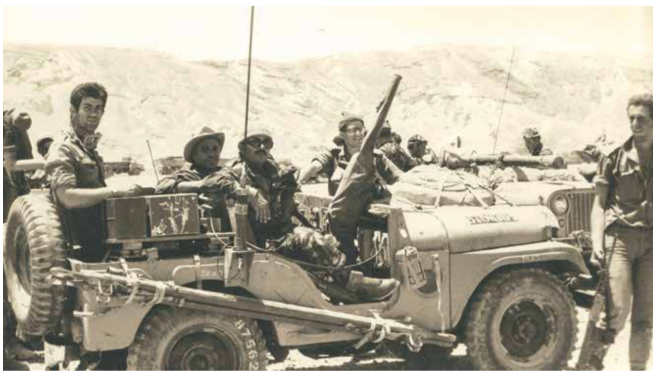
Errangen den Sieg: israelische Soldaten im Sinai

In der jüdischen Welt löste Israels Sieg eine gewaltige Umwälzung aus. Die Erleichterung war enorm. Der Erfolg, den die israelische Armee scheinbar so mühelos errungen hatte, war ja keine Selbstverständlichkeit. Das wochenlange Warten, das dem Präventivschlag vorangegangen war, hatte nicht nur den Israelis, sondern auch Juden in anderen Ländern Spannung und Angst beschert. Nach den sechs Tagen, in denen israelische Einheiten den ägyptisch-syrisch-jordanischen Belagerungsring gesprengt hatten, war die jüdische Welt außer sich vor Freude.