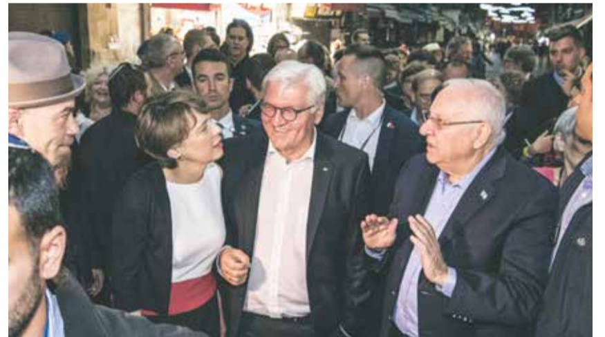
Etwas außerhalb der gewohnten Bahnen: Die Präsidenten Rivlin und Steinmeier besuchten den Jerusalemer Machane-Jehuda-Markt

Президент ФРГ Франк-Вальтер Штайнмайер посетил Израиль