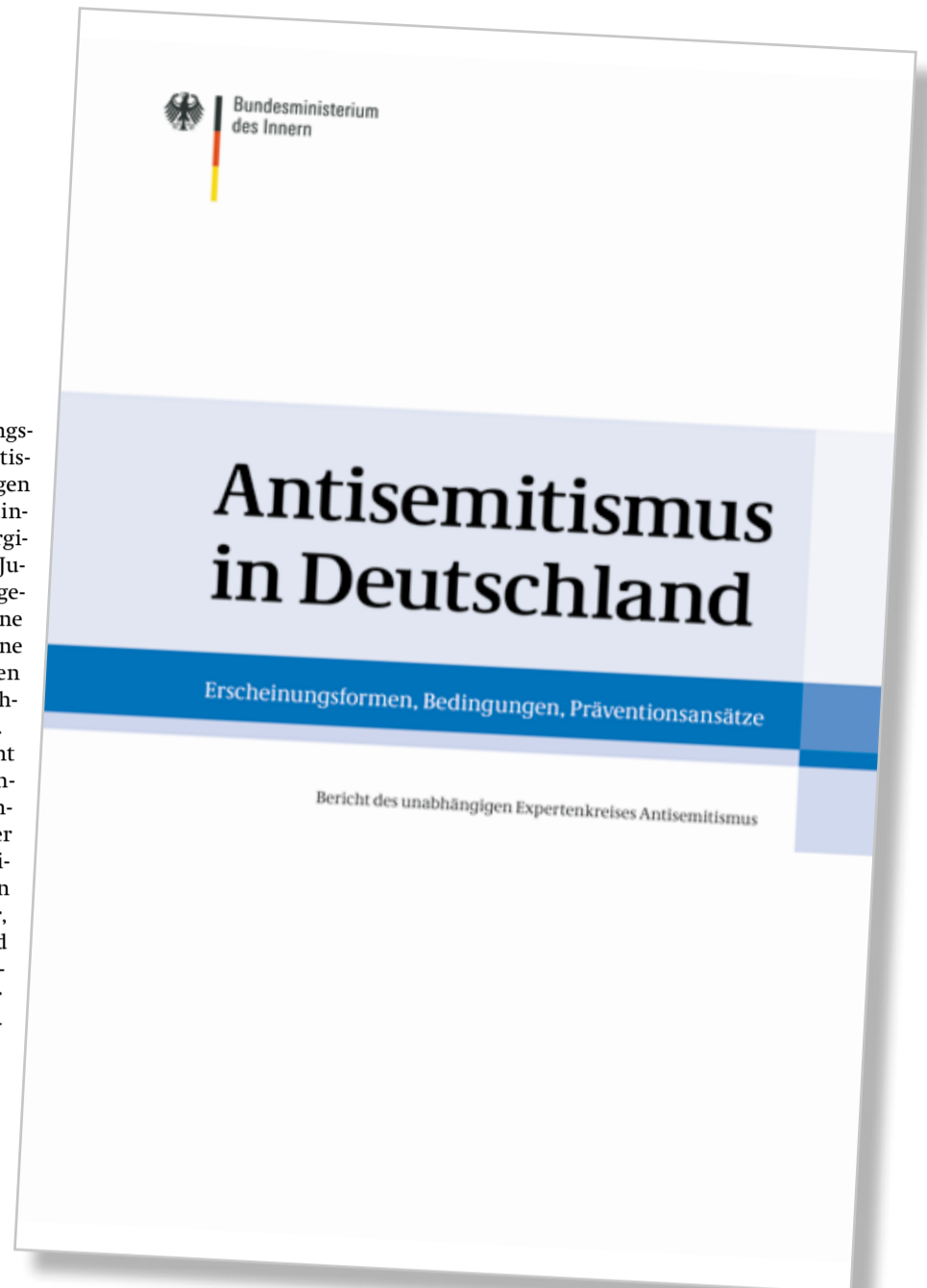
Notwendige Lektüre: der jüngste Antisemitismus-Bericht | Buchcover

Das Expertengremium nimmt auch die politischen Parteien in die Pflicht. Ihnen wird empfohlen, ihre eigenen Aktivitäten gegen den Antisemitismus regelmäßig auszuwerten und von unabhängigen Dritten auswerten zu lassen. Den Kirchen wiederum wird nahegelegt, bislang fehlende Erkenntnisse über die Verbreitung von Antisemitismus auf der Ebene einzelner Gemeinden durch die Förderung entsprechender Studien zu gewinnen.