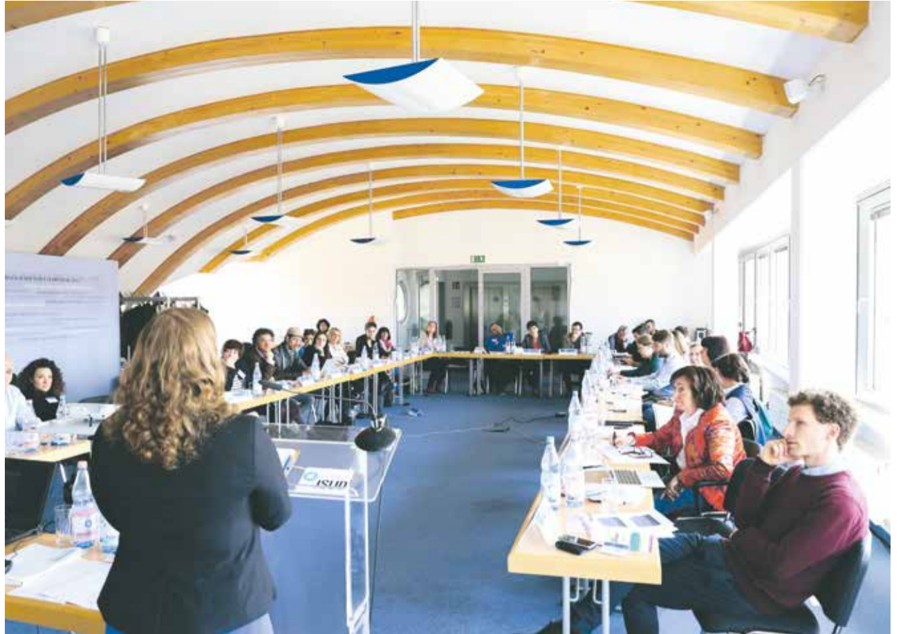
Nachwuchs fördern: Vertreter aus Gemeinden, Landesverbänden und jüdischen Organisationen trafen sich zum Informations- und Meinungsaustausch in Berlin