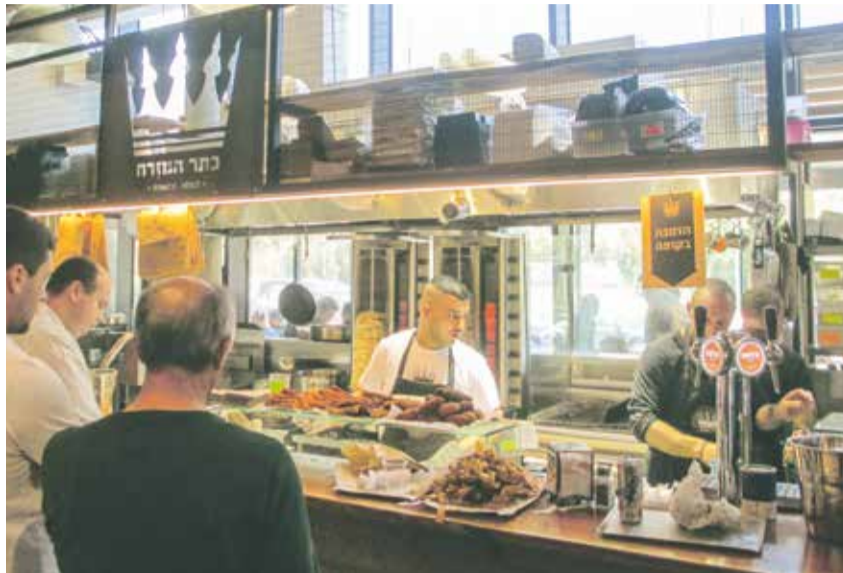
Küche, Kamera, Kaschrut? Schnellrestaurant in Tel Aviv

Die Kritik der Richter nahm das Oberrabbinat ernst: In diesem Monat bestä-