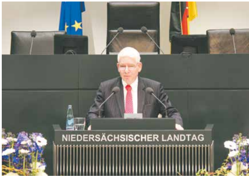
Eingehende Analyse: Zentralratspräsident Dr. Josef Schuster bei seinem Vortrag im Niedersächsischen Landtag

Als ein Beispiel nannte er die Israel-Feindschaft. Zwar sei das Vertrauen der jüdischen Gemeinschaft in die