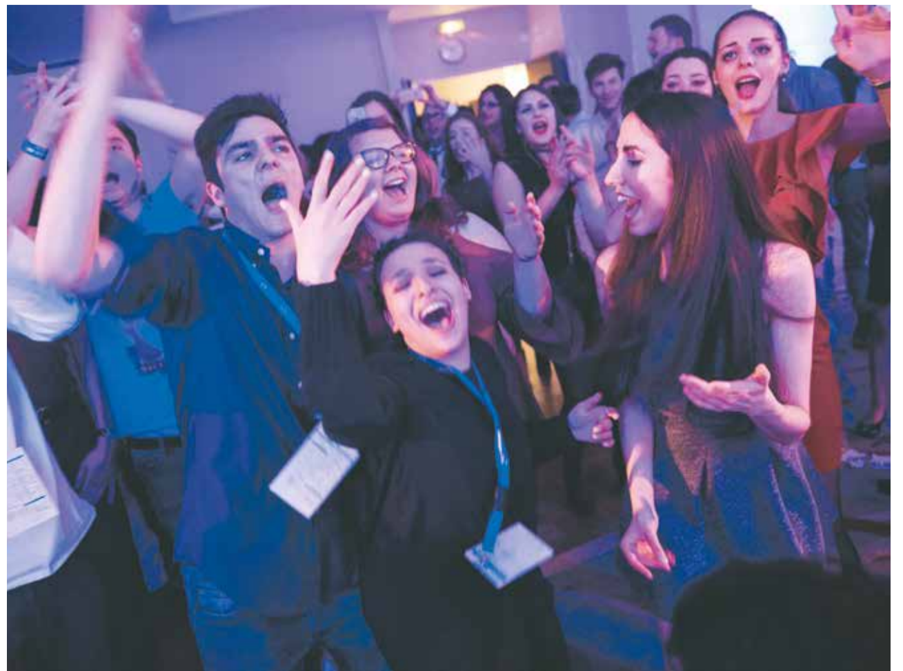
Alle Jahre wieder: Der Kongress tanzt

Ansonsten stand der Kongress in diesem Jahr im Zeichen des 100-jährigen Bestehens der ZWST, die zu den ältesten Wohlfahrtsorganisationen Deutschlands gehört. 1952 auf Beschluss des Zentralrats neu ins Leben gerufen, hat sie in den vergangenen Jahrzehnten eine Reihe von Herausforderungen bewältigt: von der Unterstützung von Holocaustüberlebenden in den ersten Nachkriegsjahren bis zur Integration der jüdischen Einwanderer aus der ehemaligen Sowjetunion nach 1990. Der Grundgedanke hat sich jedoch, wie Zentralratspräsident Dr. Josef Schuster in seiner Begrüßungsansprache betonte, nie geändert. Alles Handeln der ZWST beruhe auf der Idee der Zedaka, der Wohltätigkeit und Hilfe für Bedürftige, sagte er. Dr. Schuster hob außerdem hervor, wie wichtig die Unterstützung durch die Jüngeren für die Gemeinden sei: „Es ist dieses ehrenamtliche Engagement, das wir so dringend in unserer Gesellschaft und in unserer jüdischen Gemeinschaft brauchen. Dieses Engagement erzeugt Wärme. Gerade, da wieder ein kälterer Wind durch Deutschland weht, benötigen wir diese Wärme so sehr.“