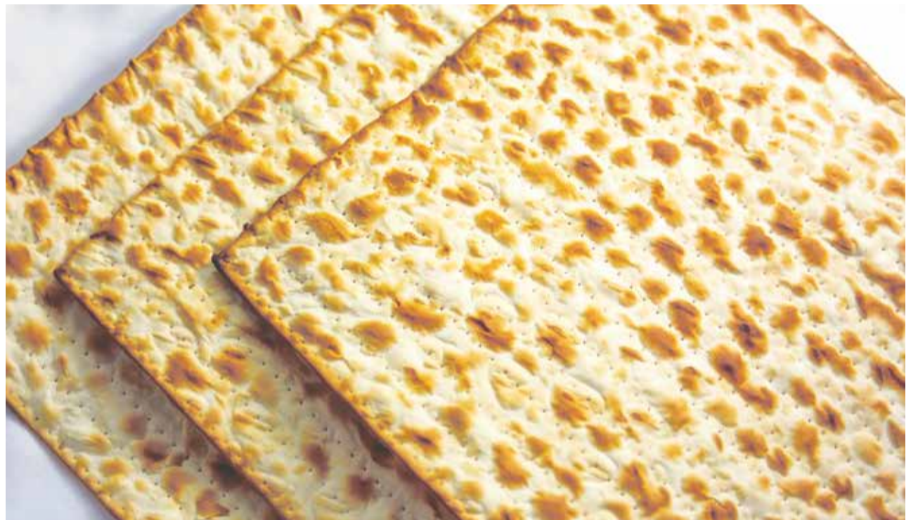
Mazzot: Brot der Bedrängnis, Brot der Freiheit | Foto: shutterstock

Pessach ist aber nicht nur ein Fest empfindener, sondern auch ganz konkreter Gemeinschaft, und zwar am Sederabend. Eine große Mehrheit der Juden weltweit nimmt am Seder teil, wobei auch Säkulare dies als einen selbstverständlichen Teil ihres Jüdischseins betrachten. Laut einer Umfrage