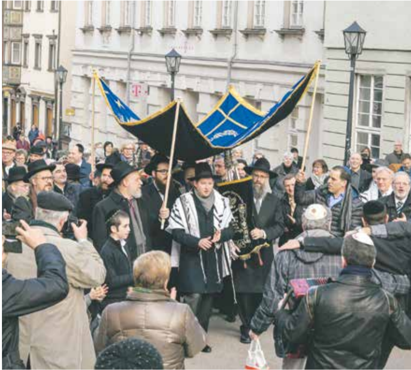
Mit der Tora zur neuen Synagoge: feierlicher Einweihungsumzug in Rottweil

Die jüdische Gemeinde im baden-württembergischen Rottweil ist relativ jung. Sie wurde erst 2002 gegründet. Das war dank der Zuwanderung aus der ehemaligen Sowjetunion möglich geworden. Allerdings war es nicht das erste Mal, dass sich eine jüdische Gemeinde in der Stadt konstituiert hat: Jüdische Präsenz in Rottweil ist bereits für das späte Mittelalter nachgewiesen. Um 1315 wurde erstmals eine jüdische Gemeinde innerhalb der Stadtmauern urkundlich erwähnt. Die Zahl ihrer Mitglieder lag bald bei fast 300. Nach der Vertreibung der Juden um das Jahr 1500 sollten allerdings drei Jahrhunderte vergehen, bis es wieder ein jüdisches Gemeindeleben gab.