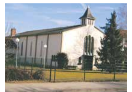
Beschenkt mit einem Glasfenster: Synagoge Bad Kreuznach

Незадолго до окончания срока своих полномочий федеральный президент Йоахим Гаук наградил Исаака Ольшанского (Кёльн) орденом ФРГ «За заслуги». Награду вручила обер-бургомистр Кёльна Хенриетта Рекер. В 1995 году по инициативе Ольшанского в общине была создана библиотека, которая сегодня насчитывает более 7000 книг на немецком, русском и английском языках, а также на иврите. Кроме того, Ольшанский, который пережил Вторую мировую войну, поддерживает работу Кёльнского центра документации периода нацизма.