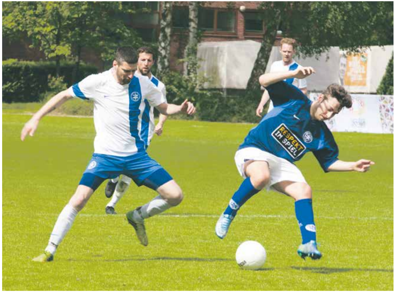
Ganz schön anstrengend: Makkabi Frankfurt (in Weiß) und Makkabi Berlin (in Blau) beim Fußballspiel

Die Meisterschaft in Duisburg war ein solches Zeichen. Mit wehenden Fahnen liefen die teilnehmenden Ortsvereine am Freitagabend bei der Eröffnungsfeier auf der Gymnastikwiese des Sportparks ein. Auch ein Feuer wurde entzündet, eine eigens komponierte Hymne präsentiert und anschließend das Eröffnungsspiel einer Mak-