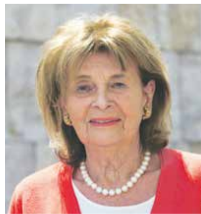
Begegnung ermöglichen: IKG-Präsidentin Dr. h. c. Charlotte Knobloch

В Еврейской общине Мюнхена и Верхней Баварии открылся новый центр досуга для людей, переживших Холокост, который называется «Кафе Целиг». По вторникам с 15 до 18 часов здесь проводятся музыкальные мероприятия и доклады. На открытии центра председатель общины д-р h.c. Шарлотта Knobloch сказала, что «Кафе Це-