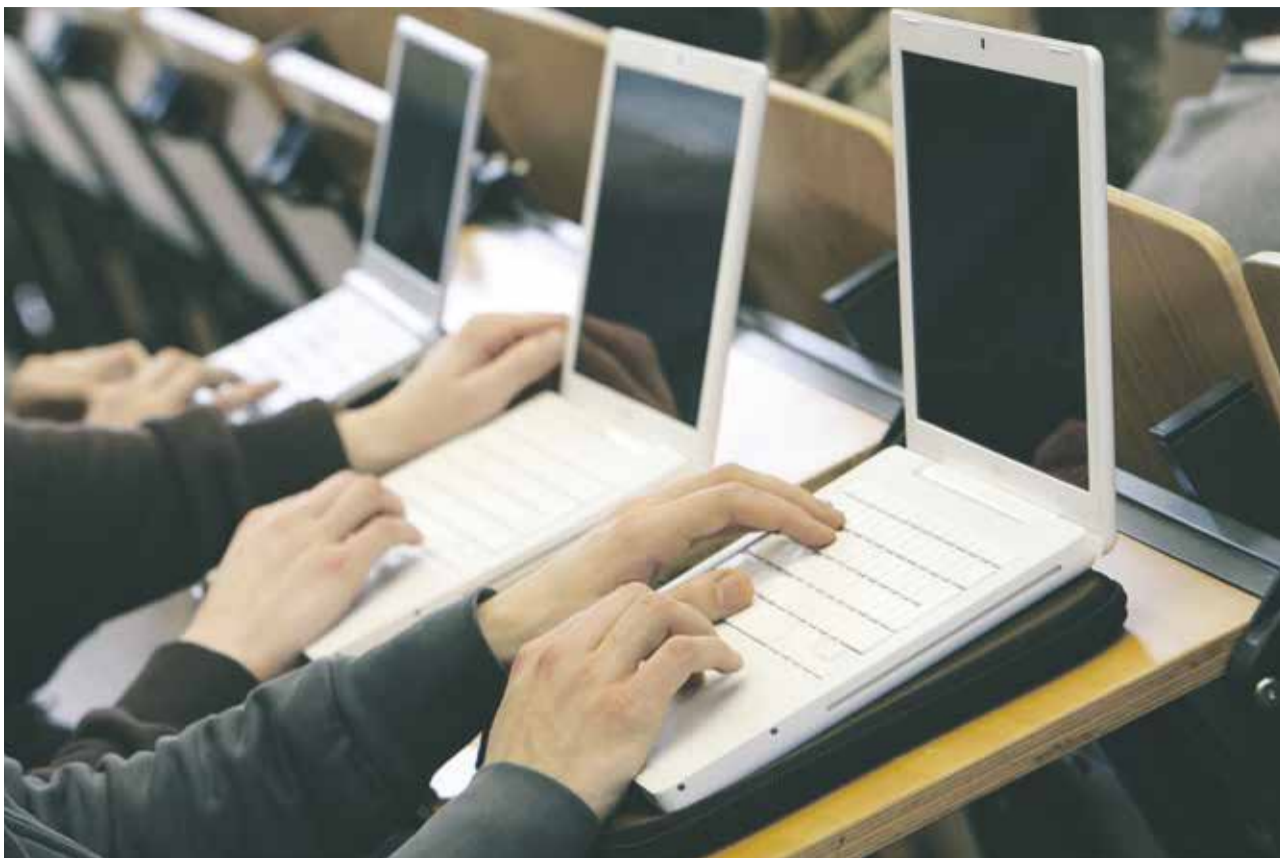
Nur als Hilfsmittel erlaubt: Computer durchdringen immer mehr unser Leben