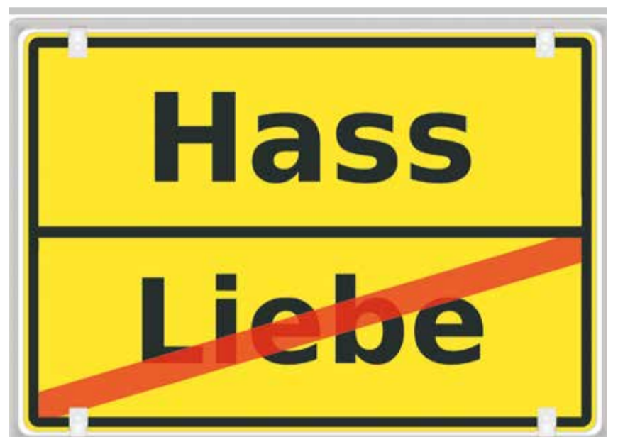
Hass: ein gefährliches Gefühl

Es gibt also viele Gründe, dem Hass entgegenzutreten. Sich nur in den ei-