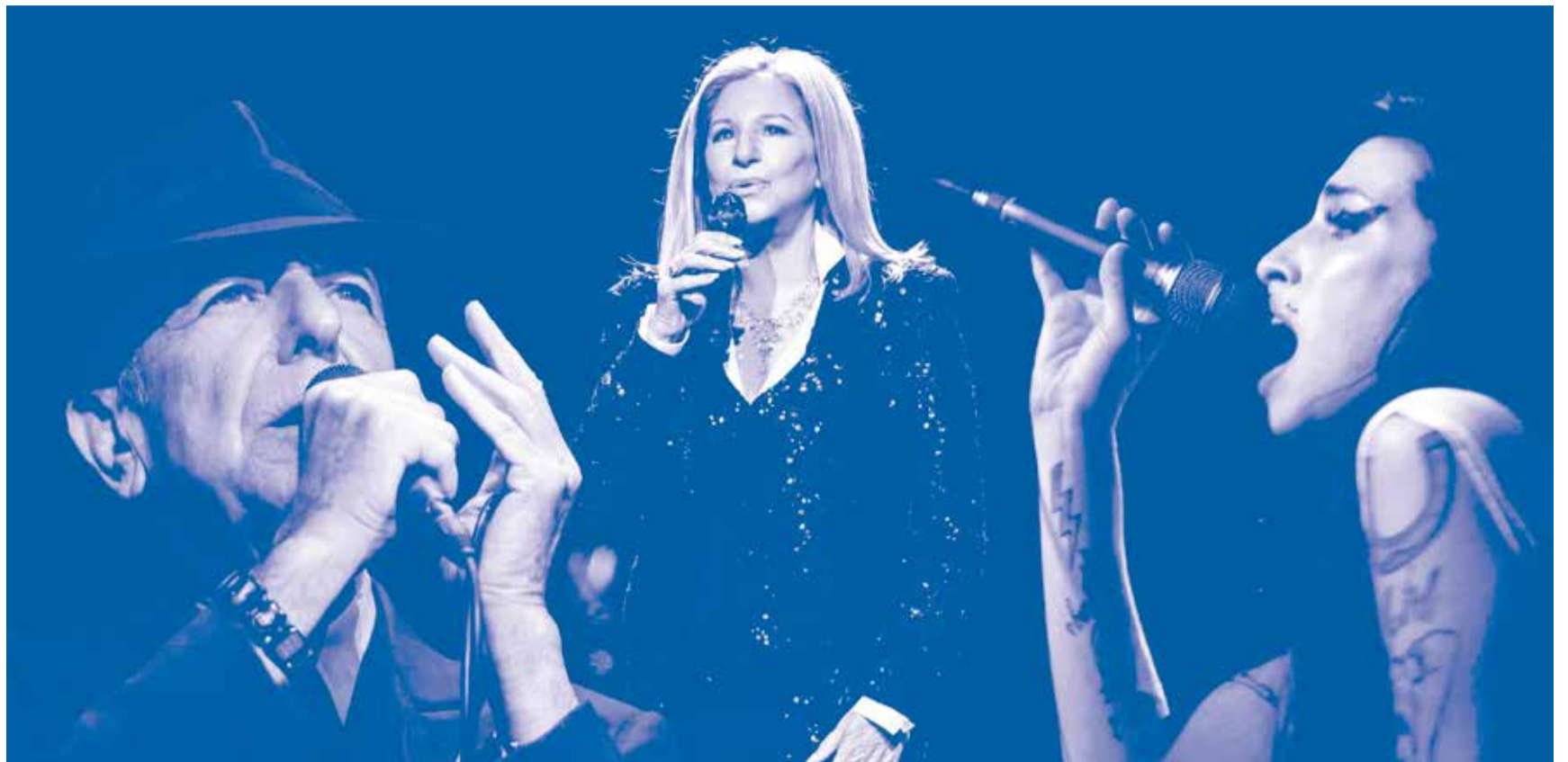
Stars des Sounds: Leonard Cohen, Barbra Streisand und Amy Winehouse

Der zweite Aspekt der Ausstellung betrifft das Leben der jüdischen Musiker in den USA als Angehörige der jüdischen Minderheit – auch wenn die meisten von ihnen säkular waren und sind. Jüdische Immigranten und deren Nachfahren taten sich oftmals mit anderen Minderheiten, darunter an prominenter Stelle mit Afroamerikanern, zusammen. Das galt für den Komponisten, Pianisten und Dirigenten George Gershwin, 1898 als Jacob Gershwitz, Kind russisch-jüdischer Immigranten, geboren, ebenso wie für Leonard Bernstein, der 1918 als Louis Bernstein in eine ukrainisch-jüdische Einwandererfamilie hineingeboren wurde. Gershwin hatte