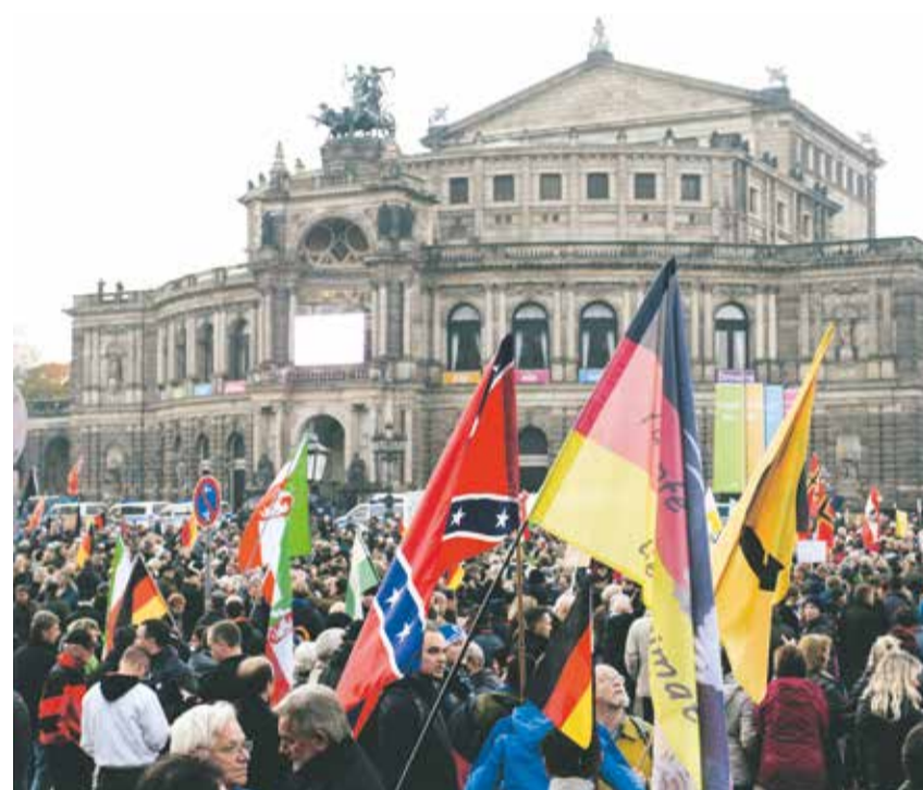
Keine Partner für die jüdische Gemeinschaft: rechtspopulistische Demonstration in Dresden

Das und mehr: In großen Teilen der deutschen Bevölkerung scheint sich der Eindruck festgesetzt zu haben, Juden und Moslems seien eine Art „natürliche“ Feinde. Dazu muss man deutlich sagen: Auch wenn uns klar ist, dass radikale muslimische Kreise in uns in der Tat Feinde sehen, unterstellen wir keineswegs „den“ Moslems, diese Auffassung zu teilen. Aus jüdischer Sicht gibt es ohnehin keinen Grundsatzkonflikt mit dem Islam. Trotz theologischer Unterschiede erkennt das Judentum den Islam als eine streng monotheistische Religion an. Im Lauf von Jahrhunderten lebten Juden und Moslems in vielen