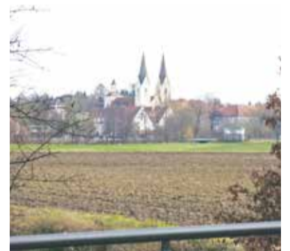
Geschützt: Im Kloster Indersdorf befand sich das UNO-Kinderzentrum

народном детском центре ООН. Временами в нём проживало несколько сотен детей-сирот, семьи которых погибли во время Шоа. Выставка была создана по инициативе историка Анны Андлауэр. На её от-