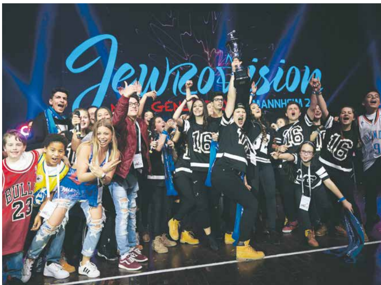
Gewonnen: Mannheimer Jugendliche errangen bei der Jewrovision erneut den ersten Platz

Und die konnte sich durchaus sehen und hören lassen, auch wenn nicht jeder Ton und jeder Schritt hundertprozentig saß. Den Spaß und die Leidenschaft für das gemeinsame Tun brachten alle Gruppen so deutlich zum Ausdruck, dass das Publikum von