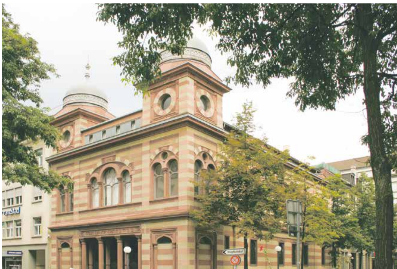
Da, um zu bleiben: Synagoge Löwenstraße in Zürich

Von da bis zur Einsicht der Schweizer Regierung, dass man wohl nicht allein den ausländischen Juden die Niederlassungsfreiheit gewähren könne und den „eigenen“ Schweizer Juden nicht, war der Weg dann nicht mehr so weit. So schrieb der Schweizer Bundespräsi-