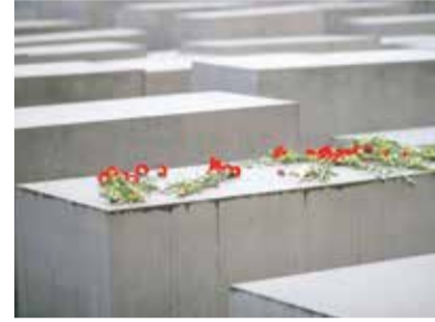
Besuchermagnet: Holocaust-Denkmal in Berlin