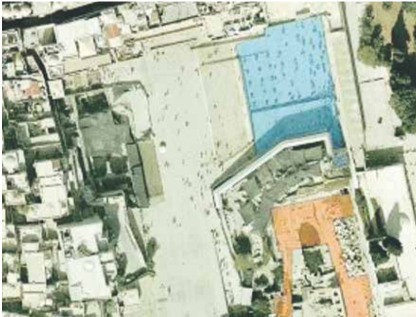
Der Plan: blau – bisheriger Vorplatz der Westmauer, orange – die vorgesehene Fläche des nichtorthodoxen Vorplatzes

Израильская Regierung billigt die Schaffung eines nichtorthodoxen Gebetsareals an der Westmauer