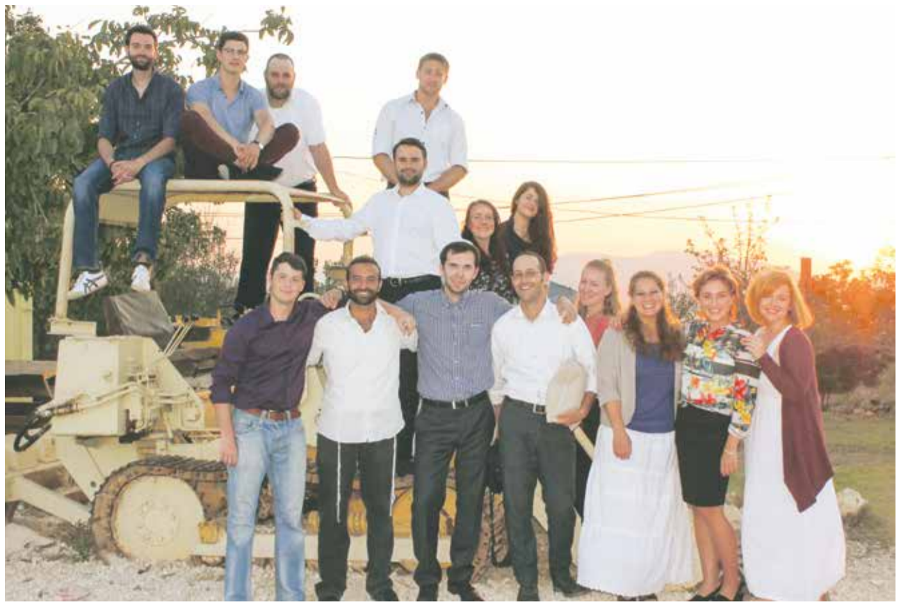
Gemeinsam erleben: Morasha-Gruppe in Israel

Wenn die „Chemie“ in den Lerngruppen stimmt, entsteht häufig auch mehr Lust auf gelebte Gemeinschaft. Regelmäßig feiern Morasha-Studenten zusammen Schabbat oder treffen sich an jüdischen Feiertagen. Sehr beliebt ist der jährliche „nationale Shabbaton“, bei dem sich die Teilnehmer in einer europäischen Großstadt – wie Amsterdam 2014 und Prag 2015 – für ein gemeinsames Studien-Wochenende treffen. Als mindestens ebenso attraktiv erweisen sich inzwischen angebotene Morasha-Auslandsreisen, bei denen historische Spurensuche, Naturerlebnisse und gemeinsames Studium kombiniert werden. Noah Kunin erklärt: „Auf der einen Seite gibt bei