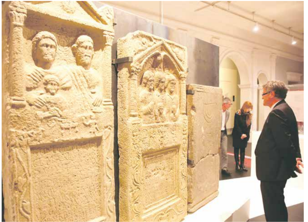
Ausgestellt: Steine können nicht sprechen, aber sie sagen viel. | Foto: R. Herlich

Gleich mehrere Karten verraten etwas darüber, wo überall in den Provinzen des Riesenreichs Juden gelebt haben müssen. So etwa sind Orte rot markiert, in denen es wohl eine Synagoge gab. Eine andere Übersicht verzeichnet alle Fundstellen jüdischer Schmuckstücke und Gebrauchsgegenstände. Man staunt, mit wie vielen roten Punkten diese Karten übersät sind: Jüdische Spuren finden sich im heutigen Ungarn genauso wie in der Schweiz und dem damaligen Germanien. Das lässt den Schluss zu, dass Juden seit dem 2. und 3. Jahrhundert am Aufbau der römischen Provinzen jenseits der Alpen beteiligt waren. Allerdings waren Synagogen mitunter schwerer als solche zu erkennen, da ihr Bau zunächst keinem übergeordneten Plan folgte und es beispielsweise noch nicht vorgeschrieben war, die Torarollen in einem Schrein an der Ostseite des Gebäudes zu verwahren. So lassen sich nur 70 Synagogen mit Sicherheit nachweisen, vermutlich aber waren es mehrere Tausend, die sich zum Teil