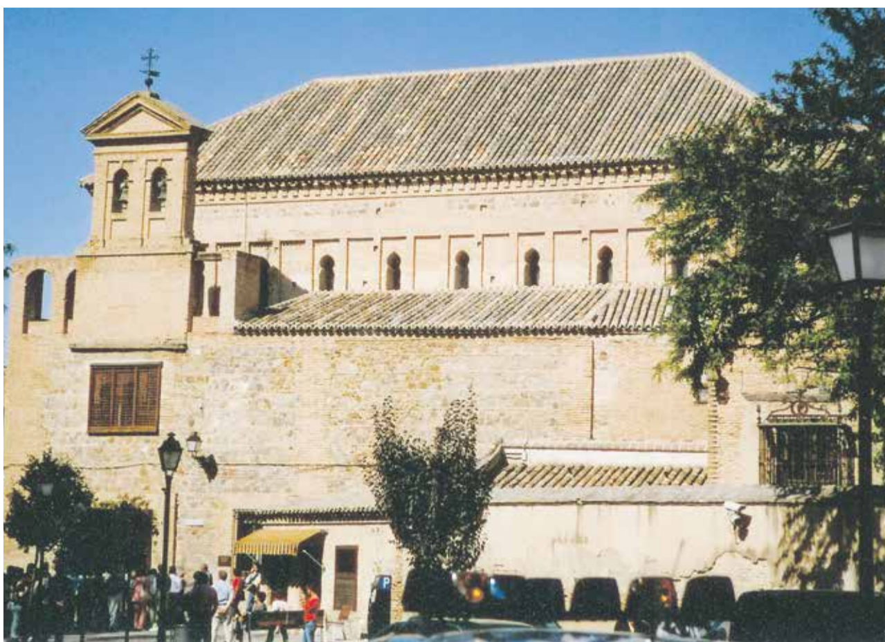
Quell des Wissens: ehemalige Synagoge in Toledo

Das Judentum war die einzige antike Zivilisation, die eine allgemeine Pflicht zur Bildung kannte, und sei es,