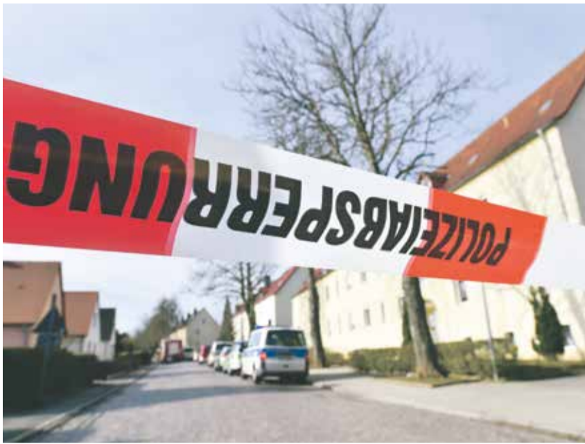
Kontra Hass: Feuerwehr und Polizei vor der geplanten Unterkunft für Asylbewerber in Tröglitz