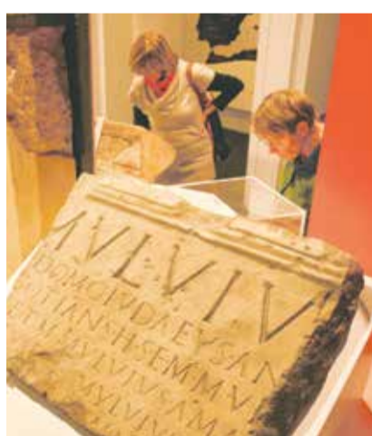
Zeugnis der Vergangenheit: alte Inschrift im Frankfurter Museum

Например, посетители узнают, что в I веке н. э. в Риме, население которого составляло более миллиона человек, проживали около 50000 евреев. Об этом свидетельствуют многочисленные надгробные надписи в еврейских катакомбах, как правило, на греческом языке. Часто в них упоминается высокий пост, который усопший занимал в синагоге. На всех надгробьях рядом с именем высече-