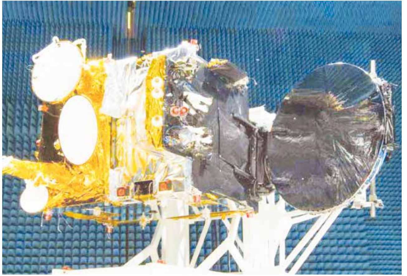
Hightech am Himmel: der israelische Kommunikationssatellit Amos 3

Eine Kombination aus Wissen und Initiative hat Israel in die internationale Hightech-Elite katapultiert