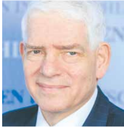
Dr. Josef Schuster

Der Zentralrat der Juden in Deutschland befürwortet die Anerkennung des Massakers an den Armeniern als Völkermord. Das hat Zentralratspräsident Dr. Josef Schuster gegenüber der Zeitung „Der Tagesspiegel“ erklärt. Dr. Schuster führte aus: „Vor 100 Jahren wurden im Osmanischen Reich auf Befehl der Regierung mehr als eine Million Armenier deportiert. Sie wurden direkt ermordet oder verhungerten und verdursteten in der Wüste. Dieses schreckliche Geschehen sollte als das bezeichnet werden, was es war: ein Genozid.“ Die Bundesregierung, so Dr. Schuster ferner, stehe hier auch deshalb in einer besonderen Verantwortung, weil deutsche Offiziere damals zu den Mitwissern und Mittätern gehörten. Zudem habe sich Hitler den Völkermord an den Armeniern quasi zum Vorbild für die Vernichtung der Juden genommen. Nach Auffassung des Zentralratspräsidenten sei es mehr als überfällig, dass sich die Türkei ehrlich mit ihrer Vergangenheit auseinandersetze. Die Chancen dafür stiegen, je mehr Staaten den jüngsten Äußerungen von Papst Franziskus I. folgten und den Genozid an den Armeniern beim Namen nannten. zu