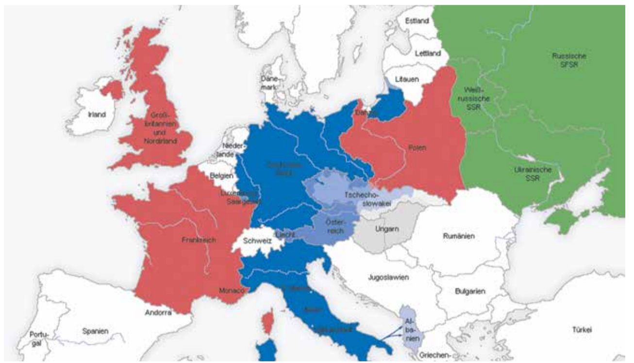
Am Abgrund: Europa vor dem Zweiten Weltkrieg

Anders ist es bei den Nachfahren der Alliierten. Sie begehen das Kriegsende als Tag des Sieges. Sie sind zu Recht auf die historische Rolle ihrer Länder in dem Kräftemessen, in dem es nicht mehr und nicht weniger als um die Zukunft der Menschheit ging, stolz.