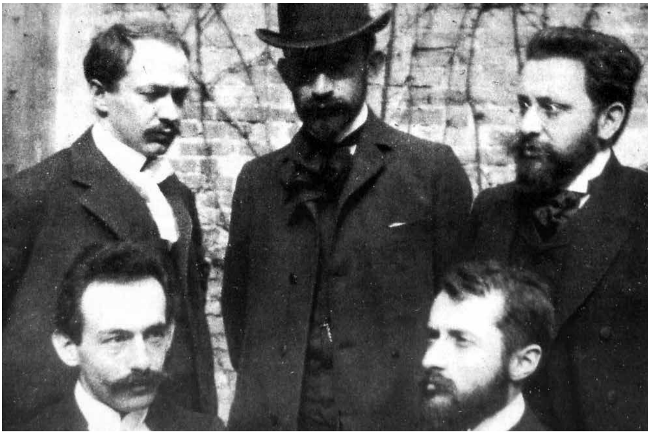
Berlin 1902 (v. l. n. r.): E. M. Lilien, Chaim Weizmann, Davis Trietsch (stehend), Berthold Feiweil und Martin Buber (sitzend) riefen den Jüdischen Verlag ins Leben