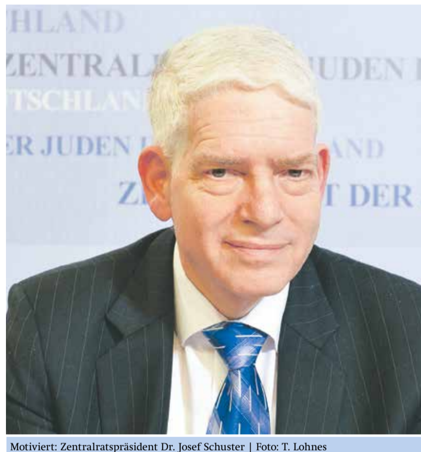
Motiviert: Zentralratspräsident Dr. Josef Schuster

Gleich nach Ihrer Wahl haben Sie gesagt, der Zentralrat werde sich weiterhin dem Problem des Antisemitismus zu stellen haben. Was planen Sie auf diesem Gebiet?