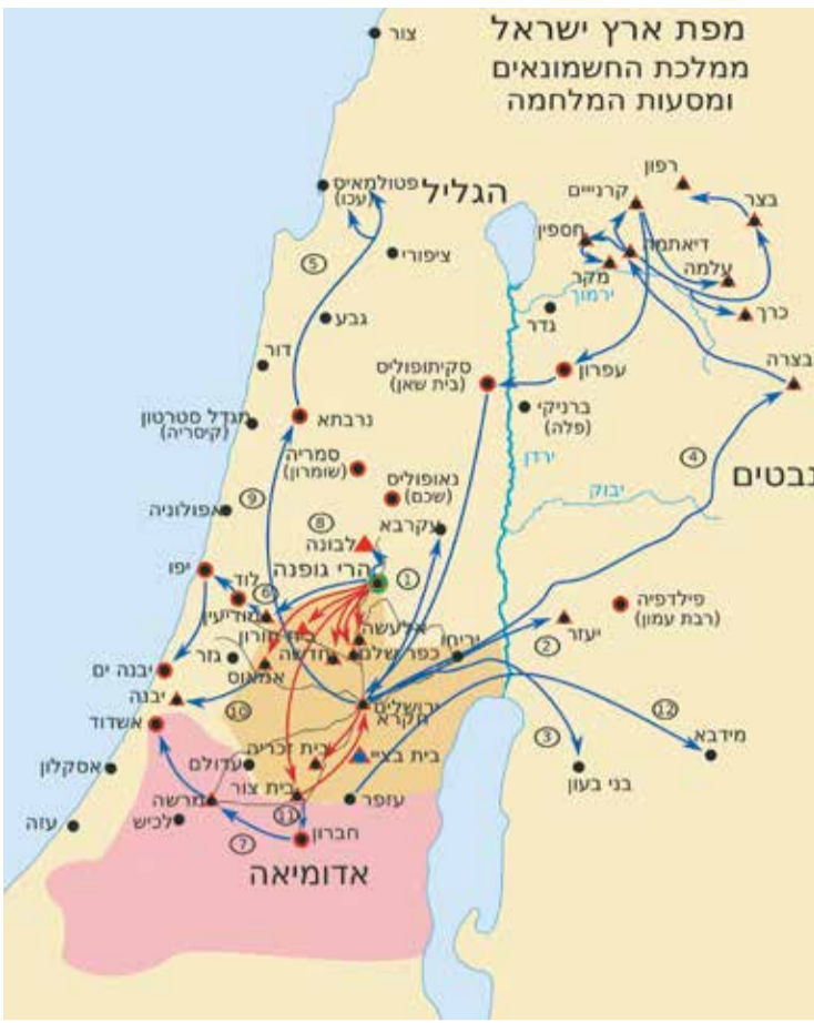
Карта des Landes Israel: das Königreich der Hasmonäer und die Kriegshandlungen (1.), Der Makkabäeraufstand, Bildfeld an der großen Knesset-Menora (r.)