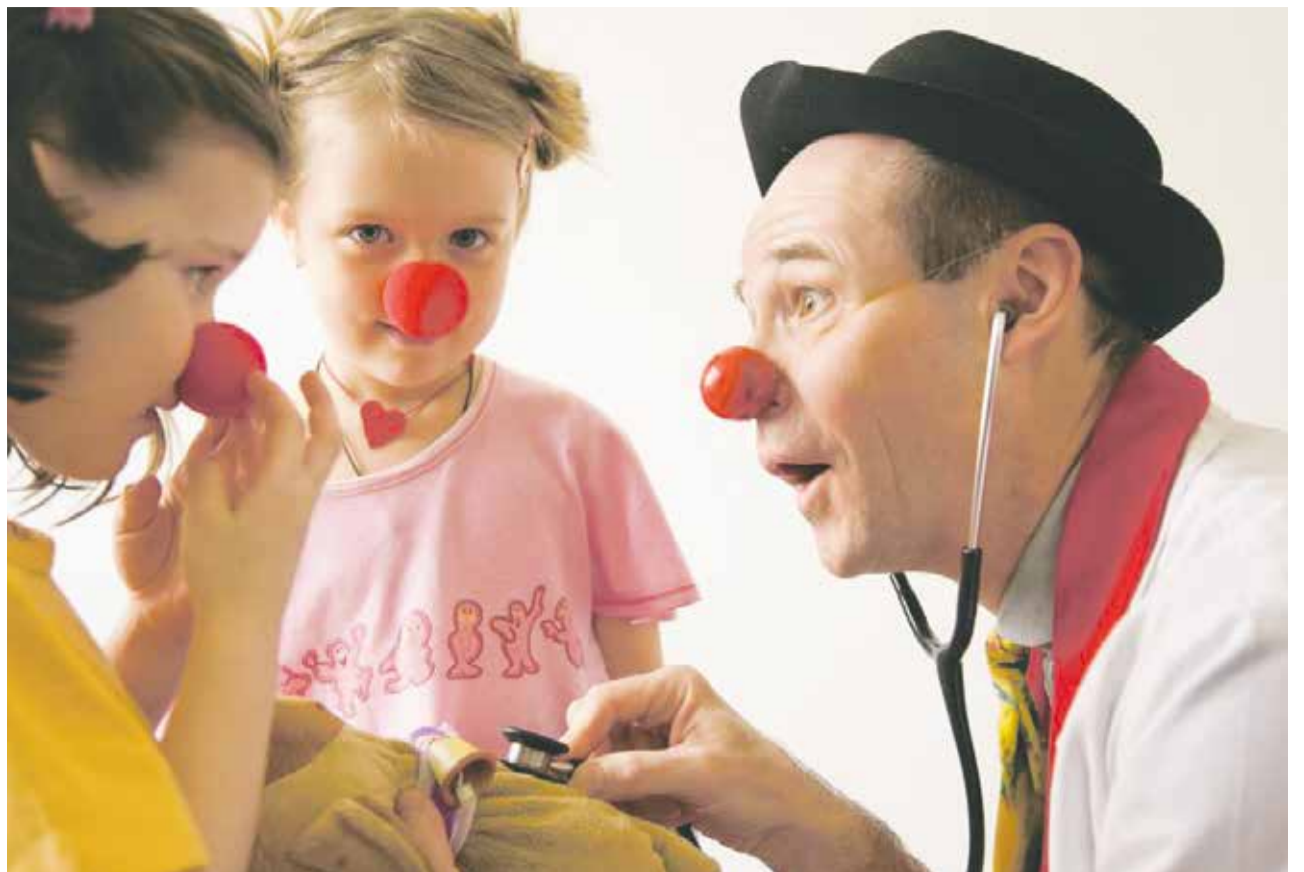
Лachen ist gesund: medizinischer Clown mit kranken Kindern