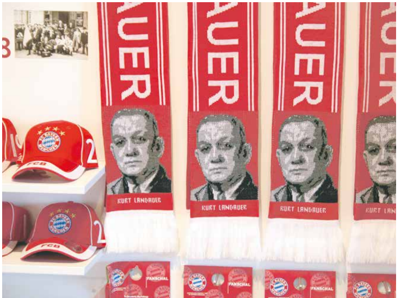
Leider nur Museumsstück: Kurt-Landauer-Fanschal

So hatten die Bayern nach Kriegsende langwierige Aufbauarbeit zu leisten, um sich in der Fußballwelt wieder nach oben zu kämpfen, und auch jetzt war Landauer zur Stelle. Er kehrte nach München zurück und half dem