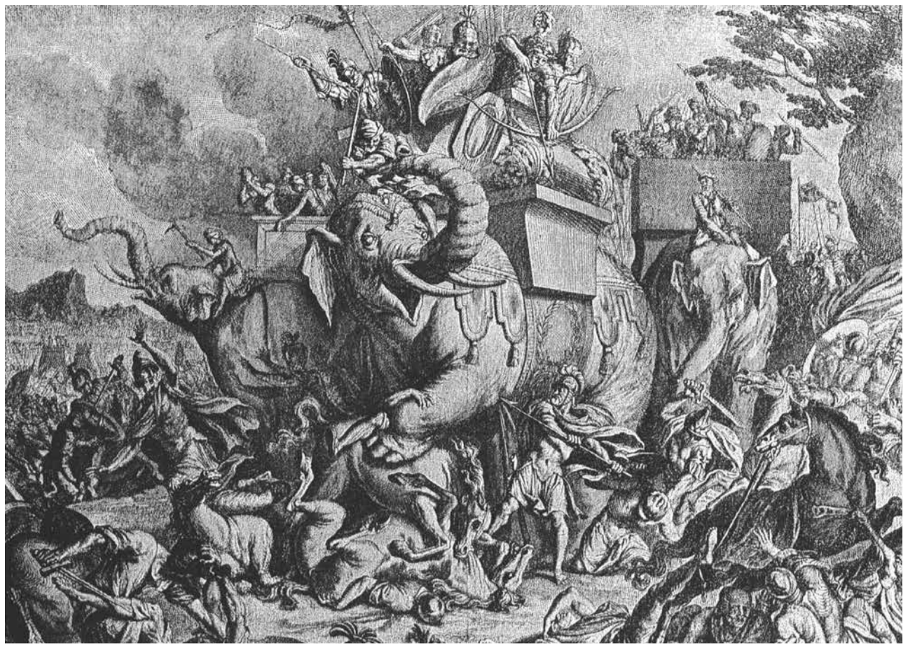
Kampf um Unabhängigkeit: die Makkabäer auf einem Kupferstich von Bernard Picart (um 1730)

Letztendlich aber scheiterte die durch die Makkabäer begründete jüdische Eigenstaatlichkeit an einer Gesetzmäßigkeit der Antike: Dass kleinere Völker oder Staaten tatsächliche politische Unabhängigkeit erreichten, war meist nur dann möglich, wenn die über sie herrschende Großmacht geschwächt und im Niedergang begriffen war – wie eben das hellenistische Reich. Auf Rom aber traf das nicht zu. Mochten sich die Makkabäer anfangs noch durch Freundschaftsverträge mit der aufstrebenden Großmacht gut stellen, so hatte Rom letztendlich kein Interesse an einem eigenständigen jüdischen Staat.