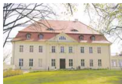
Schloss Gollwitz

Im November wurde im Schloss Gollwitz in Brandenburg/Havel eine von Potsdamer Geschichtsstudenten und angehenden Lehrern zusammengestellte Ausstellung eröffnet. Die Ausstellung ist historischen Zeugnissen