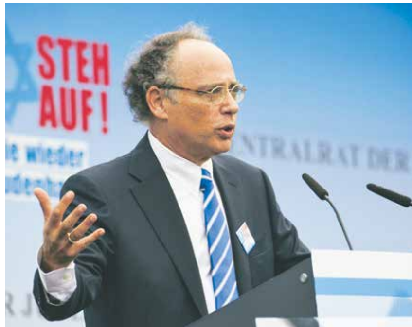
Direkte Rede: Zentralratspräsident Dr. Dieter Graumann

Аuszüge aus der Rede von Zentralratspräsident Dr. Dieter Graumann