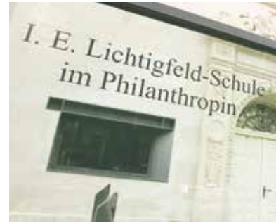
Identität vermitteln: die I. E. Lichtigfeld Schule in Frankfurt | Foto: dpa

Die I. E. Lichtigfeld Schule ist nicht nur bei Juden beliebt. Nach Angaben der Schule sind rund 25 bis 30