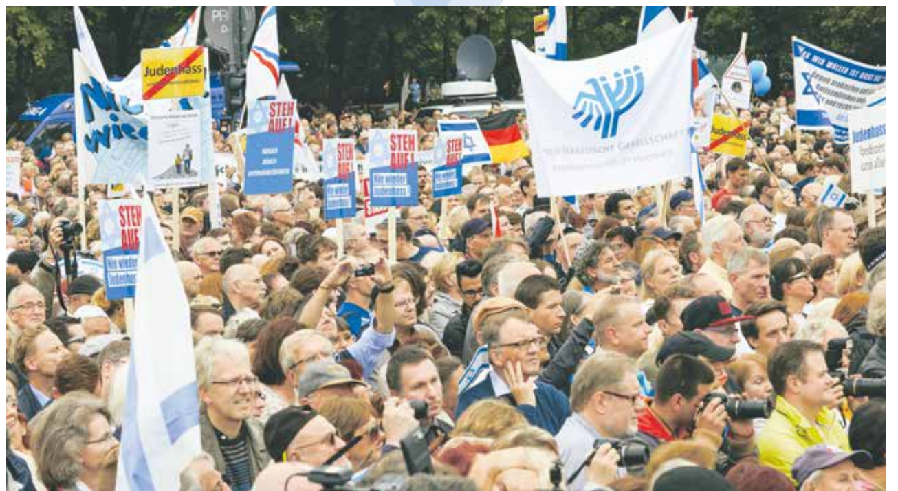
Couragierte Bürger: Tausende nahmen an der Kundgebung des Zentralrats teil