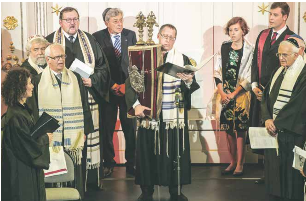
Zwischen Geschichte und Zukunft: Rabbiner- und Kantorenordination in Breslau