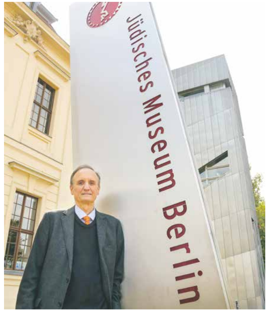
Wissensreich: Professor Peter Schäfer am neuen Arbeitsplatz

Peter Schäfer löst W. Michael Blumenthal als Chef des Jüdischen Museums Berlin ab