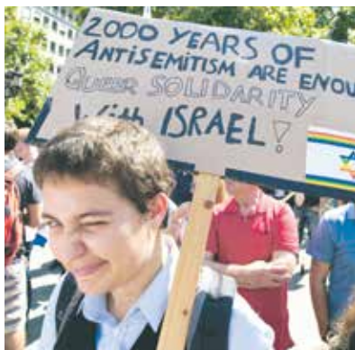
Auch in Frankfurt: Kundgebung gegen Antisemitismus am 31. August

Evrei, podvergnavšiesja nacist-skim prsedlovaniyam i pereživšiesja Šoa v det'skom vozraste, pri opredel'nykh uslovnykh smogut poluchit' edinovremennuyu vyplatu v razmere 2500 evro. Eto predusmotreno novym soglaseniem meždu Konferenciej po material'nykh pretenzijam evreev k Germanii (Klejms Konferencija) i ministerstvom finansov FRG. Kak soobščila v sentjabre Klejms Konferencija, pravo na polučenie etoj vypłaty imejut liца, kotorye rodilis' posle 1 janyvarya 1928 goda i vo vremja Šoa nachodilis' v zaključenii v konclagerjakh ili getto ili kak minimum polgodu byli vynuzhdeny skryvatsja v podpol'e ili po žit'ju po poddel'nykh dokumentam.