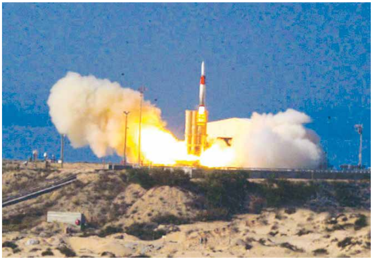
Gut gegen Diktaturen: die israelische "Pfeil"-Rakete im Versuch

Solche militärische Macht ermöglicht es dem kleinen Land, seine Rolle als Verbündeter des Westens besonders glaubwürdig zu erfüllen. Es bedeutet nicht, dass Israel in sicherheitspolitischer Sicht, vor allem bei der Versorgung mit Waffen, autark wäre. Das sind auch viel größere Staaten nicht. Allerdings kann es im Krisenfall für sich selbst sorgen, statt – wie manche