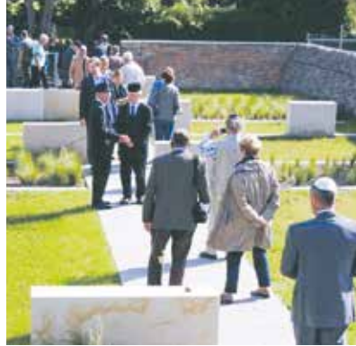
Ort der Erinnerung: die neue Gedenkstätte in Mittenwalde