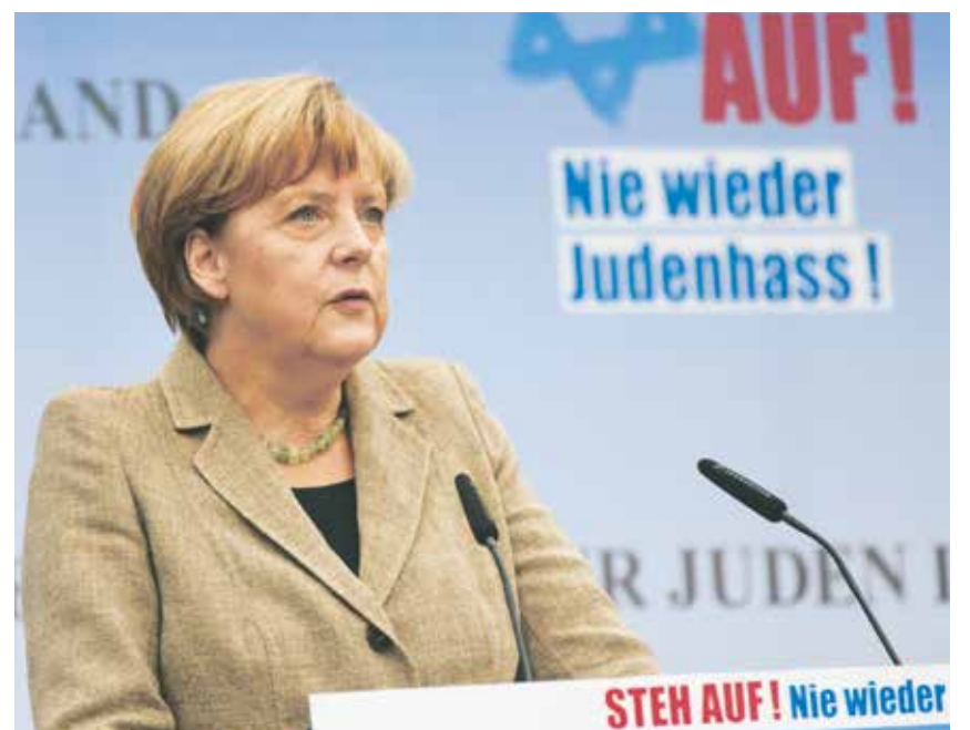
Solidarisch: Bundeskanzlerin Dr. Angela Merkel bei der Kundgebung

Выдержки из речи канцлера ФРГ д-ра Ангелы Меркель