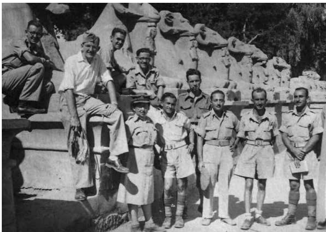
Бündnis mit Tradition: Jüdische Soldaten aus dem Mandatsgebiet Palästina 1944