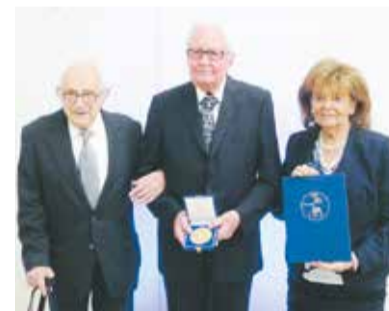
Der Geehrte und die Ehrenden: Hans-Jochen Vogel (m.) mit Laudator Fritz Stern und Gemeindepräsidentin Charlotte Knobloch