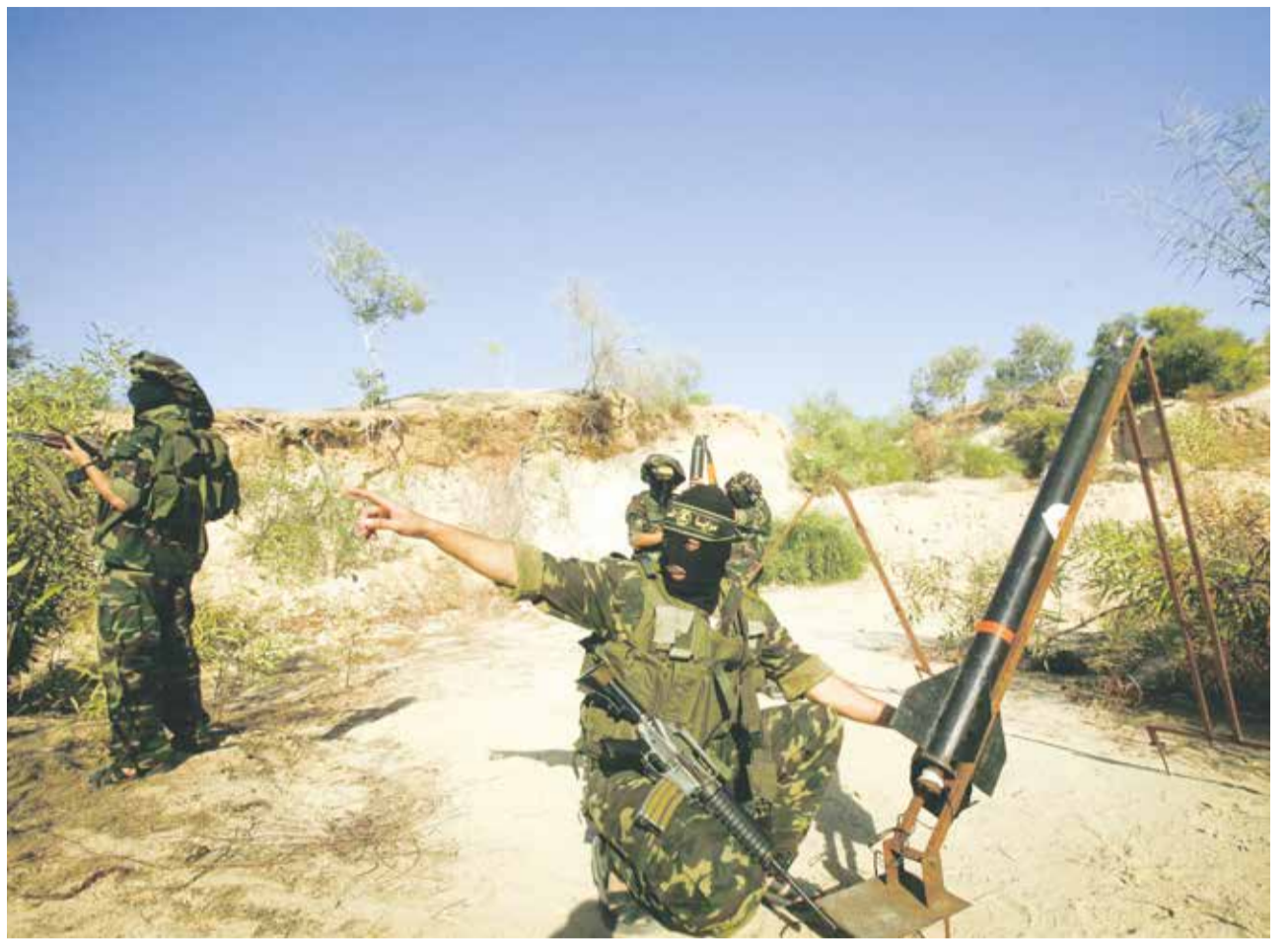
Juden im Visier: Palästinensische Raketenschützen im Gaza-Streifen

Wie ernst sie es meint, zeigte die Hamas denn auch prompt: Im Juli brach sie einen Raketenkrieg gegen Israel vom Zaun und machte sich schwerwiegender Kriegsverbrechen schuldig. Zum einen ist der Beschuss israelischer Ziele mit dem Ehrgeiz, möglichst viele Juden zu töten, ein klarer Verstoß gegen das Völkerrecht. Zum anderen