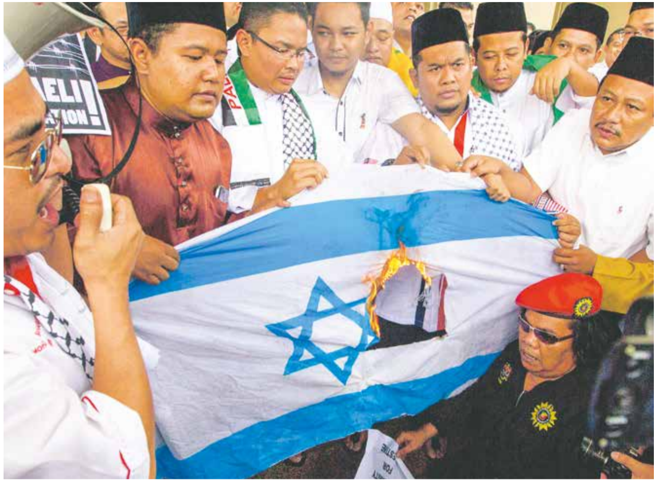
Woher der Hass? Verbrennung der israelischen Flagge in Malaysia

Diese Ergebnisse lassen sich unter vielen Aspekten auswerten. Einer der bizarrsten davon ist mit Sicherheit dieser: Unter Personen, die laut Eigenangabe nie einem Juden begegnet sind – und das waren drei Viertel aller Befragten –, lag der Anteil der antisemitisch Belasteten bei 25 Prozent, während der Indexwert für die Gesamtheit der Befragten 26 Prozent betrug. Anders ausgedrückt: Laut der Umfrage hat eine Dreiviertelmilliarde Antisemiten noch nie einen Juden persönlich gesehen. Wie ein ge-