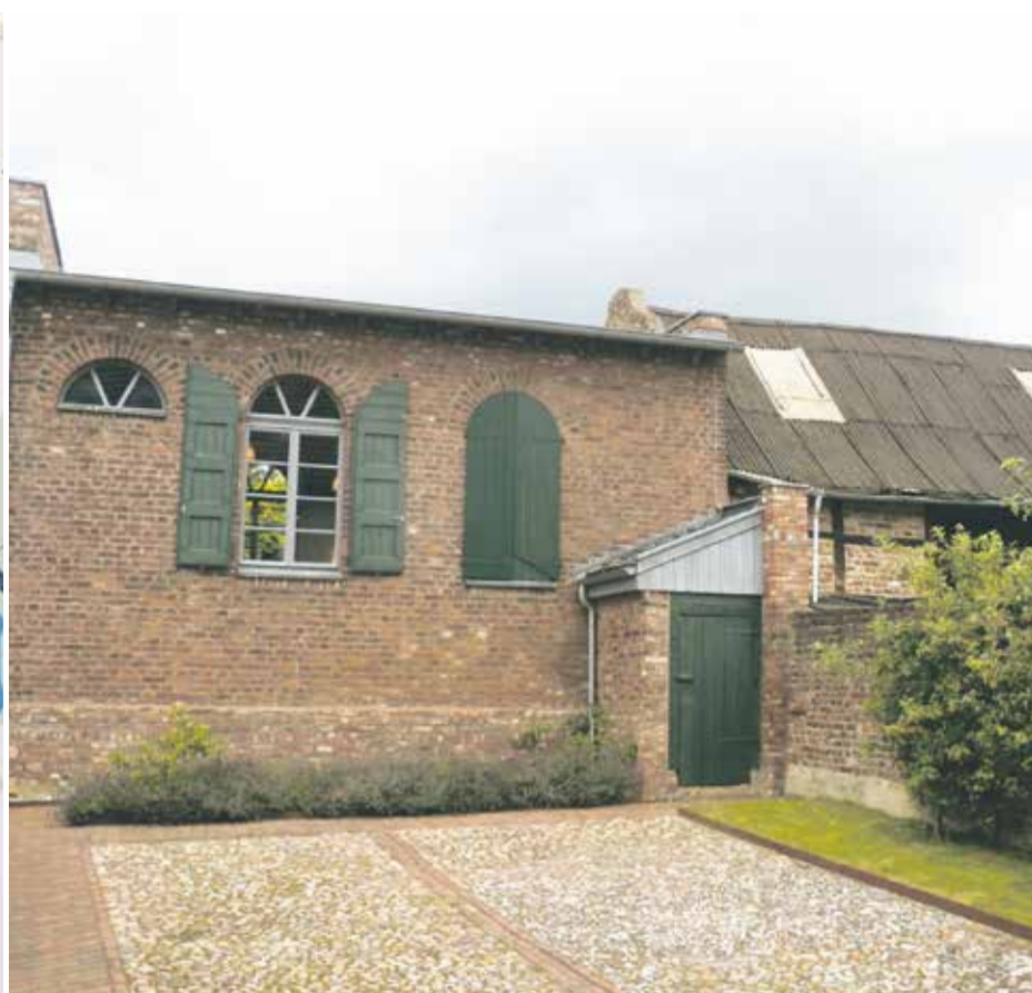
Spuren: Ausstellung zum Landjudentum in Mönchsondheim (l.), ehemalige Landsynagoge in Rödingen

Spuren des Landjudentums sind heute in vielen Orten erhalten. In Mönchsondheim, jetzt Teil der Stadt Iphofen, zeugt ein „Judensteig“ von der einstigen jüdischen Präsenz. Die Viehhändler aus dem Nachbarort Hüttenheim mussten diesen Weg nehmen. In Veitshöchheim gab es seit dem frühen 18. Jahrhundert eine Synagoge. Auch an anderen Orten finden sich Friedhöfe, Schul- und Wohnhäuser oder Dorfsynagogen. Hin und wieder wird sogar auf einem Dachboden eine Genisa (Aufbewahrungsort für heilige Schriften) entdeckt.