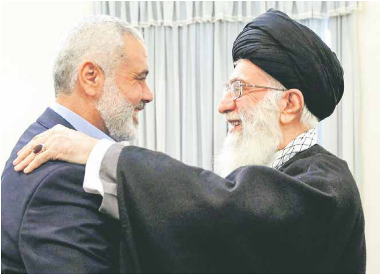
Dschihadisten unter sich: Hamas-Führungsmittglied und Ex-Premier von Gaza Ismail Hanije (l.) mit Irans "Oberstem Führer" Ajatollah Ali Chamaneh