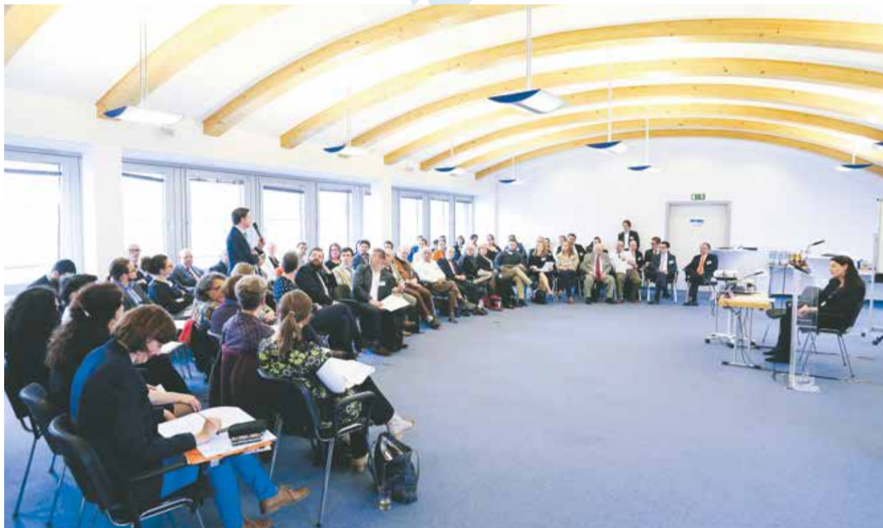
Wichtige Themen: Diskussion beim Berliner Round Table

Dass eine Dialogbühne gerade für die facettenreiche und über das ganze Land verstreute jüdische Gemeinschaft in der Bundesrepublik besonders wichtig