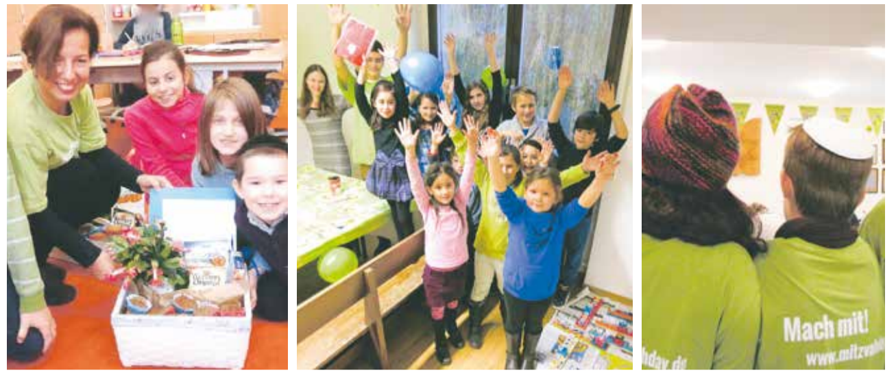
Gute Tat: Mitzvah Day 2013 in Frankfurt, Pforzheim und Emmendingen (v. l. n. r.)

Der Zentralrat der Juden in Deutschland ruft zur Teilnahme am Mitzvah Day 2014 auf