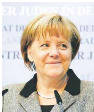
Unter Freunden: Kanzlerin Merkel bei der Ratstagung 2012