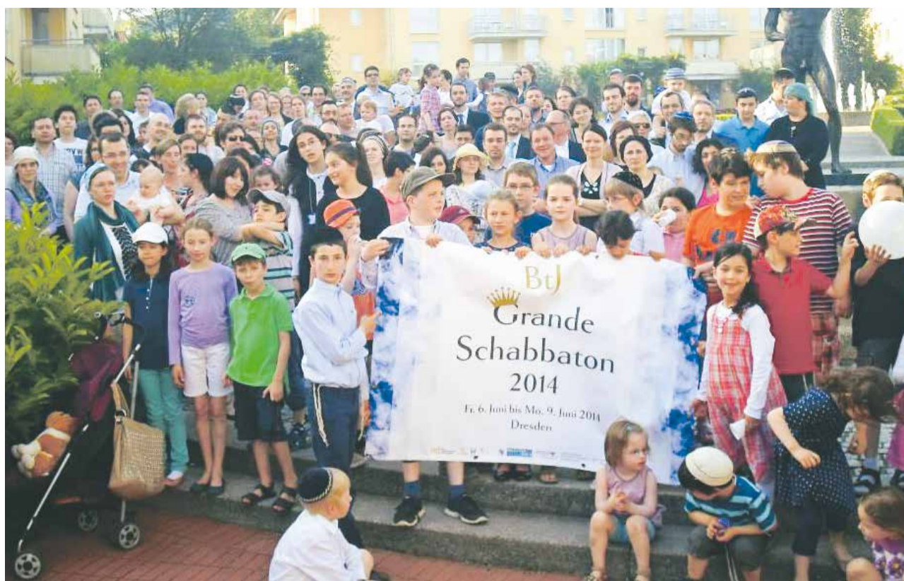
Flagge zeigen: Teilnehmer des Grande Schabbaton

Beziehungs- und Erziehungsfragen spielten auch in anderen Workshops