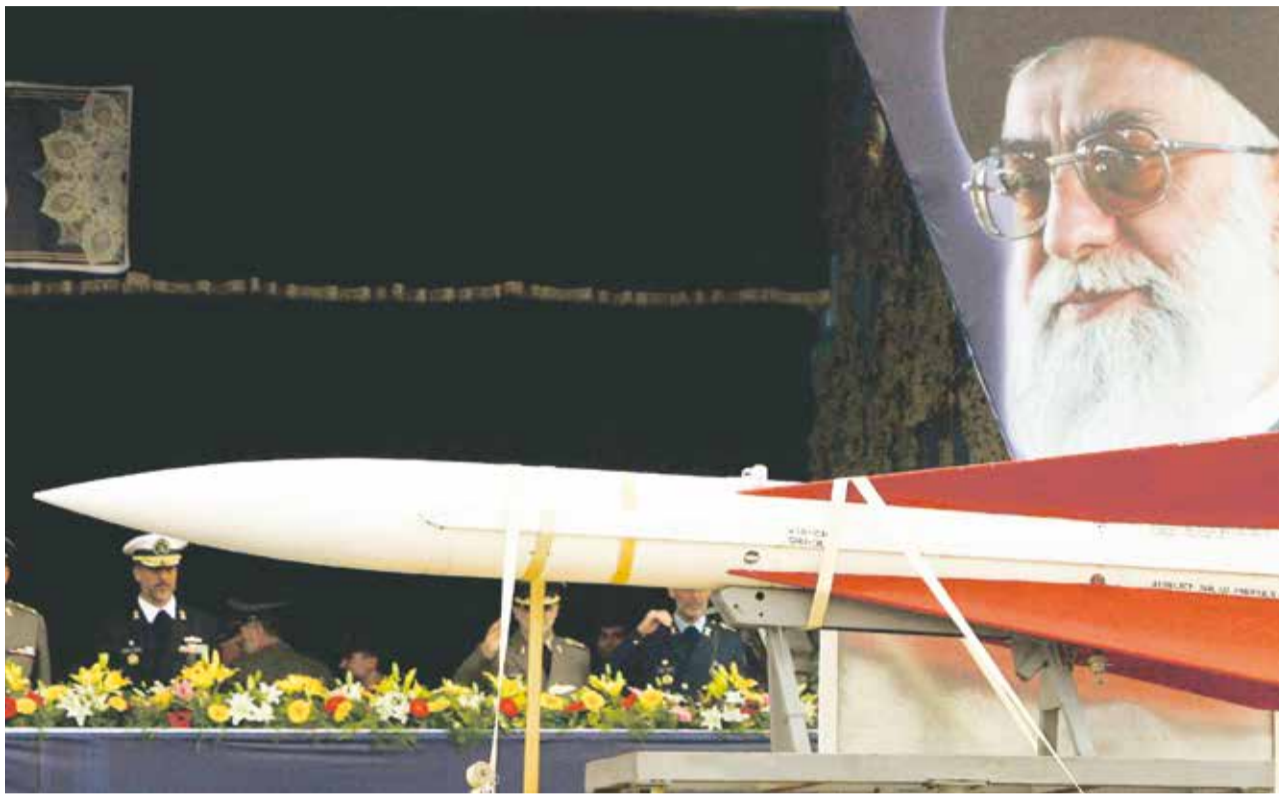
Bald mit Atomsprengköpfen? Militärparade in Teheran

Israelische Experten warnen vor möglichen Folgen des Interimsabkommens mit dem Iran