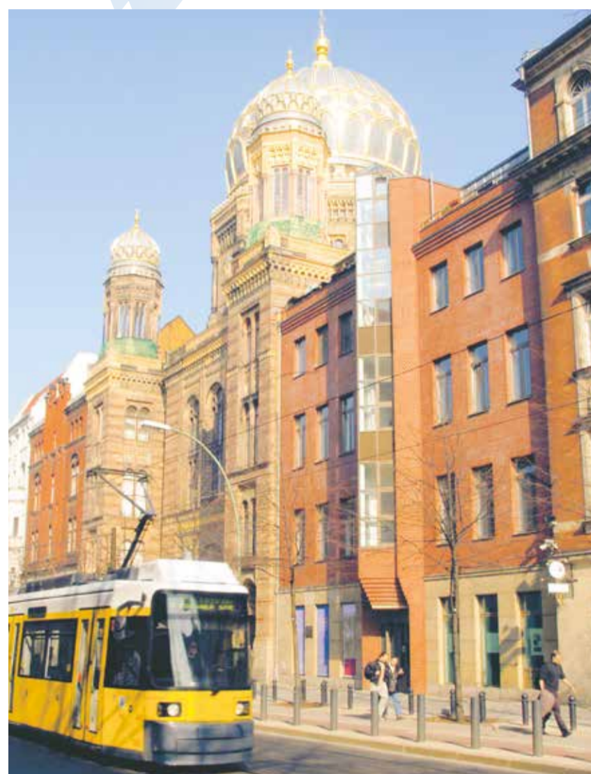
Teil des Alltags: Synagoge Oranienburger Straße im Berliner Straßenbild

Ich will dennoch nicht so tun, als wären nun paradiesische Zustände eingeleitet. Wie wir alle wissen, stoßen Juden keineswegs nur auf zustimmendes Interesse. Antisemitische Stimmungen sind nicht nur am linken und rechten Rand, sondern auch in der Mitte der Gesellschaft zu finden. Umfragen belegen dies auf erschreckende Weise. Antisemitismus ist zwar gesellschaftlich verpönt und antisemitische Positionen sind keineswegs politisch tonangebend, doch spürt man den sogenann-