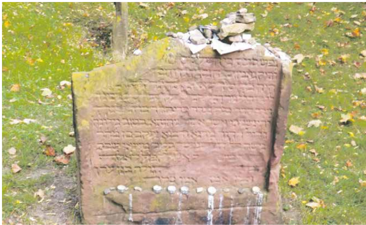
Unvergessen: das Grab des Maharil in Worms