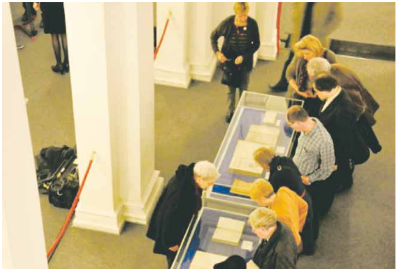
Kostprobe: einige der 20.000 Bücher der Jüdischen Bibliothek in Hamburg

Dennoch kamen die zu diesem Zeitpunkt in Berlin lagernden Bücher 1943 nicht nach Hamburg, sondern wurden in Lagerräumlichkeiten nach Dresden transportiert. Dort lagerten sie in Hallen und Stollen und entgingen glücklicherweise Feuer, Bomben und Plünderungen. Nach dem Zweiten Weltkrieg übereignete die Staatsbibliothek den Bücherbestand an die Jüdische Gemeinde zurück, vorerst aber nur auf