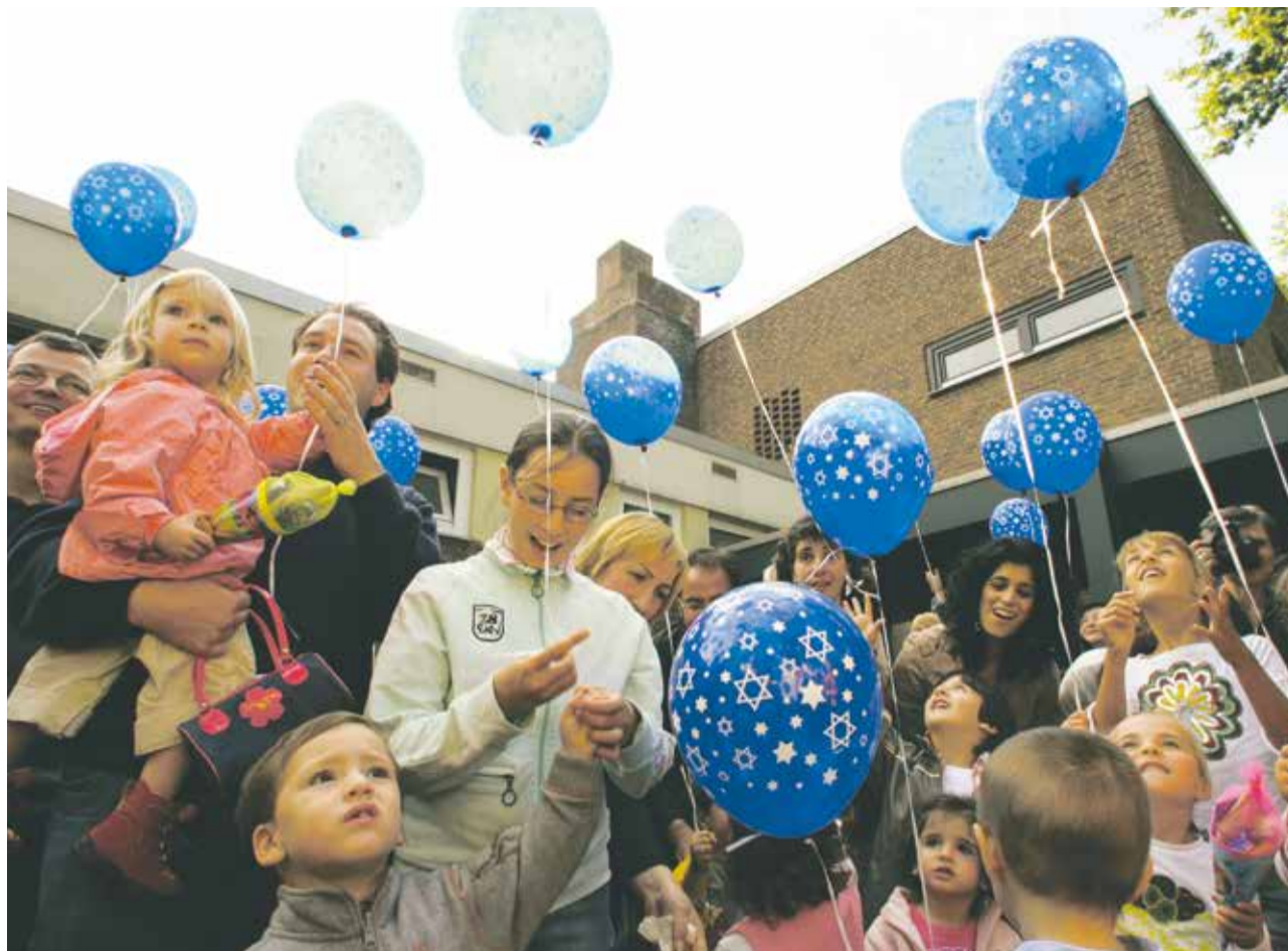
Im Aufwind: Jüdisches Erziehungswesen ist eine Grundlage für unsere Zukunft (im Bild: der Kindergarten „Tamar“ der Liberalen Jüdischen Gemeinde Hannover)

Parallel dazu erfolgte eine zunehmende Öffnung der jüdischen Gemeinschaft nach außen hin und zwar im Sinne der ausgestreckten Hand. Wir bringen uns mit unserer jüdischen Identität in die Gesellschaft ein, deren Teil wir sind. Wir zeigen der nichtjüdischen Umwelt, wie viel positive Kraft im Judentum steckt, wie universal unsere Werte sind und