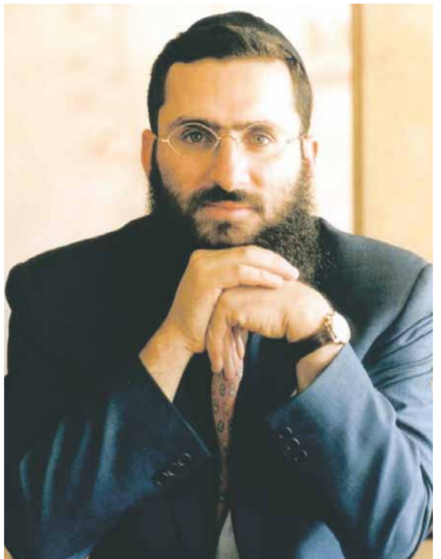
Analyse: Rabbiner Shmuley Boteach will das gängige Jesus-Bild zurechtrücken

In die von Christen umgeschriebene Geschichte, so Boteach, wurden starke antisemitische Elemente aufgenommen und Jesus' Bindung an sein Volk gelehrt.