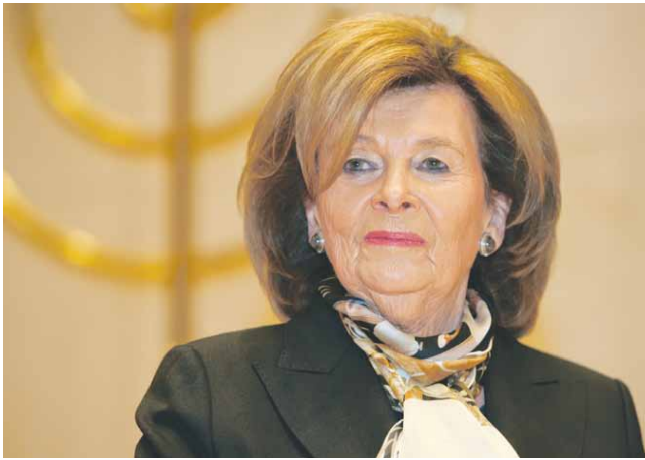
Unermülich: Dr. h.c. Charlotte Knobloch feierte ihren 80. Geburtstag