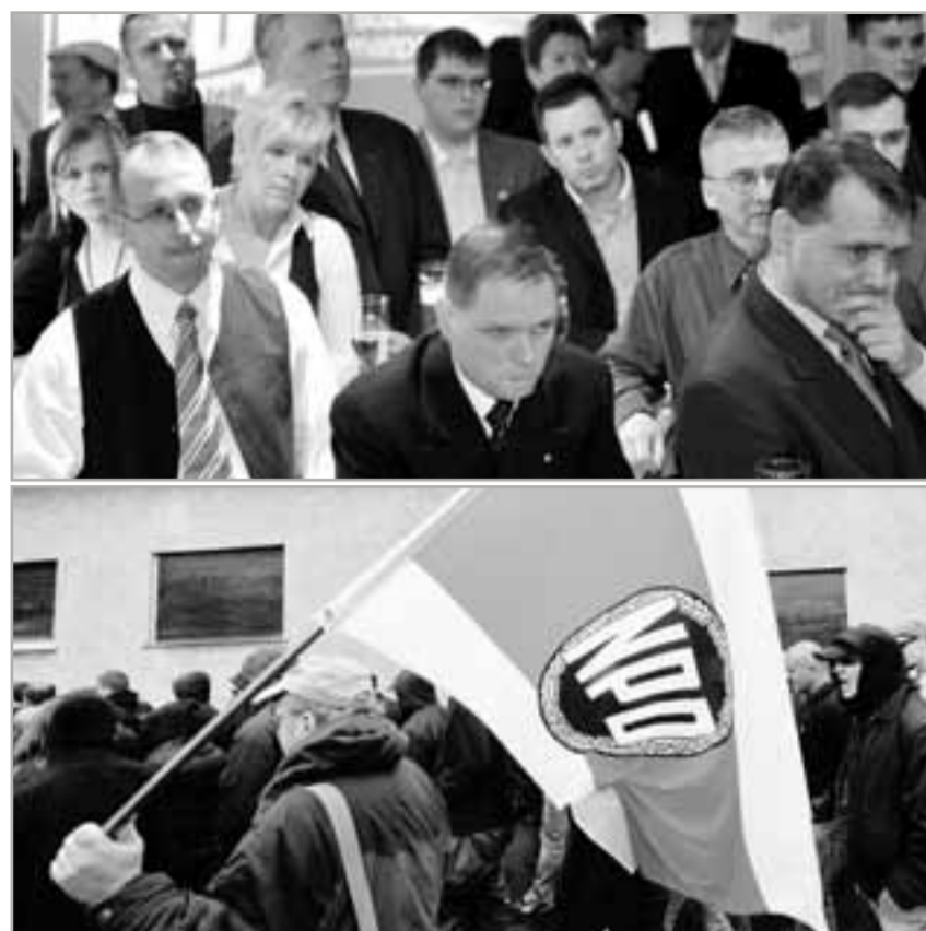
Ob Schlips oder Parka: Die Gefahr von rechts bleibt groß

gesetzten Weg und versuchen, bürgerlich seriös zu erscheinen. Für die NPD steht im Vordergrund, dass sie gerade in diesem Jahr mit seinen vielen Wahlen bürgerlich, etabliert und in der äußeren Form auch modern erscheint. Exemplarisch für diese Bestrebungen war der Antritt der NPD bei der Landtagswahl in Sachsen-Anhalt. Hier machte sich die Partei große Hoffnungen, in den Landtag zu kommen – es wäre der dritte in Ostdeutschland gewesen. Zum Schluss scheiterte sie mit 4,6 Prozent der Stimmen an der Sperrklausel, doch war dieses Ergebnis weitaus besser als die 3,0 Prozent der Wählerstimmen, die die damals aufretende DVU im Jahre 2006 erringen konnte. Ein Grund für den relativen Erfolg der NPD war offenbar ihr Versuch, auf die in Teilen der Bevölkerung herrschende, mehr oder minder diffuse Unzufriedenheit eine einfache, scheinbar passende Antwort zu geben. Die Taktik sieht wie folgt aus: Freundlich erscheinende Kandidaten, weit entfernt vom Habitus der Skinheads oder Autonomen Nationalisten, reden „Klartext“ über Arbeitslosigkeit, Abwanderung oder mangelnde Perspektiven für Jugendliche. Auf Bezüge zum Nationalsozialismus wird weitgehend verzichtet. Zudem präsentierte die NPD auf den Spitzenplätzen der Landesliste einen Generationenwechsel. Auf Platz eins Parteichef Matthias Heyder, ein gelernter Bankkaufmann und derzeit Jurastudent, dann drei adrett gekleidete junge Männer, die Funktionäre der NPD-Jugendorganisation „Junge Nationaldemokraten“ waren oder