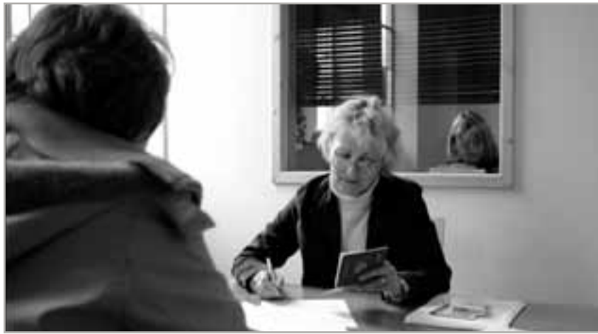
Leistungspalette: Sozialberatung in der Jüdischen Gemeinde Bad Kreuznach

Кроме того, ситуация не остаётся неизменной. Вначале практически все общины должны были проводить все свои мероприятия на двух языках: рус-