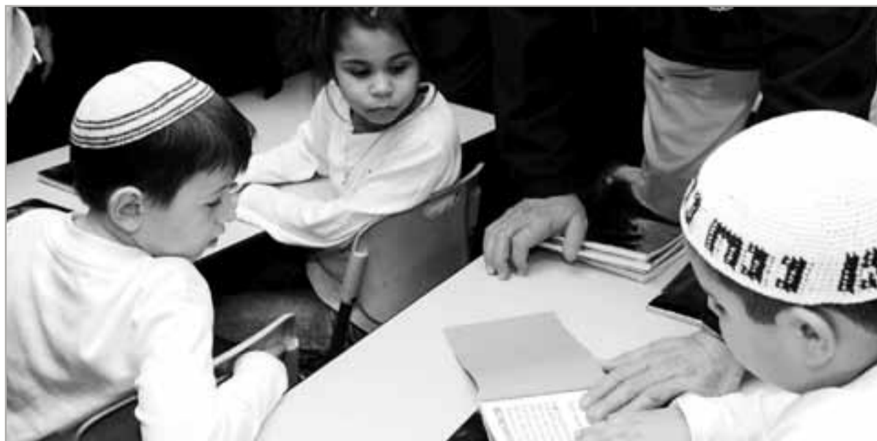
Weder Adolf noch Srubawel: Gesetzentwurf soll bestimmte Kindernamen verbieten

Ein Knessetabgeordneter will Kinder vor lächerlichen Vornamen schützen