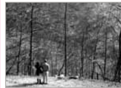
Verwüstung: Abgebrannte Waldhänge im Karmel-Gebirge