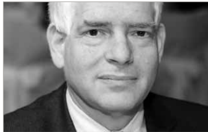
Im Einsatz für Gemeinden: Dr. Josef Schuster

Auf der positiven Seite ist das engere soziale Netz zu nennen, das die Mitglieder kleinerer Gemeinden aufbauen. Man kennt einander, so dass der Zusammenhalt der Gemeinde stärker ist. Diese Grundregel gilt natürlich nicht nur für jüdische Organisationen, doch hat sie sich im jüdischen Leben gut bewährt, nicht zuletzt bei der Integration der Zuwanderer aus der ehemaligen Sowjetunion.