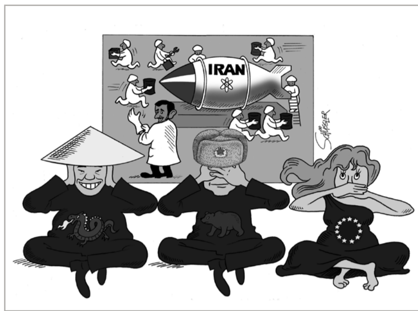
Bloß nicht stören: Iran kommt der Atombombe immer näher. Zeichnung: Alfred Schüssler

Damit ist im jüdischen Kollektiv das ethnische Element sekundär, gemeinsame Werte dagegen das Primäre. Die Tora hat sich länger als jede moderne Verfassung bewährt. Und wenn der Verfassungspatriotismus heute vielen als das beste künftige Fundament eines multiethnischen Europa gilt, so lehrt die jüdische Erfahrung: Verfassungspatriotismus ist möglich, allerdings nur dann, wenn die Ideale und die Gesetze, also der Geist wie der Buchstabe der Verfassung, von den Bürgern nicht nur als eine äußere Schale hingenommen, sondern als der innere Kern ihrer Gesellschaftsordnung akzeptiert werden. Das ist eine Erkenntnis, die Schawuot nicht nur für Juden relevant macht.