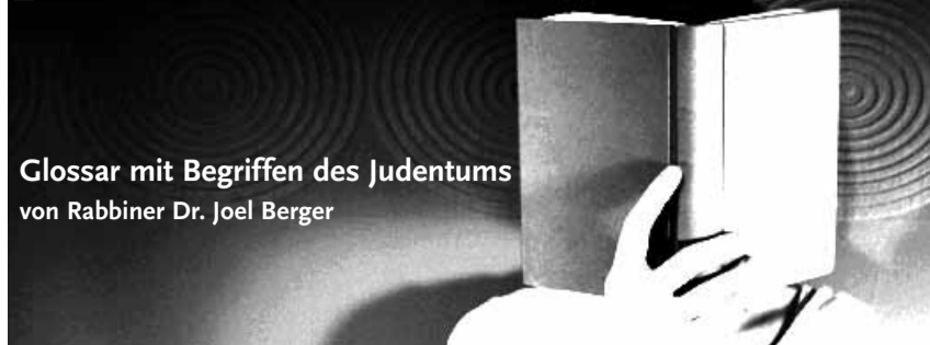
Glossar mit Begriffen des Judentums von Rabbiner Dr. Joel Berger

BET DIN (Hebräisch) Rabbinischer Gerichtshof, der sich auf Grund unserer Gesetzeskodexe (Talmud, Schulchan Aruch) mit innerjüdischen Angelegenheiten der Gemeindemitglieder wie Statusfragen, Scheidungen oder auch Konversionen befasst. Geführt wird ein Bet Din meistens von drei Rabbinern, die auch die Befähigung zum Dajan (rabbinisches Richteramt) besitzen. Von den Parteien wird vor Beginn der Verhandlungen eine Unterwerfungserklärung verlangt, da sonst die Urteile nicht vollzogen werden können. Der Vorsitzende des Bet Din wird „Aw Bet Din“ genannt.