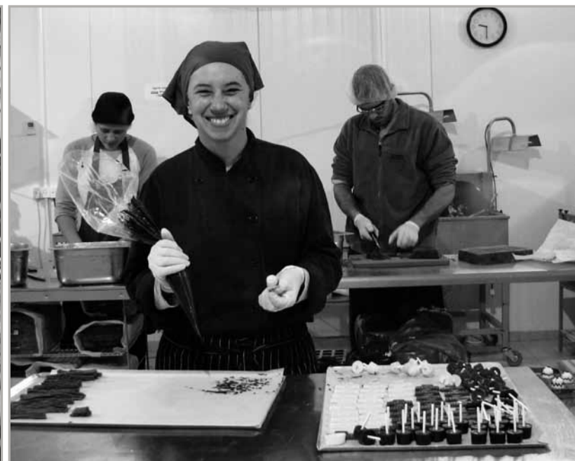
Damals und heute: Kibbutz-Farm in Pionierzeiten, Schokoladenfabrik im Kibbutz Ein Siwan.

von eigens dafür ausgebildeten Experten wahrgenommen werden.