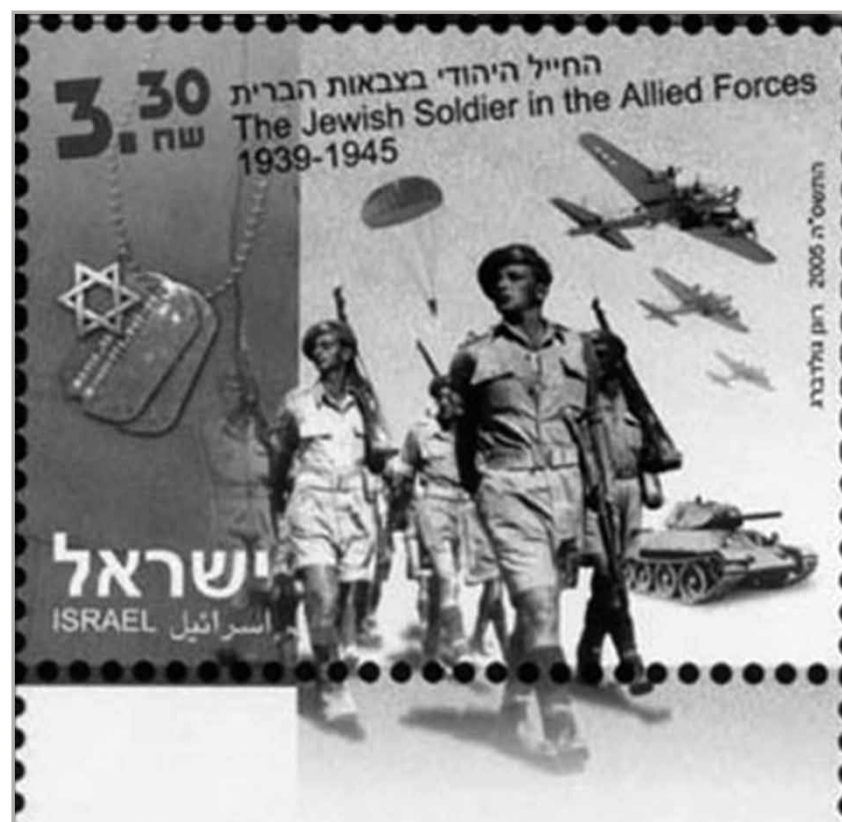
Die Befreier: Israelische Briefmarke zu Ehren jüdischer Weltkriegskämpfer

Mit der Eintragung in die Datensammlung soll jedem einzelnen Kämpfer persönliche Ehrung zuteil werden, doch hat das Projekt auch eine übergeordnete historische Bedeutung. Je ausführlicher die Information, umso deutlicher wird auch der jüdische Beitrag zur Befreiung Europas gemacht. Wir sollten uns