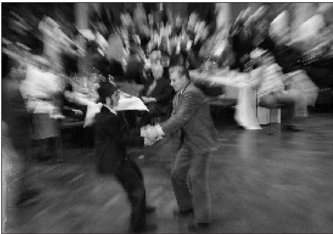
Ein Fest für Groß und Klein: In den Gemeinden finden zu Purim fröhliche Familienfeiern statt - wie hier z.B. im Berliner Gemeindehaus - bei denen mit Hamantaschen und in bunten Kostümen gefeiert wird.

Die meisten Feste dienen dazu, den Alltag und seine Sorgen von uns abzustreifen. Dies trifft ganz besonders auf Purim, das wir in diesem Jahr am 10. März (14. Adar) feiern, zu. Das Fest erinnert uns an die einstige Rettung unserer Vorfahren im alten Persien vor über 2000 Jahren.