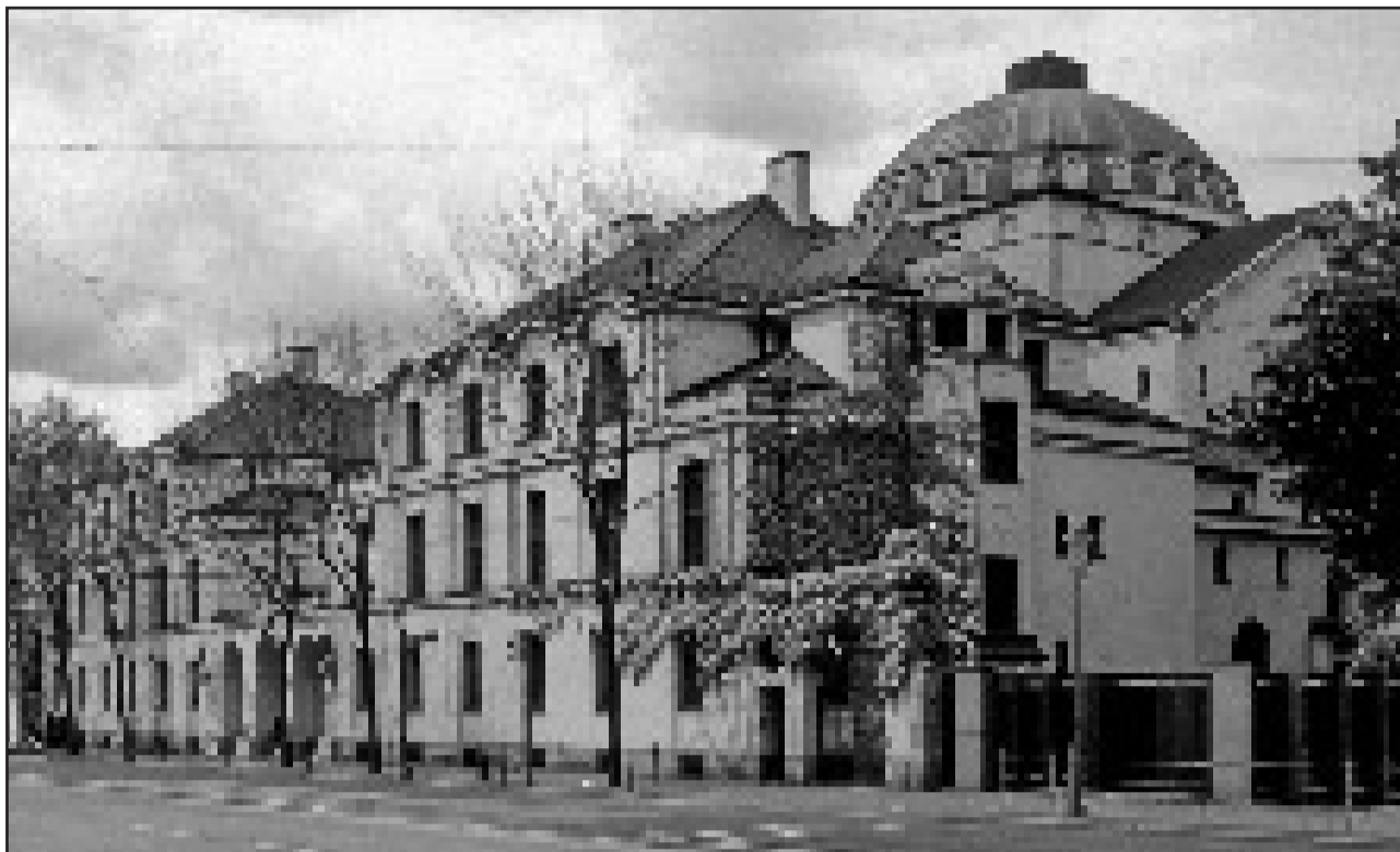
War einst das Zentrum jüdischen Lebens in Augsburg: die große Synagoge mit dazugehörigem Gemeindezentrum. Jetzt soll sie aufwändig restauriert werden.

In Augsburg entstehen zwei neue Betsäle - Gemeinde im Portrait