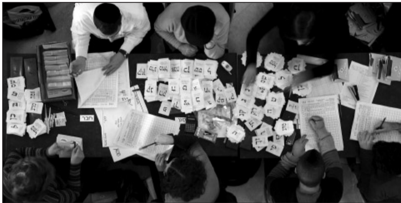
Nach Auszählung der Stimmzettel am 10. Februar wurde schnell klar, dass die politische Zukunft noch völlig offen ist.

Freilich: Trotz des vorhersehbaren Wahlergebnisses bleibt israelische Politik spannend. Die Gretchenfrage, die Benjamin Netanjahu beantworten muss lautet: Entscheidet er sich für eine rein rechte Regierung oder geht er eine Große Koalition mit Kadima ein. Bisher allerdings haben die Gespräche mit Kadima und der Arbeiterpartei