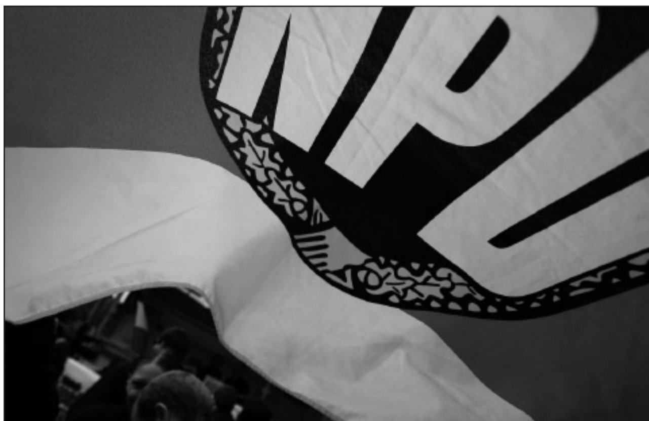
Rechtsextreme Gefahr ist längst noch nicht gebannt: Immer wieder finden in Deutschland NPD-Veranstaltung statt, wie hier in Stolberg bei Aachen.