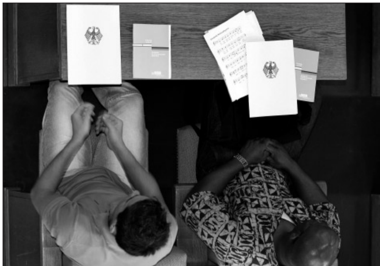
"Seltsames Geschichtsverständnis": Wer künftig eingebürgert werden möchte, muss aus dem 320 Fragen umfassenden Katalog von 33 ausgewählten Fragen 17 richtig beantworten - allerdings kommt der Begriff "Holocaust" darin nicht einmal vor.

Das Innenministerium hatte den Einbürgerungstest Anfang Juli vorgelegt. Ausländer, die Deutsche werden wollen, müssen ihn ab 1. September 2008 bestehen. Mit dem bundesweit einheitlichen Test sollen Kenntnisse der Rechts- und Gesellschaftsordnung nachgewiesen werden. Aus insgesamt 310 Fragen werden jeweils 33 ausgewählt. Bestanden hat, wer 17 richtig beantwortet. Der Test kann beliebig oft wiederholt werden.