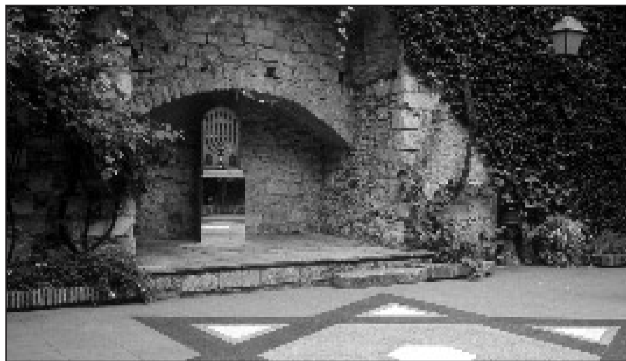
Взгляд в двор еврейского музея в Гироне: прежде всего на южной испанской Средиземноморской побережье, между Каталонией и Коста-дель-Сол, можно найти множество еврейских следов в старых мавританских городах и деревнях, как и здесь в Гироне.

Затем идем в Мадрид, где в районе Гран-Виа находится синагога «Шааре тиква», построенная в 1847 году. В то время и была построена синагога «Шааре тиква». Сегодня здесь можно получить подробную информацию о современной еврейской жизни в Мадриде.