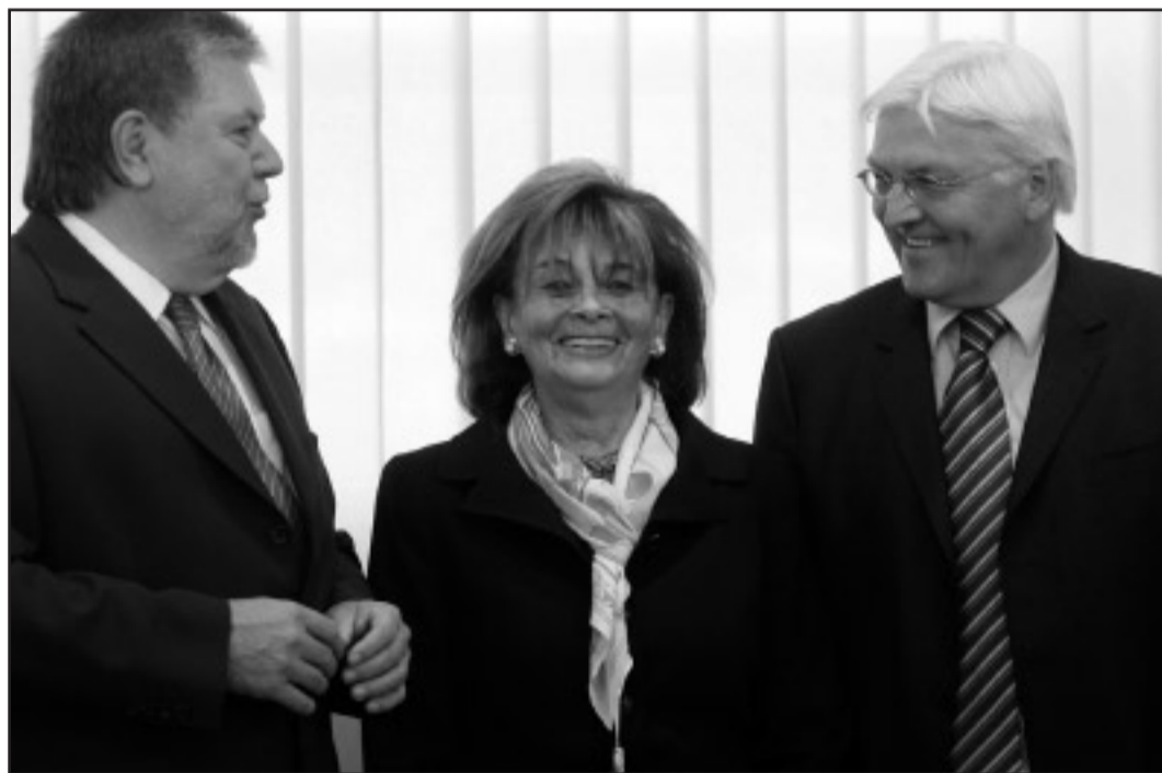
Treffen auf Augenhöhe: Die Präsidien von SPD und des Zentralrats der Juden führten unter Leitung von Zentralrats-Präsidentin Charlotte Knobloch, dem SPD Vorsitzenden Kurt Beck (l.) und dem stellvertretenden Vorsitzenden, Bundesaußenminister Frank-Walter Steinmeier, ein sehr konstruktives Gespräch.