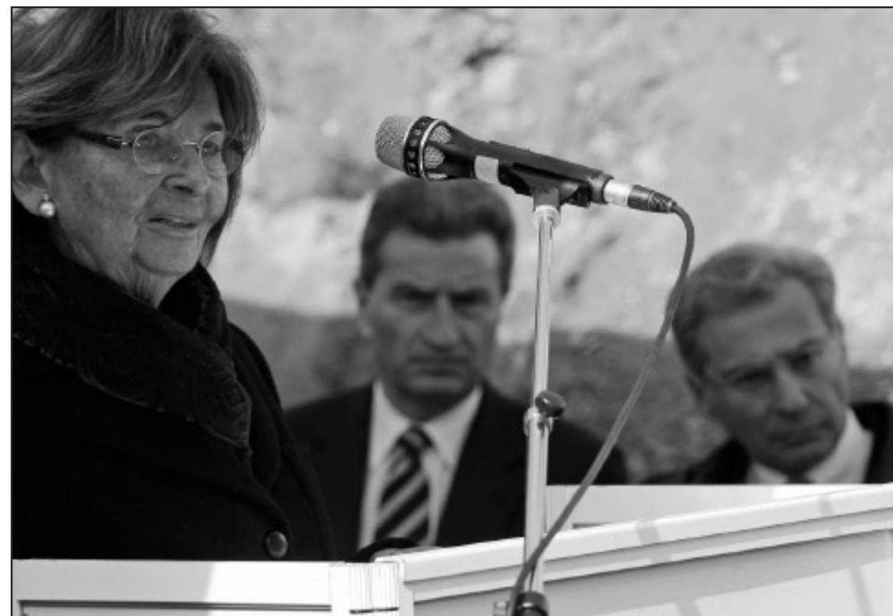
Bei der Grundsteinlegung für den Neubau der Hochschule für Jüdische Studien: Zentralratspräsidentin Charlotte Knobloch, Ministerpräsident Günther Oettinger (Mitte) und Zentralratsvizepräsident Salomon Korn.

Als „Meilenstein für die jüdische und die akademische Gemeinschaft in Deutschland“ wurde Anfang April die Grundsteinlegung eines Neubaus in der Heidelberger Altstadt gefeiert. In der Landfriedstraße baut die Hochschule für Jüdische Studien (HfJS) einen Neubau, der „für die geistige und architektonische Weiterentwicklung der Hochschule als europäisches Zentrum für Jüdische Studien steht“. Der Zentralrat der Juden in Deutschland, der Träger der 1979 gegründeten Hochschule ist, feiert die Neubaupläne als „historischen Schritt“. „Der Neubau verbindet die Tradition jüdischen Lernens und Lehrens mit der Zukunft - auch baulich“, sagte die Präsidentin des Zentralrats, Charlotte Knobloch, bei der Grundsteinlegung. Damit werde Geschichte geschrieben. „Die Hochschule ist nicht nur ein Kompetenzzentrum, sondern auch eine Stätte der Wiederannäherung zwischen jüdischen und nicht-jü-