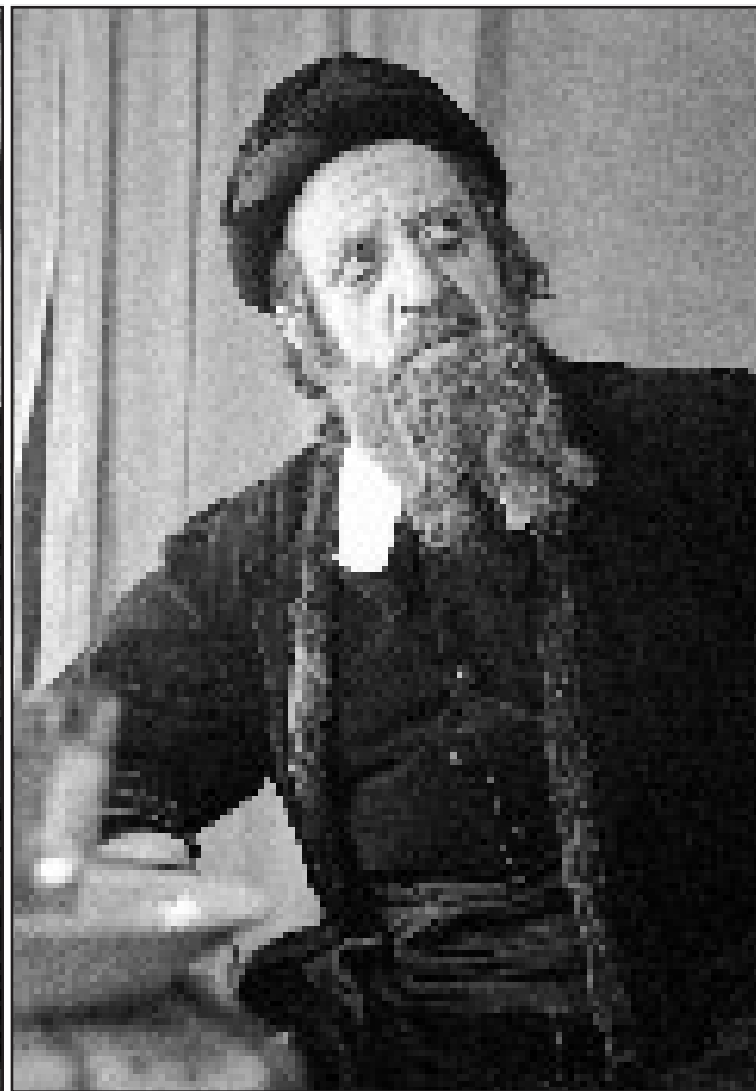
Was braucht man, um sich in einen Juden zu verwandeln? Ein Bart, eine Kopfbedeckung, eine Samtjacke. Maurice Schwartz vom New Yorker Yiddish Art Theater demonstriert die Verwandlung in diesen Fotos von 1947.

rassistische Ideologien liefern. Die Exponate erzählen von festgefahrener Meinungen und Vorstellungen von Minderheiten. Kurator Thorsten Beck hält Klischees nicht grundsätzlich für