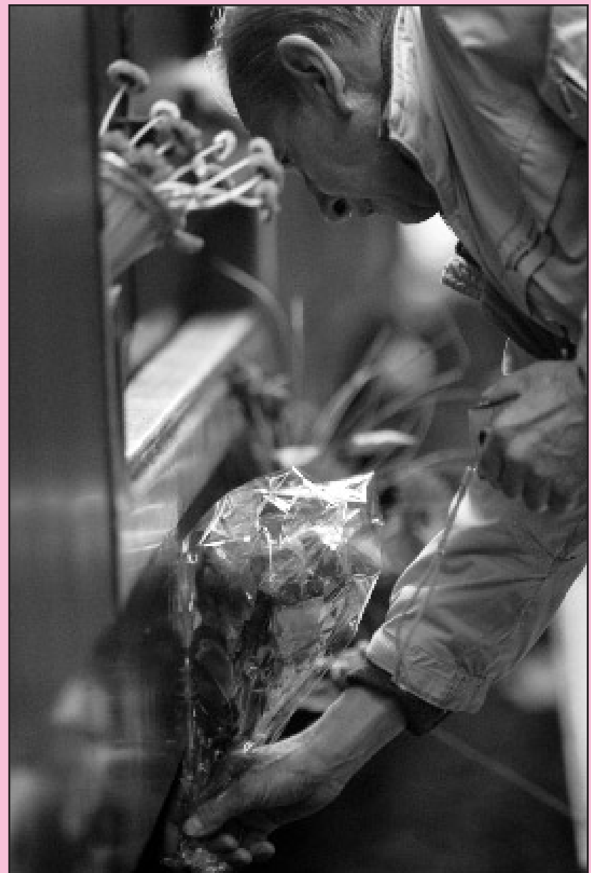
Blumen für die Opfer: ein Besucher der Ausstellung „Zug der Erinnerung“

Der „Der Zug der Erinnerung“, der eigentlich an deportierte Kinder erinnern soll und der die Geschichte der europäischen Deportationen anhand einzelner Biografien erzählt, ist während seiner knapp zehntägigen Station Mitte April in Berlin zum Politikum geworden. Statt sich mit den ergreifenden Schicksalen der Deportation zu beschäftigen und den deportierten Kindern und Jugendlichen wieder ein Gesicht zu geben, wurde über Trassengebühren und Haltemöglichkeiten und -kosten gestritten. Es war ein lächerliches und absurdes Hickhack, das sich die Deutsche Bahn AG mit den Initiatoren und Trägern des Projektes lieferte. Die Reichsbahn, einer der Vorläufer der Deutschen Bahn, war an den Deportationen während des NS-Re-