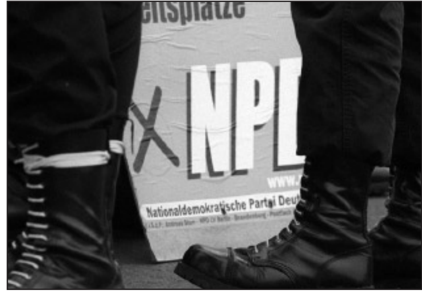
Wie soll die Bundesrepublik künftig mit der NPD und Rechtsextremen umgehen? Die Innenminister sprachen sich auf ihrer jüngsten Tagung gegen ein erneutes Verbotverfahren aus.

Die Bekämpfung des Rechtsextremismus ist eine Aufgabe aller demokratischen Kräfte unserer Gesellschaft gleichermaßen. Lassen wir es nicht zu, dass sich demokratische Parteien so auseinanderdividieren, dass die Rechtsextremen weiter an Boden gewinnen. Wer die Institutionalisierung des Kampfes gegen den Neonazismus im linken