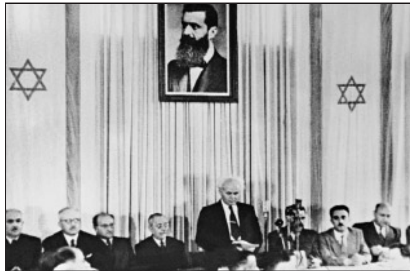
Vor 60 Jahren: Es war der 14. Mai 1948 als David, Ben-Gurion, der erste israelische Premierminister, in Tel Aviv die Gründung des Staates Israel, verkündete.

Nicht minder wichtig war der Aufbau der Staatsinstitutionen. Wohl wahr: In der Diaspora hatten Juden wichtige Erfahrungen in Selbstverwaltung und kultureller Autonomie gesammelt. Das kam ihnen nach 1948 zugute. Der große Unterschied: Diesmal galt es, einen ganzen Staat aus dem Boden zu stampfen und die alleinige Verantwortung für dessen Geschicke zu übernehmen. Dabei wurde Israels Weg zu einer funktionierenden Demokratie durch die Heterogenität seiner Bevölkerung zusätzlich erschwert. Es galt, Juden und Araber, Säkulare und Religiöse, Aschkenasen und Sefarden, Alteingesessene und Neueinwanderer aus allen Herren Ländern unter einen Hut zu bringen. Und mit der Zeit wurde die Gesellschaft immer multikultureller. Dennoch funktioniert das Regierungssystem - nicht ohne Probleme, aber auch nicht schlechter als in vielen anderen Demokratien. Bei aller Kritik, die an Israels Unzulänglichkeiten geübt wird: Die Aufbauleistung verdient Respekt.