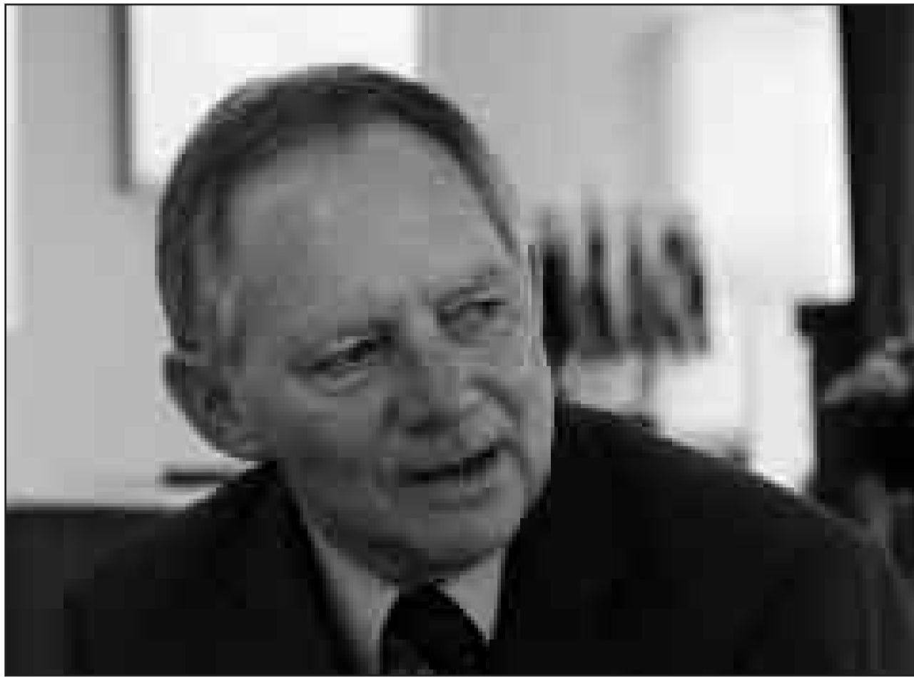
Кlare Worte: „Бунд и Länder tun alles, um jüdische Einrichtungen zu schützen“, sagt Bundesinnenminister Wolfgang Schäuble (CDU) zu der aktuellen Sicherheitslage.

Bundesinnenminister Wolfgang Schäuble (CDU) über die Gefahr von islamistischem Terror, rechtsextremistischen Straftaten, jüdisches Leben und den Staatsvertrag