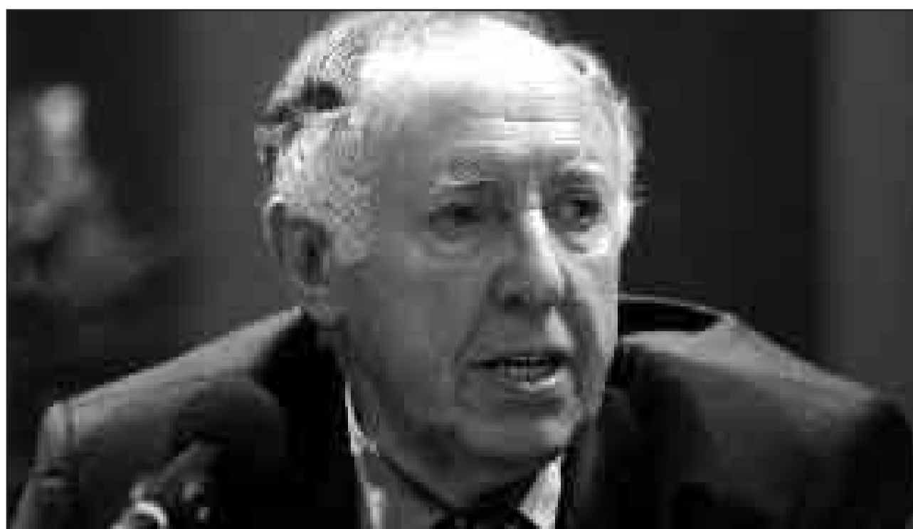
Moralische Instanz - geachtet und geschätzt: Der 1999 verstorbene ehemalige Präsident des Zentralrats der Juden, Ignatz Bubis, hatte zeitlebens ein uneingeschränktes Vertrauen in die Demokratie und in die jüdische Gemeinschaft in Deutschland.

„Ich bin deutscher Staatsbürger jüdischen Glaubens“ – dass dieses Zitat von Ignatz Bubis heute so selbstverständlich klingt, liegt daran, dass Bubis selbst maßgeblich dazu beigetragen hat, dass der Inhalt mit Leben erfüllt wurde. Bubis, der in diesem Jahr 80 Jahre alt geworden wäre, widmet das Jüdische Museum Frankfurt eine Ausstellung, in der sein Leben und Wirken reflektiert werden: Als einer der prominentesten jüdischen Vertreter in Deutschland – zunächst für die jüdische Gemeinde in Frankfurt, dann als Präsident des Zentralrats der Juden in Deutschland (1992 bis zu seinem Tod 1999) und schließlich seit 1998 als Präsident des Europäischen Jüdischen Kongresses – war Bubis als engagierte „moralische Instanz“ in Deutschland bekannt.