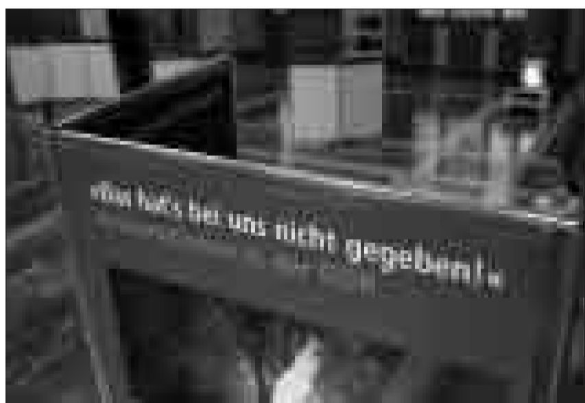
„Das hat es bei uns nicht gegeben“, diese Antwort bekamen die Jugendlichen, die für die gleichnamige Ausstellung über Antisemitismus in der DDR recherchierten, immer wieder.

Передвижная выставка «Антисемитизм в ГДР». Школьники, проводившие расследование, пришли к ужасающим результатам