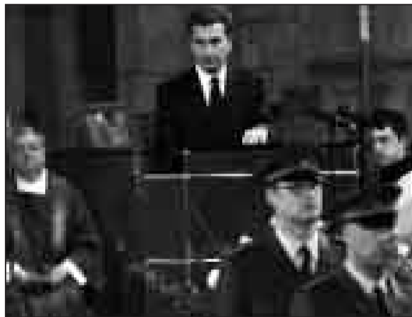
Bedauern: Der baden-württembergische Ministerpräsident Günther Oettinger - hier während der Trauerfeier für den verstorbenen, ehemaligen Ministerpräsidenten Hans Filbinger - hat inzwischen die „Missverständnisse“ über seine Trauerrede bedauert.

1979 gründete er das rechtskonservative Studienzentrum Weikersheim. Hier durfte NPD-Mitglied Horst Mahler 1997 eine Rede halten. Im Zusammen-