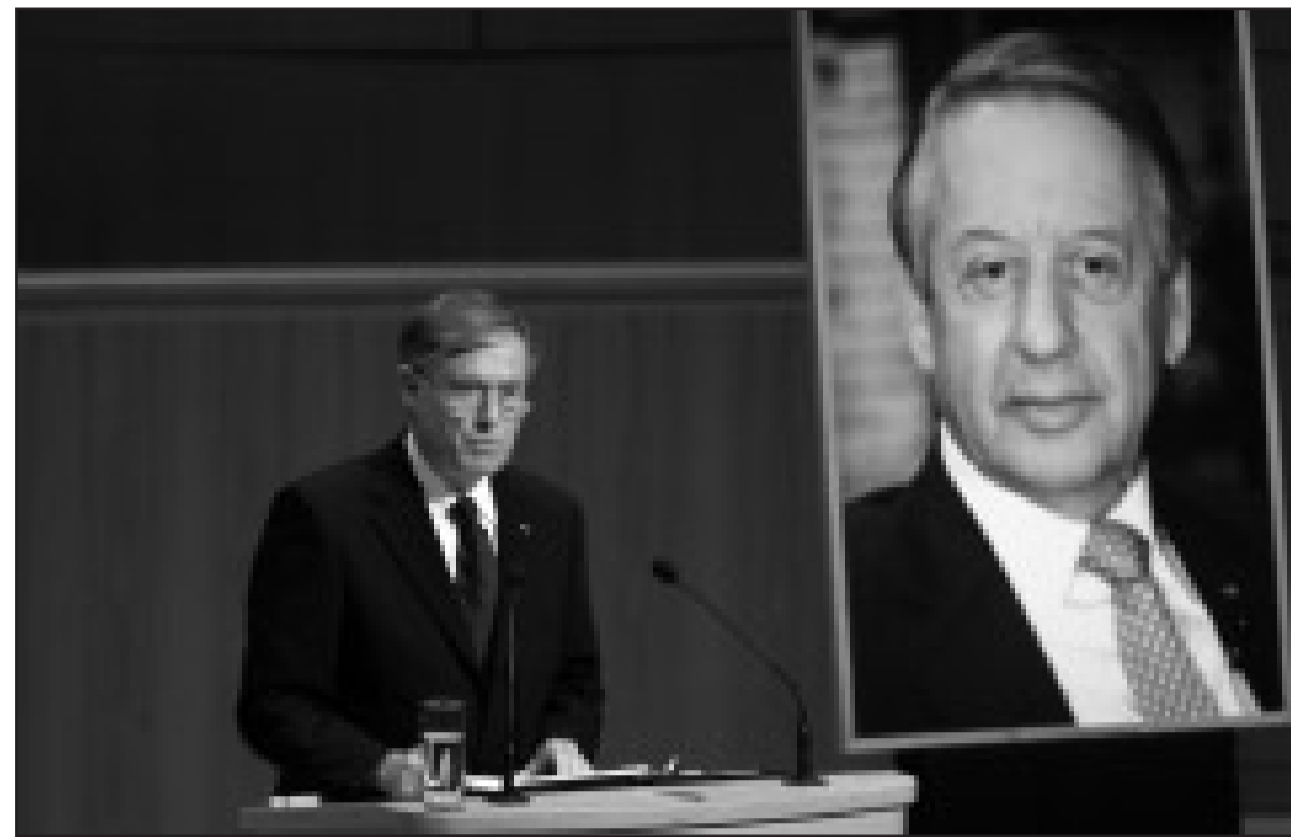
Траурная церемония в Дюссельдорфе: Президент Хорст Кёлер напоминает в трогательных словах о Пауле Шпигеле, который активно боролся против антисемитизма и враждебности к чужакам.