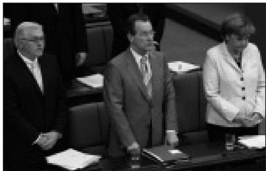
Schweigeminute im Deutschen Bundestag: Außenminister Frank-Walter Steinmeier, Bundesarbeitsminister Franz Müntefering und Kanzlerin Angela Merkel gedenken Paul Spiegel.