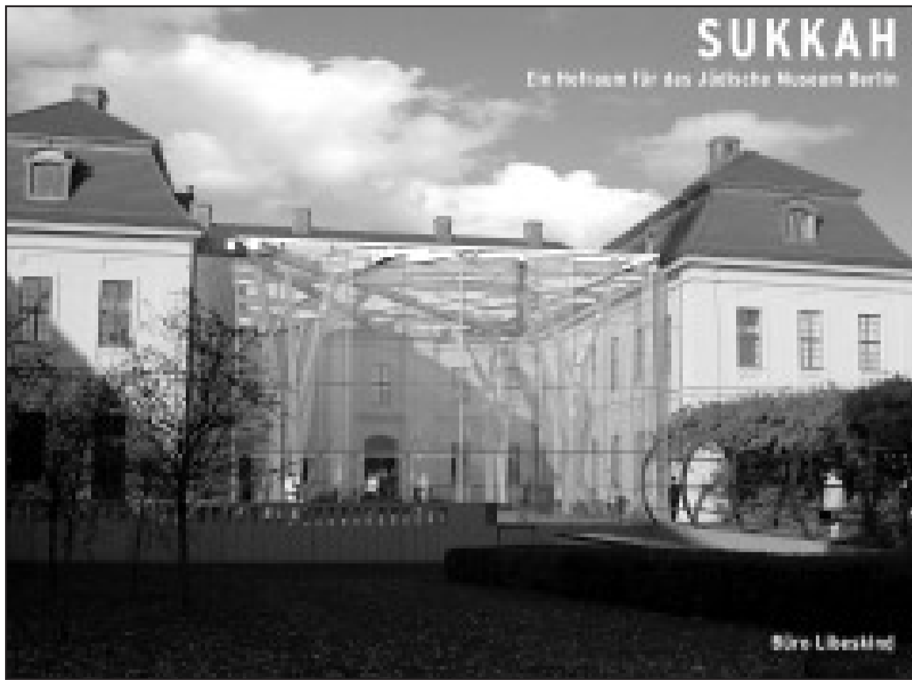
Eine Sukka für das Jüdische Museum in Berlin: Erstmals ist in der Sonderausstellung ein Model des Museumbaus von Daniel Libeskind zu sehen.

Der „Trend zur Ausdruckskraft“ begann mit Libeskind, dem es gelungen war, mit dem jüdischen Museum in Berlin ein expressives, sinnliches und gleichzeitig populäres Zeichen für die deutsch-jüdische Geschichte zu finden: Die vielfach gebrochenen Linien der verschütteten jüdischen Bezugsachsen in der Stadt kennzeichnen das Kreuzberger Museum. In seinem neuesten Buch, „Breaking Ground“, das Libeskind unlängst im Jüdischen Museum Berlin vorgestellt hat, ist eindrucksvoll nachzulesen, wie wegweisende und mutige Architektur Zeugnis einer wachsenden „jüdischen Identität durch innovative Formen“ sein kann. mey Jüdisches Museum Berlin, Lindenstraße 9-14, 4. März bis 29. Mai 2005. Die Ausstellung wird anschließend in Wien, München, London und Tel Aviv zu sehen sein. Zur Ausstellung gibt es einen Katalog (Englisch/Deutsch).