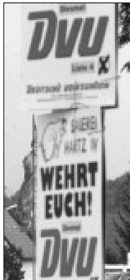
Initialen mit erschreckender Botschaft: REP, DVU oder NPD stehen für rechtes Gedankengut, dass 60 Jahre nach Kriegsende nach Deutschland zurückgekehrt ist.

Werner Bergmann: Ganz so dramatisch wie während der Dreifus-