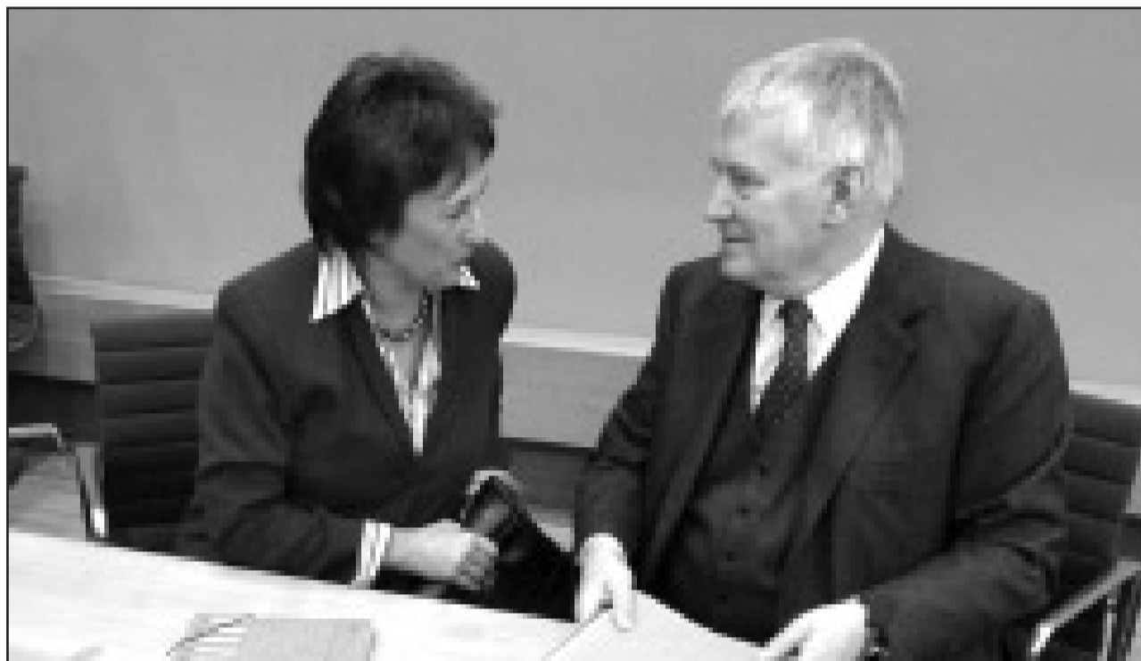
Bundesinnenminister Schily und Bundesjustizministerin Zypries fordern ein neues Versammlungsrecht

An der Beobachtungspraxis hat sich nichts geändert, so dass ein neuerliches Scheitern absehbar scheint. Gleichwohl hatten der Präsident des Bundesverfassungsgerichts, Hans-Jürgen Papier, und dessen Vize Winfried Hassemer der Politik indirekt neue Verbotsanträge nahe gelegt. Der frühere Präsident des Bundesverfassungsgerichts, Ernst Benda, gab hingegen einem neuen Verbotsantrag keine