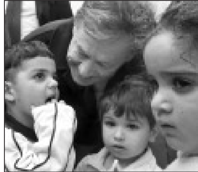
Stationen einer bedeutenden Reise: Während seiner viertägigen Reise durch Israel hetzt Bundespräsident Horst Köhler von Termin zu Termin - und fand dennoch immer wieder den richtigen Ton.