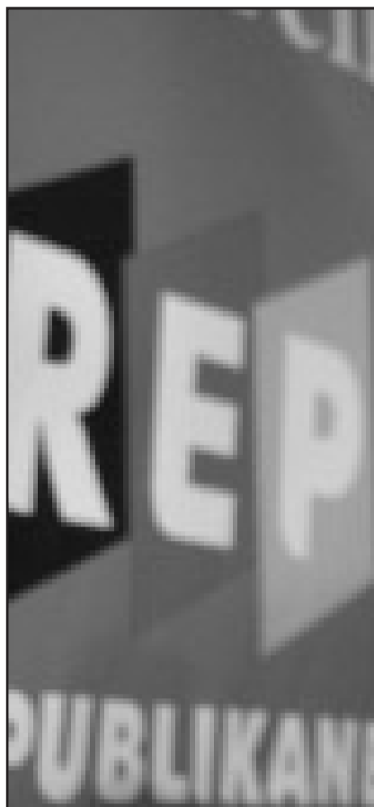
Initialen mit erschreckender Botschaft: REP, DVU oder NPD stehen für rechtes Gedankengut, dass 60 Jahre nach Kriegsende nach Deutschland zurückgekehrt ist.

Werner Bergmann: Nein, das glaube ich nicht. Der Umgang mit Antisemitismus war und ist in Deutschland darauf gerichtet, ihm möglichst keine öffentliche Plattform zu geben,