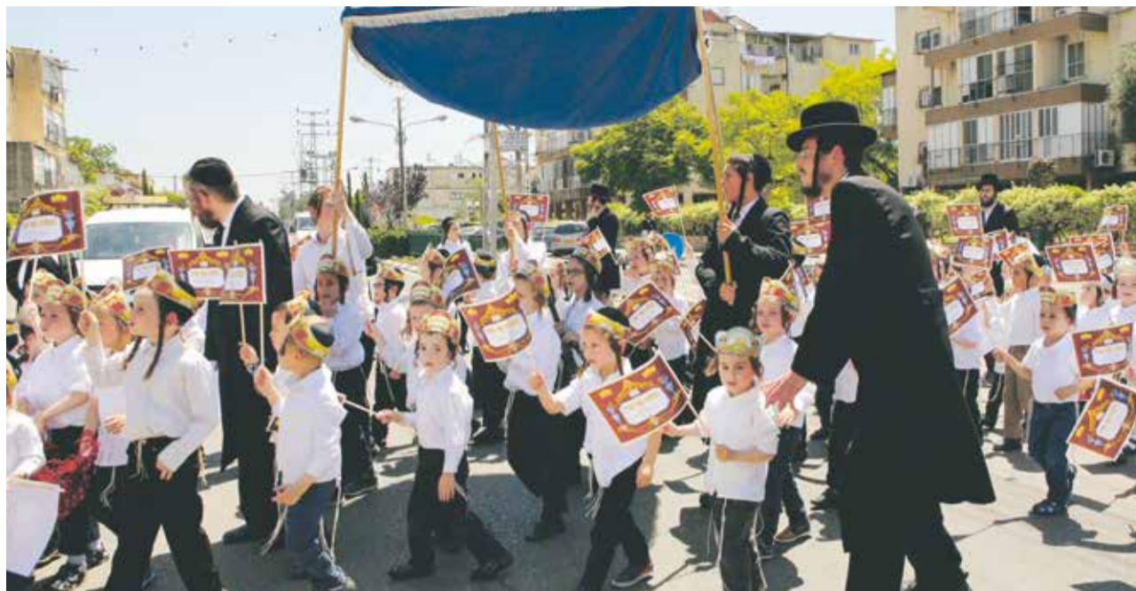
Кraft des Glaubens: ultraorthodoxe Kinder in Israel

Лaut israelischer Umfrage verhilft Religiosität vor allem Ultraorthodoxen zu einem besseren Lebensgefühl