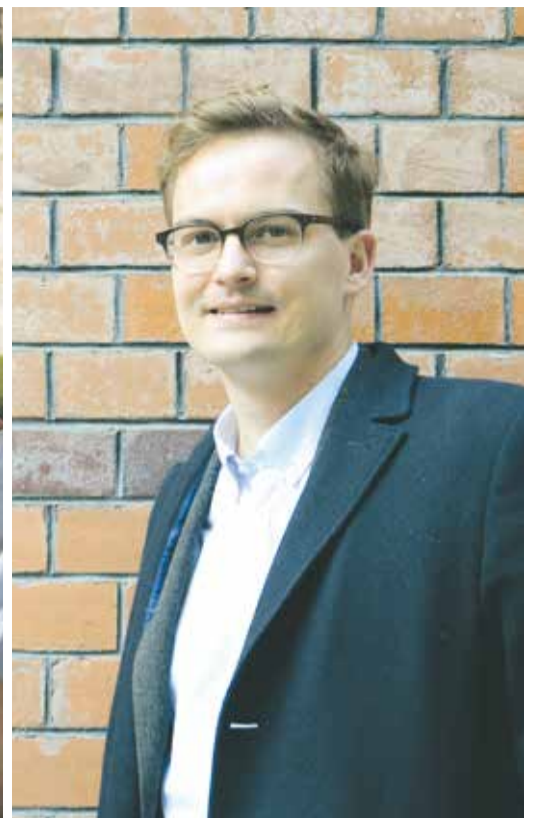
Wir leben: Holocaust-Überlebender mit Enkelin in Israel | Foto: Helena Schätzle / rechts: Lukas Welz | Foto: A. Lanzke

chen Mitarbeiter, der Vorstand arbeitet natürlich ehrenamtlich. Für Projekte wirbt AMCHA Deutschland zudem auch Drittmittel ein. So wurde etwa die Wanderausstellung vom Auswärtigen Amt mitfinanziert.