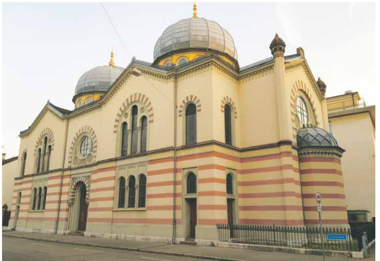
Schutzwürdiges Kulturgut: die Große Synagoge in Basel feierte 150-jähriges Jubiläum

Zugleich wollte man die Unabhängigkeit von der vorherrschenden christlichen Religion zum Ausdruck bringen. Das zeigte sich in den maurischen und byzantinischen Stilelementen, die die Synagoge auszeichnen. Hermann Gauss nahm sich dabei die nur wenige Jahre früher erbaute Stuttgarter Synagoge zum Vorbild. Tragisch war