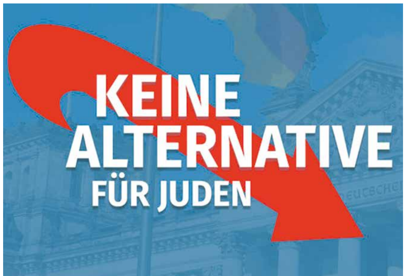
Ohne uns: Logo der Gemeinsamen Erklärung

Die AfD agitiert unumwunden gegen Muslime und andere Minderheiten in Deutschland. Dabei versucht die AfD, „die“ Muslime als Feinde der westli-