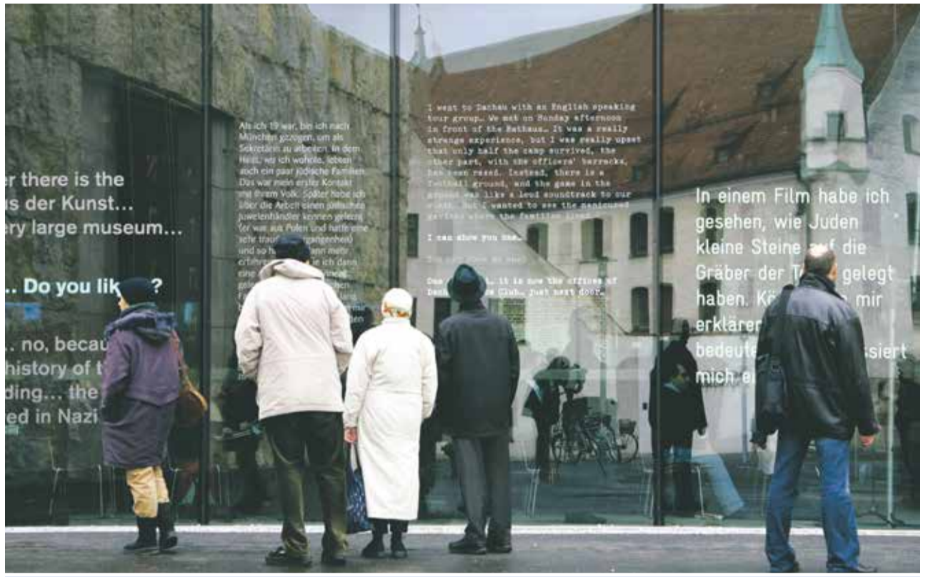
Interessiert: Passanten lesen Spruchbänder am Jüdischen Museum München

Mit Ausstellungen, die sich unterschiedlichsten Aspekten jüdischen Lebens widmen, hat Purin dem Museum nicht nur ein treues Stammespublikum verschafft, sondern darüber hinaus zahlreiche Besucher ins Haus gelockt, die auf die jeweils angesprochenen Spezialgebiete anspringen. „Das machen wir gern: Leute mit Themen locken, die sie interessieren, und sie dann mit der jüdischen Seite des Themas konfrontieren.“ Dafür war die Ausstel-