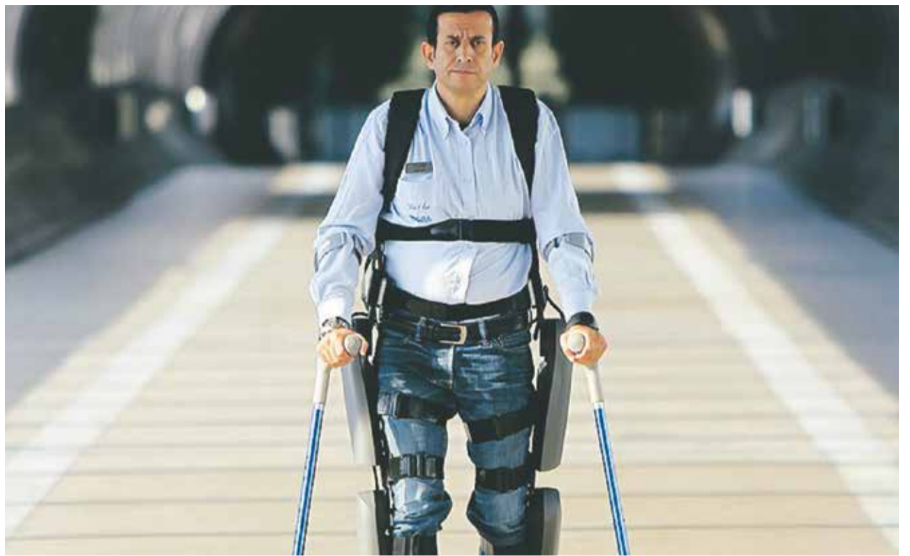
Technik für Menschen: ReWalk, das Exoskelett für Querschnittsgelähmte

Wie wichtig Hightech für die israelische Wirtschaft ist, zeigt ein Blick auf die Exportstatistik, wobei es nicht nur um Hightech-Erzeugnisse, sondern auch um Hightech-Dienste geht. Nach Angaben des israelischen Zentralamts für Statistik lagen die Exporte technologieintensiver Dienste – etwa EDV-Dienste, Softwarelizenzen sowie Forschung und Entwicklung – 2016 bei 22 Milliarden Dollar. Das war mehr, wengleich nur knapp, als die Ausfuhr technologieintensiver Industrie-