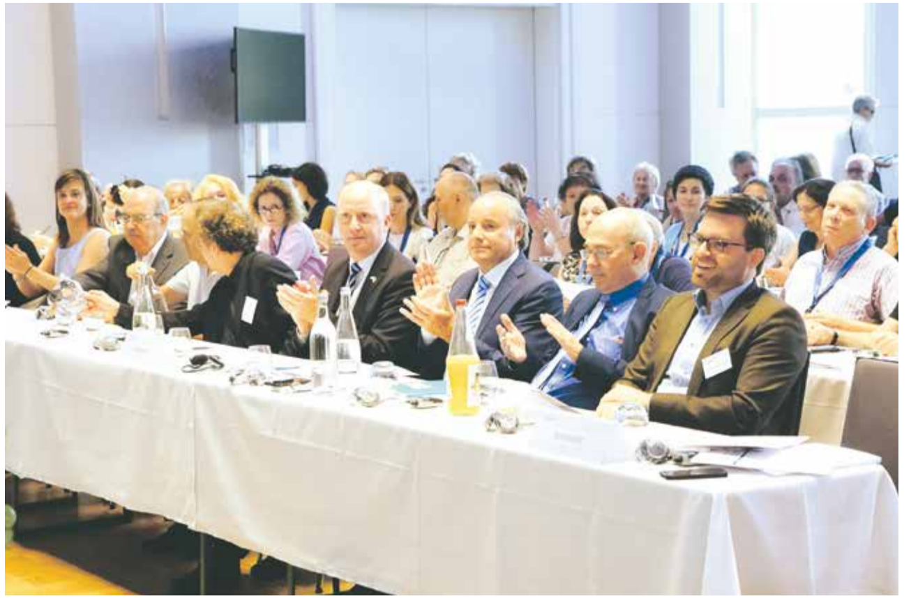
Blick in die Geschichte: Teilnehmer der Frankfurter Tagung

Ben-Gurion habe die Vision der Zionisten vom eigenen Staat um jeden Preis realisieren wollen und sei darauf bedacht gewesen, den richtigen Zeitpunkt nicht zu verpassen, so Rachman. Israel sollte ein modernes, von Europa und den USA inspiriertes jüdisches Gemeinwesen werden. Als Vertreter der jüdischen Gemeinschaft habe er den UN-Teilungsplan vom 29. November 1947 akzeptiert. Segev ist überzeugt, dass es Ben-Gurion ferngelegen habe, die Araber beherrschen zu wollen, nicht zuletzt aus ganz pragmatischen