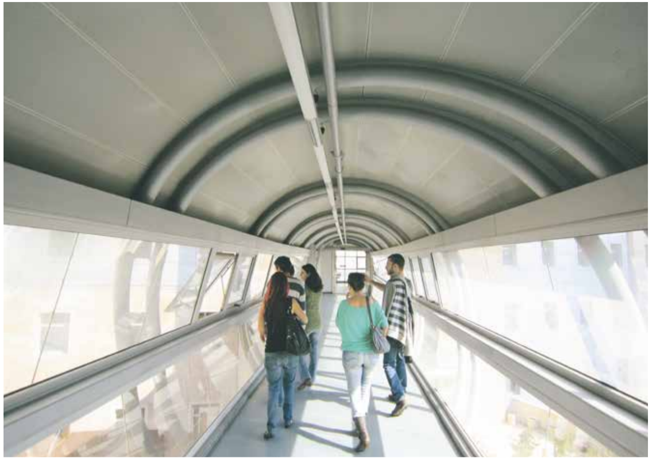
Kaderschmiede für kluge Köpfe: Studenten der Haifaer Technischen Universität Technion

Woher kommt ein solcher Erfolg? Diese Frage zu beantworten, haben schon viele versucht. In ihren bekanntesten Buch „The Start-up Nation“ erklären die amerikanischen Autoren Dan Senor und Saul Singer Israels Hightech-Boom vor allem durch zwei Faktoren: den Militärdienst und die Einwanderung. Israelische Soldaten, so ihr Argument, würden von ihren Vorgesetzten