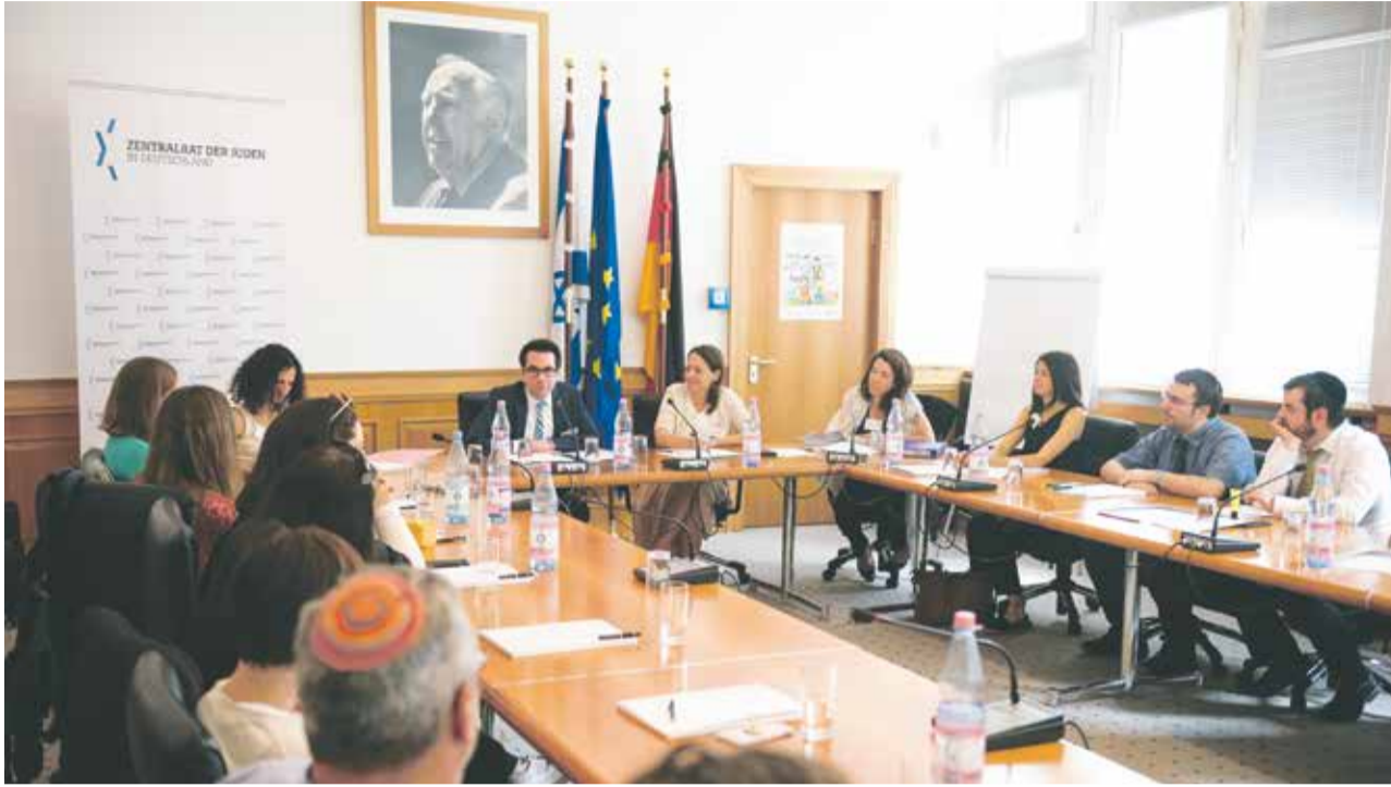
Wertvolle Tipps für eine jüdische Erziehung: Teilnehmer des Berliner „Mischpacha“-Seminars

Der Zentralrat der Juden in Deutschland startet „Mischpacha“, ein Programm für junge Familien