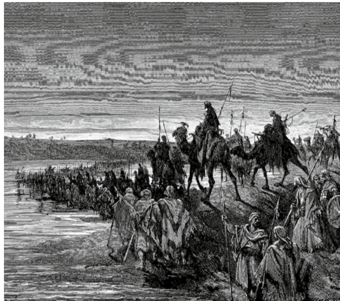
Auf ins Verheißene Land – damals und heute: Die Israeliten überqueren den Jordan unter Jehoschua (Zeichnung von Gustave Doré); Immigranten nach der Landung auf dem Ben-Gurion-Flughafen

Als die Nachkommen der aus Ägypten Geflüchteten den Jordan auf dem Weg zur Eroberung Kanaans überqueren, sind sie indessen organisiert, verfügen über schlagkräftige Kampftruppen und – nicht minder wichtig – über ein Selbstbewusstsein, das ihnen erlaubt, eigenständig zu handeln. Gewiss sind beide Ereignisse, die Flucht vom Nil und die Überquerung des Jordans, in der biblischen Geschichte gleichermaßen in Gottes Fügung eingebunden. Und doch ist die Rolle, die das Volk dabei spielt, jeweils eine andere. Es hat sich eben emanzipiert und wurde zu einem