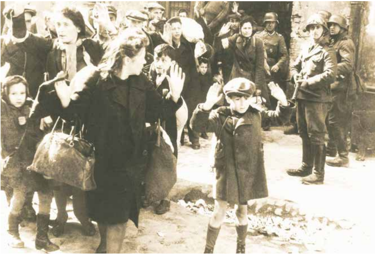
Идентифицирован: Der SS-Mörder Josef Blösche (im Warschauer Ghetto, rechts im Bild mit der Maschinenpistole) wurde 1969 hingerichtet