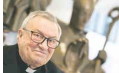
Brückenbauer: Kardinal Karl Lehmann

в области науки и образования. Обладатель нового поста будет бороться с юдофобией, а также инициировать и координировать меры по борьбе с неонацизмом к евреям. Кроме того, к нему смогут обратиться евреи, столкнувшиеся с проявлениями антисемитизма.