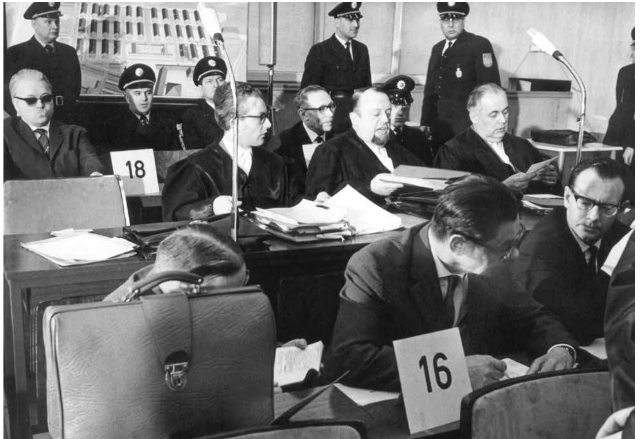
Spätes Erwachen: der erste Frankfurter Auschwitz-Prozess 1963 (im Bild: Angeklagte und Anwälte)

Außer dem Hauptkriegsverbrecherprozess führten die Besatzungsmächte auch eine Reihe weiterer Verfahren durch. Die Rechtsgrundlage dafür war das Ende 1945 vom Alliierten Kontrollrat – der obersten Besatzungsbehörde für Deutschland – erlassene Kontrollratsgesetz 10, kurz KRG 10 genannt. Es richtete sich gegen Täter, die sich, wie bereits im Statut des Internationalen Militärtribunals festgelegt, der Verbrechen gegen den Frieden, Kriegsverbrechen und Verbrechen gegen die Menschlichkeit schuldig gemacht oder, als zusätzlicher Straftatbestand, einer als verbrecherisch eingestuften NS-Organisation angehört hatten. Eine wichtige Bestimmung schloss eine Verjährung der genannten Verbrechen aus.