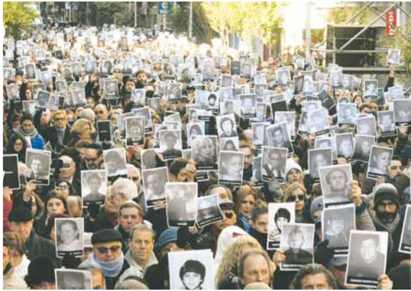
Gedenken: Zahlreiche Menschen heben am 18. Juli 2017 Bilder der Opfer des Anschlags auf die jüdische Gemeinde AMIA in Buenos Aires

Trotz dieses Schritts wurden die Schuldigen nicht zur Verantwortung gezogen. Néstor Kirchner räumte 2007 das Präsidentenamt zugunsten seiner Frau Cristina. Sie bot dem Iran 2013 an, an der „Wahrheitsfindung“ über den AMIA-Anschlag teilzunehmen. Zu gemeinsamen argentinisch-iranischen „Ermittlungen“ kam es letztendlich nicht, doch beschuldigte der als Sonderermittler mit dem Fall betraute argentinische Staatsanwalt Alberto Nisman Cristina Kirchners Regierung, die iranische Beteiligung an dem Attentat bewusst verschleiern zu haben. Unter Berufung auf Materialien des argentinischen Nachrichtendienstes SIDE erklärte Nisman, die Präsidentin habe einen geheimen Kommunikationskanal zur iranischen Regierung eingerichtet,