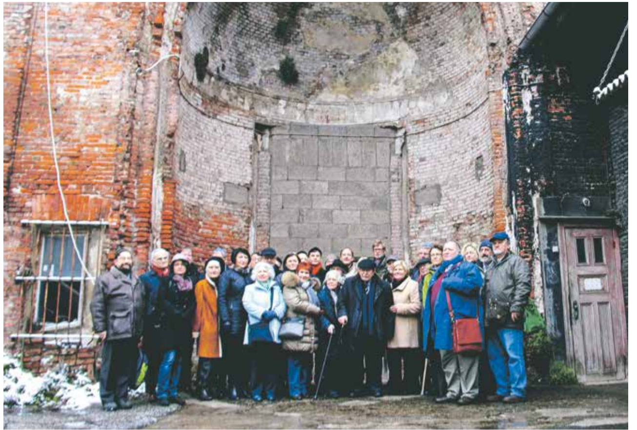
Geschichte erleben: Feierlichkeitsteilnehmer am ehemaligen Synagogengebäude in der Poolstraße