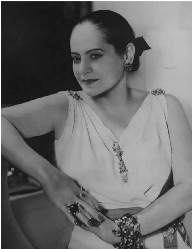
Weltweit bekannt: Helena Rubinstein (Bild links) und ihre Produkte

Zu Rubinsteins Konkurrenz gehörte nicht zuletzt die amerikanische Kosmetikproduzentin Elizabeth Arden. In der Ausstellung sind Ausschnitte aus dem amerikanischen Musical „War