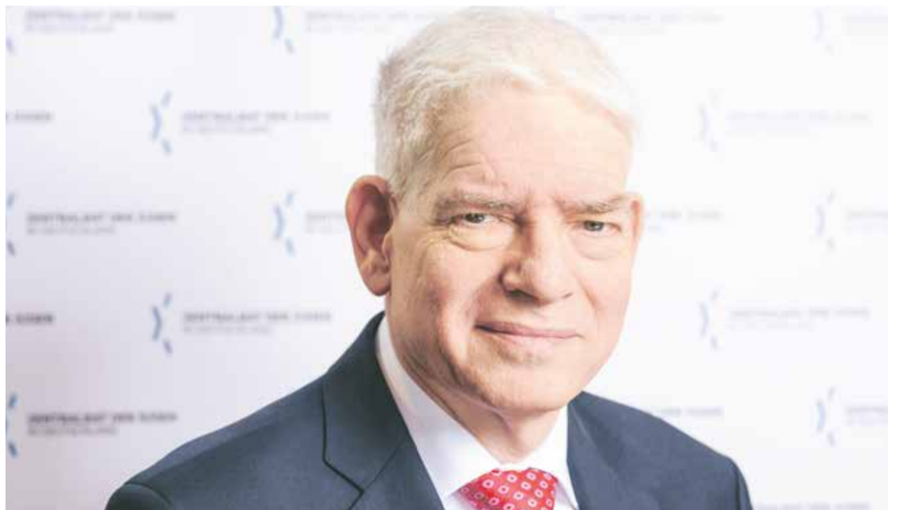
Gedenken und Erinnern: Zentralratspräsident Dr. Josef Schuster sprach vor dem Hessischen Landtag

Für die sogenannte zweite Generation, aber auch für die dritte Generation ist diese Zeugenschaft mitunter auch belastend. Manche Kinder von Überlebenden haben unter den Trau-