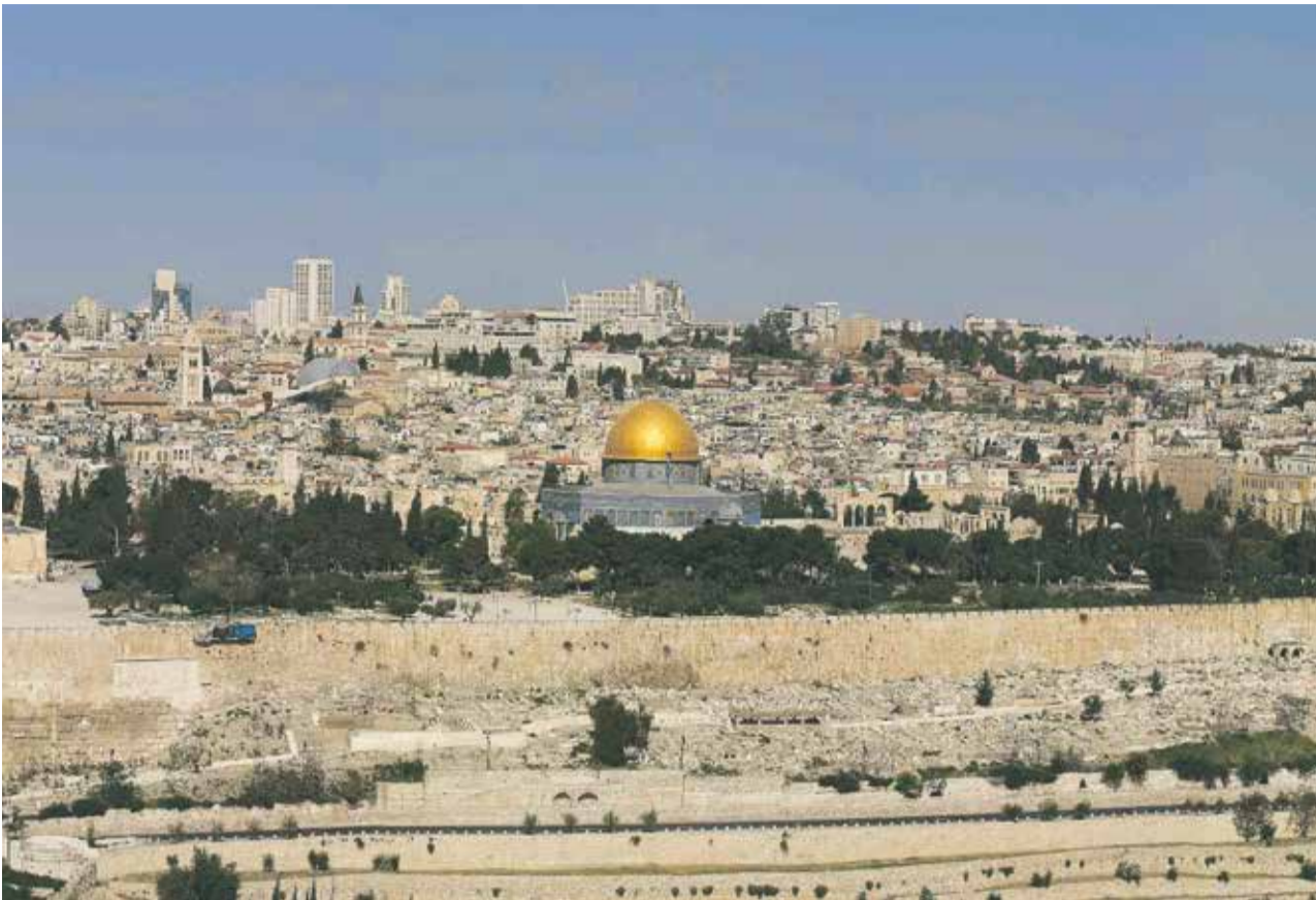
Der historische Kern: Blick vom Ölberg auf die Jerusalemer Altstadt