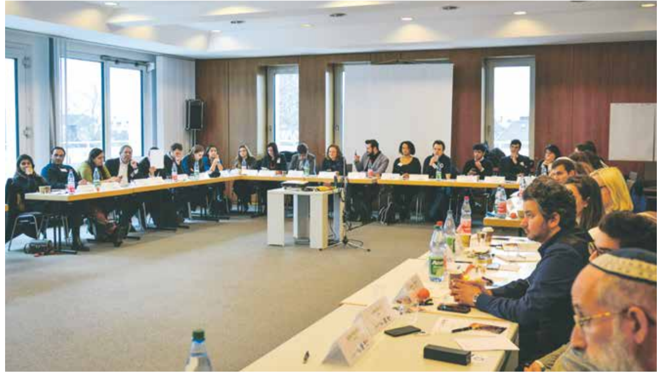
Рундер Tisch mit Ecken: Beim Frankfurter Netzwerktreffens wurde Klartext geredet | Foto: R. Poticha

В то же время, по словам сотрудницы образовательной программы