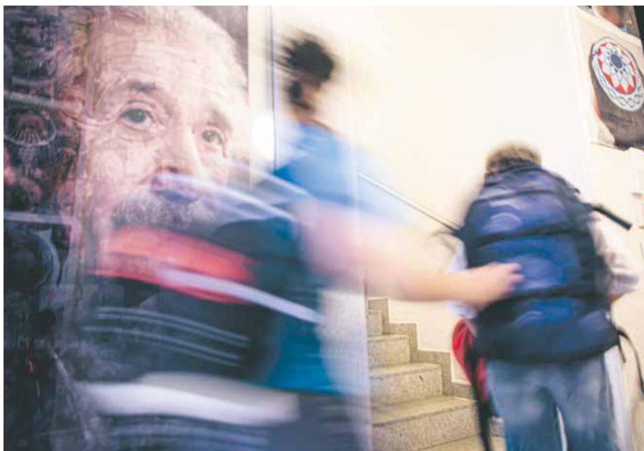
An Einstein vorbeigehuscht: Schüler des Albert-Einstein-Gymnasiums in Düsseldorf haben es eilig

Das JGMM – wie es abgekürzt wird – hat eine lange und entsprechend bewegte Geschichte. 1778 auf Anregung des namensgebenden Philosophen, Aufklärers und Vorreiters der jüdischen Emanzipation Moses Mendelssohn gegründet, gab es auch solchen jüdischen Kindern – bis 1931 ausschließlich Jungen – Bildung und Zukunft, deren Eltern sich keine Privatlehrer leisten konnten. 1942 schlossen die Nationalsozialisten die Schule und nutzten ihr Gebäude für die nächsten drei Jahre als Deportationslager für die jüdische Bevölkerung Berlins. Erst 1993, konnte die jüdische Gemeinde ihre Schule, die vor der Wende unerreichbar im Ostteil der Stadt gelegen hatte, wiedereröffnen.