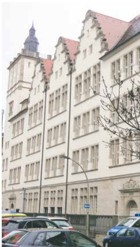
Traditionsreich; die jüdischen Gymnasien von Hamburg (l.) und Frankfurt (r.)