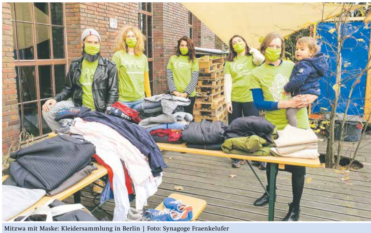
Mitzva mit Maske: Kleidersammlung in Berlin

In diesem Jahr wurde aus dem Mitzvah Day ein Mitzvah-Monat