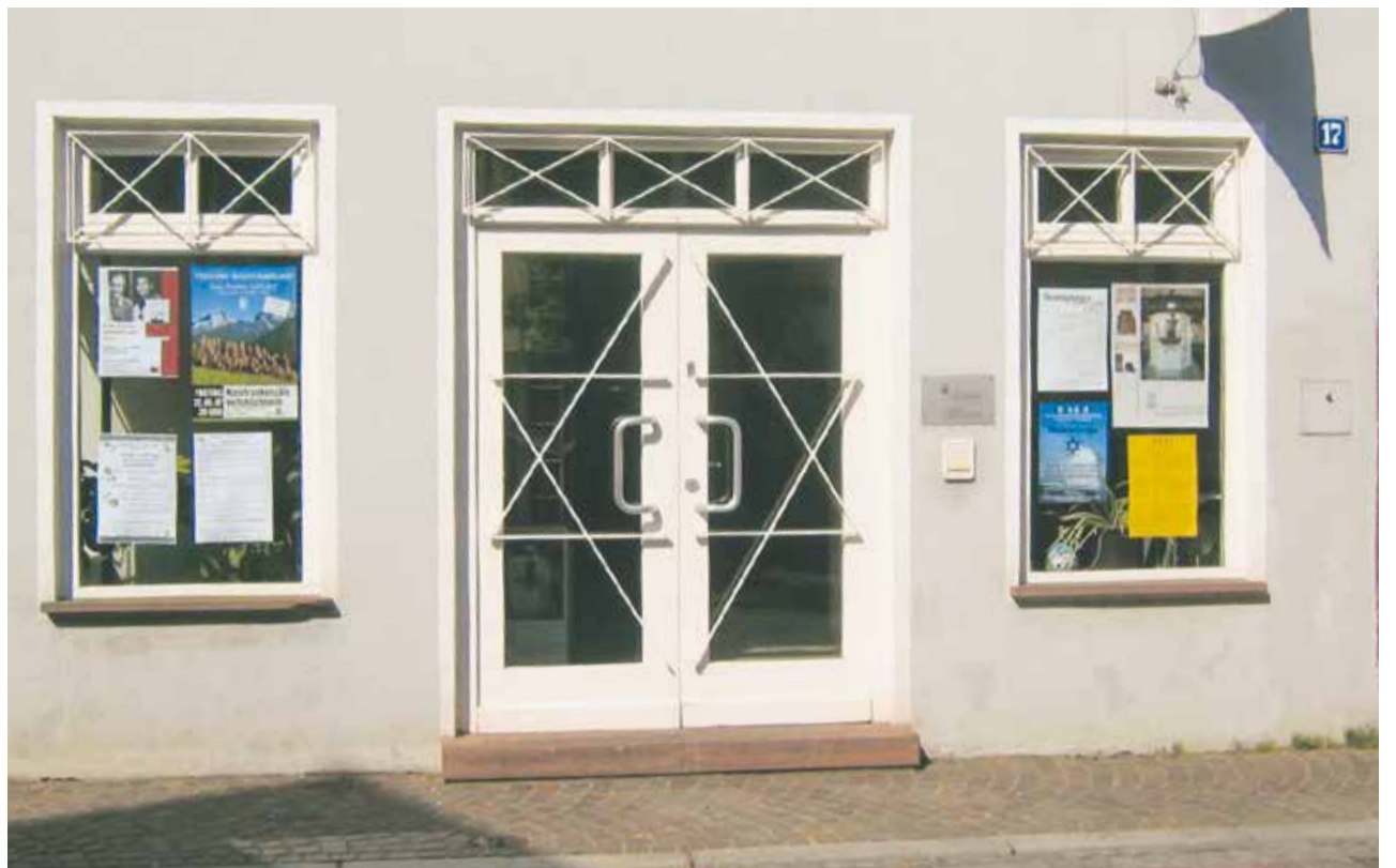
Willkommen: Eingang des Jüdischen Kulturmuseums Veitshöchheim

Was eine Synagoge ist, kann man noch relativ einfach plausibel machen,