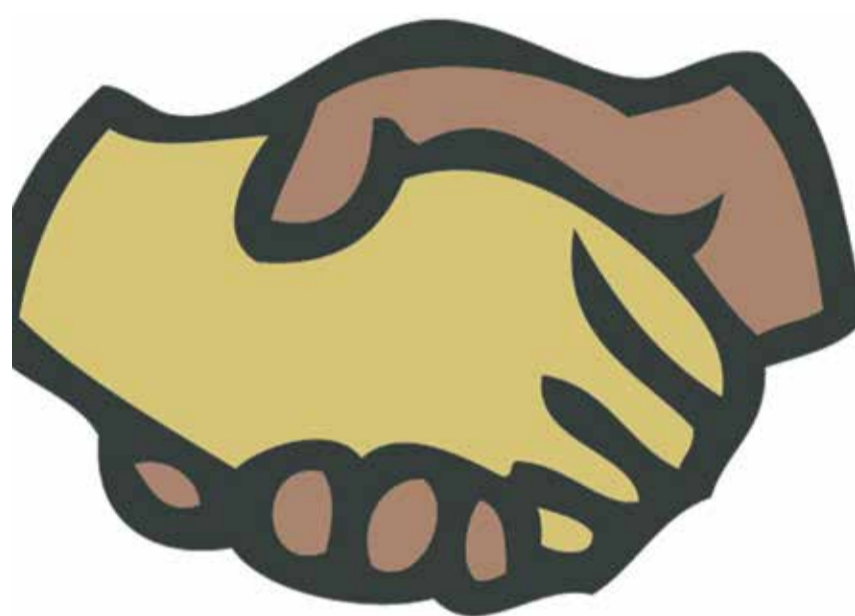
Händedruck: Begegnung und Dialog führen zu Respekt

Respekt ist weitaus mehr als bloßes Dulden. Respekt zeigt sich ebenso in der inneren Einstellung als auch