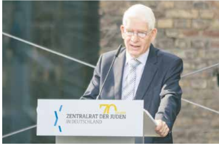
Die jüdische Gemeinschaft kann auf das Erreichte stolz sein: Zentralratspräsident Dr. Josef Schuster

In seiner Rede zum 50-jährigen Bestehen des Zentralrats stellte der damalige Präsident Paul Spiegel sel. A. nüchtern fest: „Die Liebe der Juden zu Deutschland hat sich auf Dauer eben nur als eine einseitige Liebe herausgestellt.“ Paul Spiegel bezog seine Aussage auf die Zeit vor dem Zweiten Weltkrieg und die Schoa. Heute müssen wir fragen: Handelt es sich noch immer um eine einseitige Liebe?