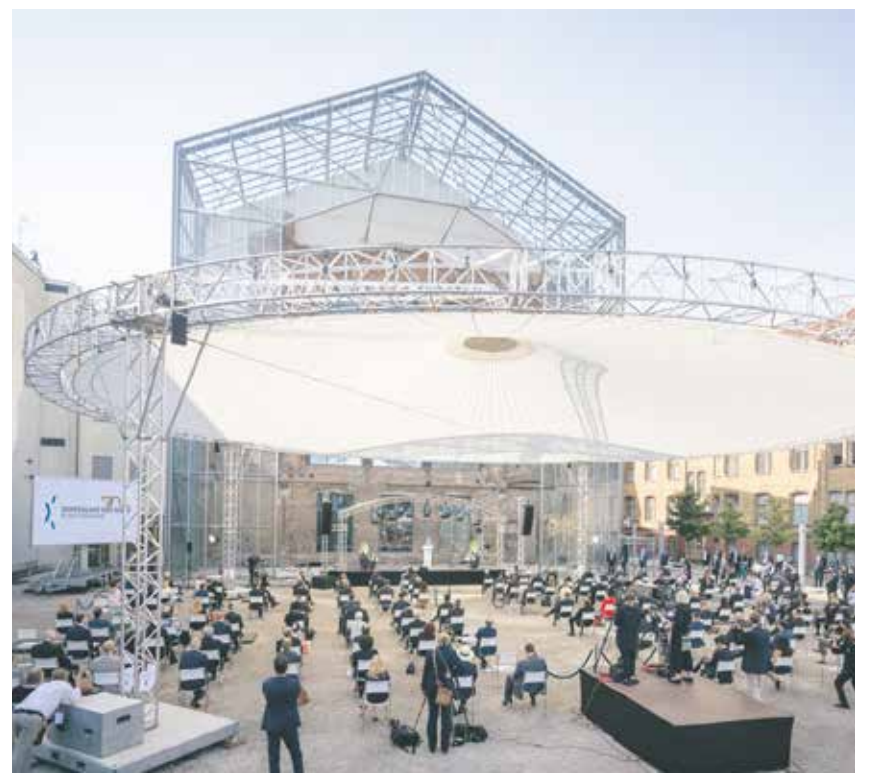
Jubiläumsfeier: würdiger Festakt trotz Corona