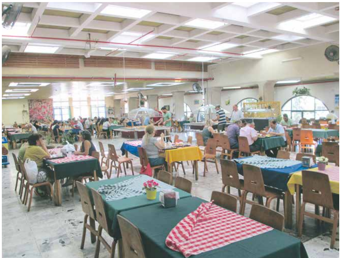
Gemeinschaft: Speisesaal im Kibbutz Jakum im Jahr 2016

Dass solche Dissonanzen wie auch ideologische Spannungen im Zusammenhalt der Kibbutzim nicht schon damals explosiver waren, lag wohl am Kampf um die Staatsgründung. Er und der Unabhängigkeitskrieg von 1948/49 zwangen die Kibbutzim zu einem intensiven militärischen und logisti-