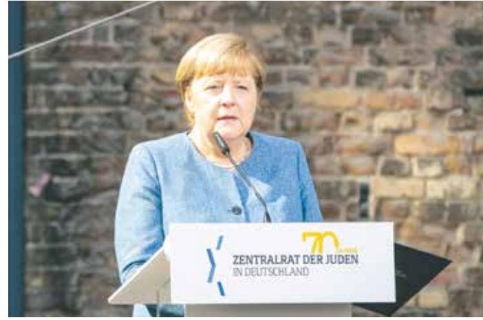
Sprach dem Zentralrat Anerkennung aus: Bundeskanzlerin Dr. Angela Merkel

Auszüge aus dem Festvortrag von Bundeskanzlerin Dr. Angela Merkel