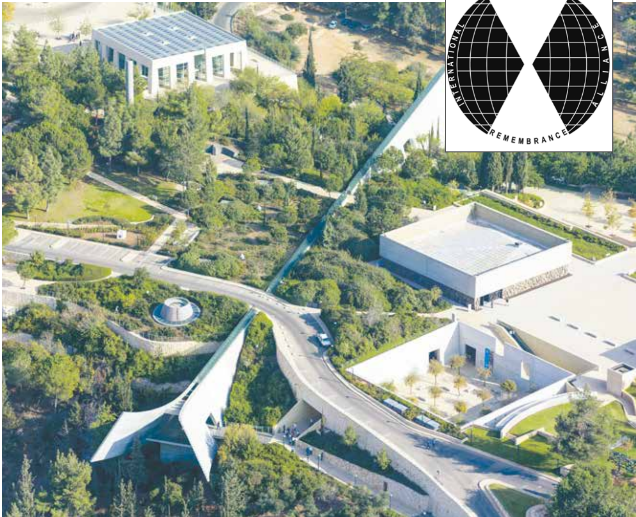
Engagiert: Professor Yehuda Bauer ist als wissenschaftlicher Berater der Holocaust-Gedenkstätte Yad Vashem (im Bild) tätig und fungiert als Ehrenvorsitzender der International Holocaust Remembrance Alliance - IHRA