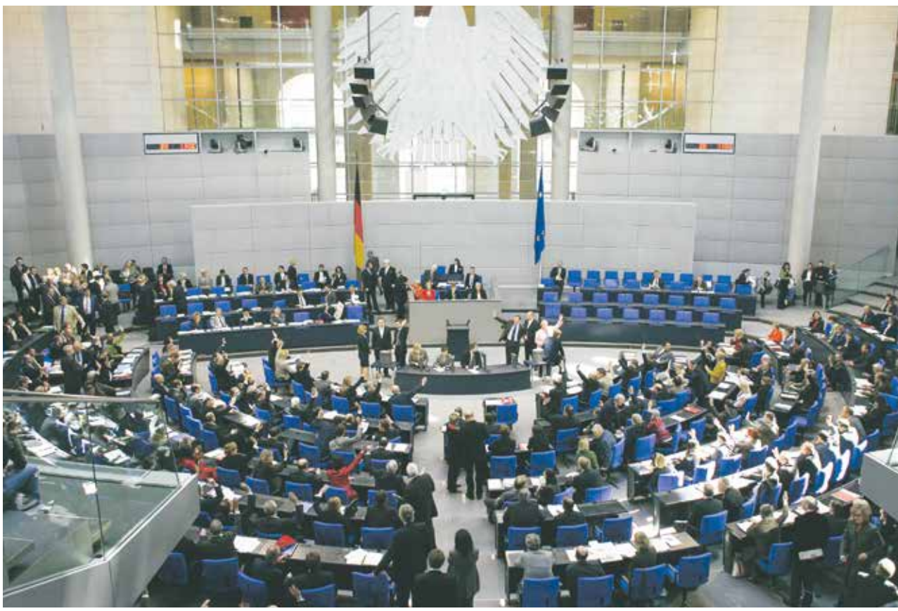
Der Gesetzgeber: Debatte im Deutschen Bundestag