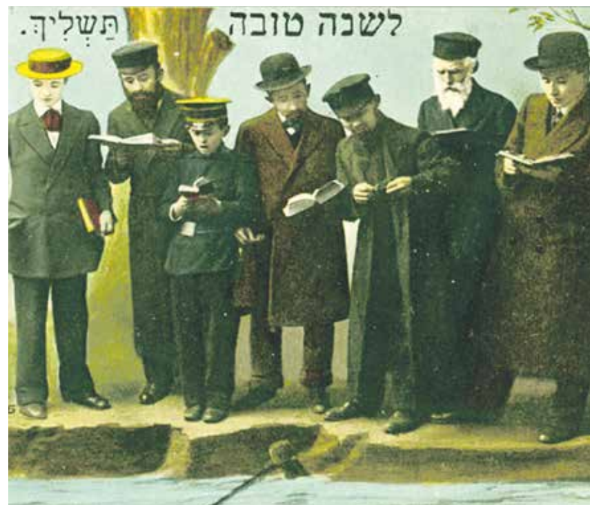
Schana Towa: Neujahrsgrußkarte aus Deutschland, 1920

So sieht sich die jüdische Welt an der Schwelle zum neuen Jahr großen Herausforderungen gegenüber. Gleichzeitig aber kann sie auf ihre große innere Geschlossenheit zurückgreifen. Das hat sich im ablaufenden Jahr nicht nur in der Abwehr des Antisemitismus, sondern auch in unschätzbare gegenseitiger Hilfe während der Epidemie gezeigt. Solidarität ist seit vielen Jahrhunderten ein prägendes Merkmal jüdischen Lebens. Das wird auch so bleiben.