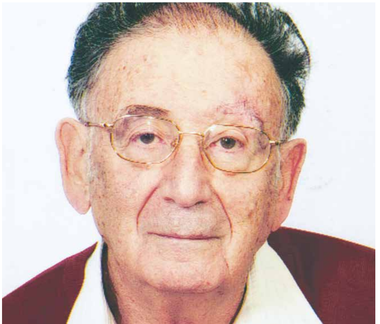
Forscht und lehrt: Professor Yehuda Bauer

gab es schon immer. Nehmen wir als Beispiel den Antisemitismus, der sich als Kritik an der israelischen Regierung tarnt. In Wirklichkeit wird den Juden das Recht auf Unabhängigkeit und auf das Leben in ihrem Land abgesprochen. Das aber ist nicht neu. Bereits im kirchlichen Antisemitismus war vor Jahrhunderten die Rede davon, Juden dürften nicht im Heiligen Land leben, weil sie Jesus abgelehnt hätten. Und natürlich werden Israel dieselben satanischen Züge zugeschrieben, die der alte christliche Antisemitismus ihnen unterstellte. Im Kern also nichts