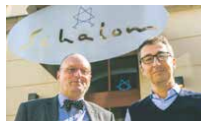
Cem Özdemir, Bündnis 90/Die Grünen (r.) mit Uwe Dziuballa vor dessen jüdischem Restaurant «Schalom» in Chemnitz.

В связи с ксенофобскими выступлениями в Хемнице в прошлом месяце президент Центрального совета евреев в Германии д-р Йозеф Шустер потребовал усилить меры по борьбе с правым экстремизмом. По его мнению, события в Хемнице показывают, что для участия в антидемократической демонстрации в кратчайшие сро-