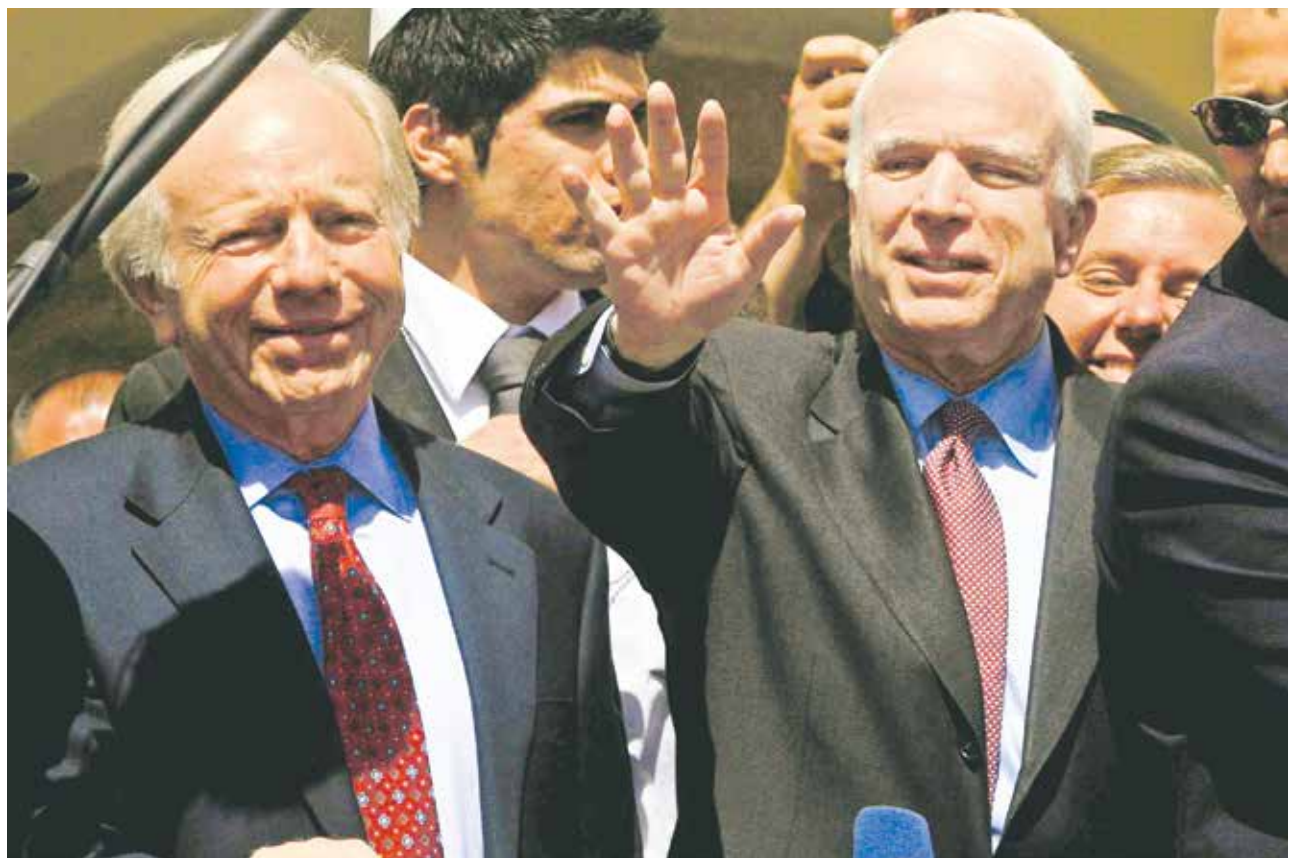
Freunde: Joe Lieberman (l.) und John McCain (r.) an der Westmauer in Jerusalem

McCains besonderer Zorn galt aber den Schabbat-Aufzügen, die automatisch auf jeder Etage halten und die er bei Israel-Besuchen benutzte. Bei dem Botschaftsempfang erkundigte sich der Republikaner: „War jemand von euch schon in einem Schabbat-Aufzug?“ In der israelischen Botschaft