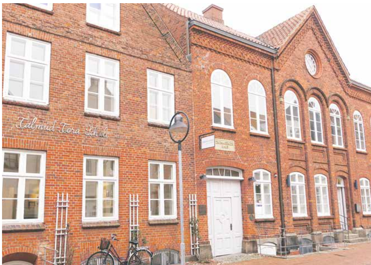
Reiche Themenpalette: das Jüdische Museum Rendsburg

Von unten geht der Blick hoch zur Frauempore, wo einige Ausstellungsveritrinen zu sehen sind. Dort und in dem früher als Wintersynagoge genutzten Versammlungszimmer werden Ritualgegenstände gezeigt und eingebunden in den jüdischen Jahreskreis erläutert. Eine Vitrine zeigt eine offene Torarolle, Torakrönchen und einen Torazeiger, den Jad, eine andere eine Chanukka, einen Dreidel und Chanukka-Kekse. An jeder Station gibt es kurze Erklärungen oder die Möglichkeit, sich kurze Videos, Texte und Bilder anzusehen. Wer sich näher informieren will, findet neben einer Sitzbank ein paar einschlägige Bücher, die helfen, sich in Symbolik, Riten und Lehre des religiösen Judentums zu vertiefen.