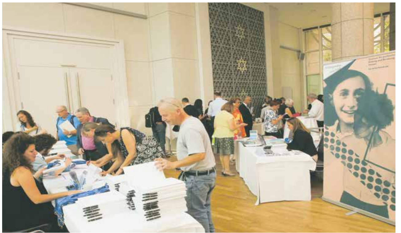
Wichtige Fragen: Tagungsteilnehmer im Ignatz Bubis-Gemeindezentrum