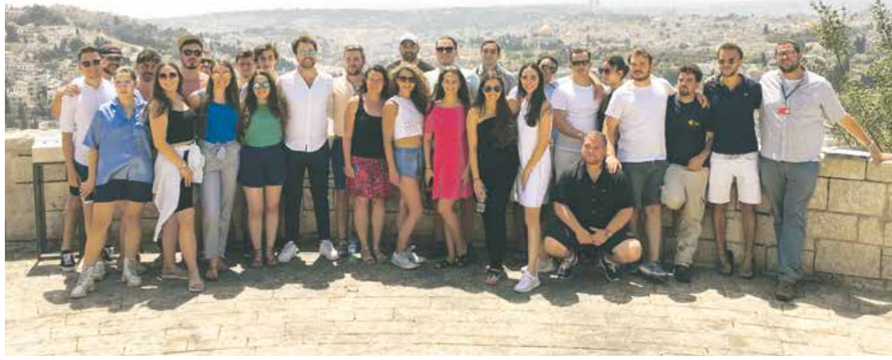
Erkenntnisreich: Teilnehmer der Bildungsreise in Jerusalem

Fürsprache für Israel war das Thema der Israel-Studienreise des Zentralrats