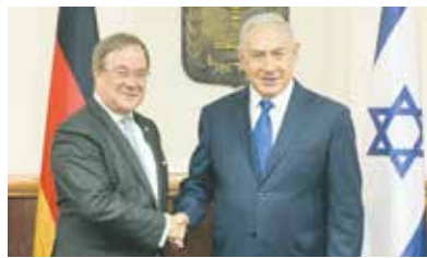
Kooperation: NRW-Ministerpräsident Armin Laschet mit Israels Premier Benjamin Netanjahu

Nordrhein-Westfalen will die Zusammenarbeit mit Israel vertiefen. Das erklärte der nordrhein-westfälische