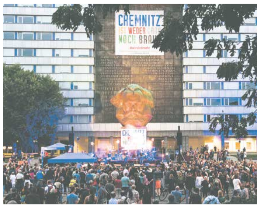
Es geht auch anders: Chemnitzer Konzert gegen rechte Gewalt

Альянс популистов не в состоянии предложить никаких конструктивных решений проблем, которые, подобно другим переломным периодам в истории человечества, несёт с собой эпоха глобализации. Напротив, если бы этому альянсу удалось расшатать существующие политические структуры, то это бы имело