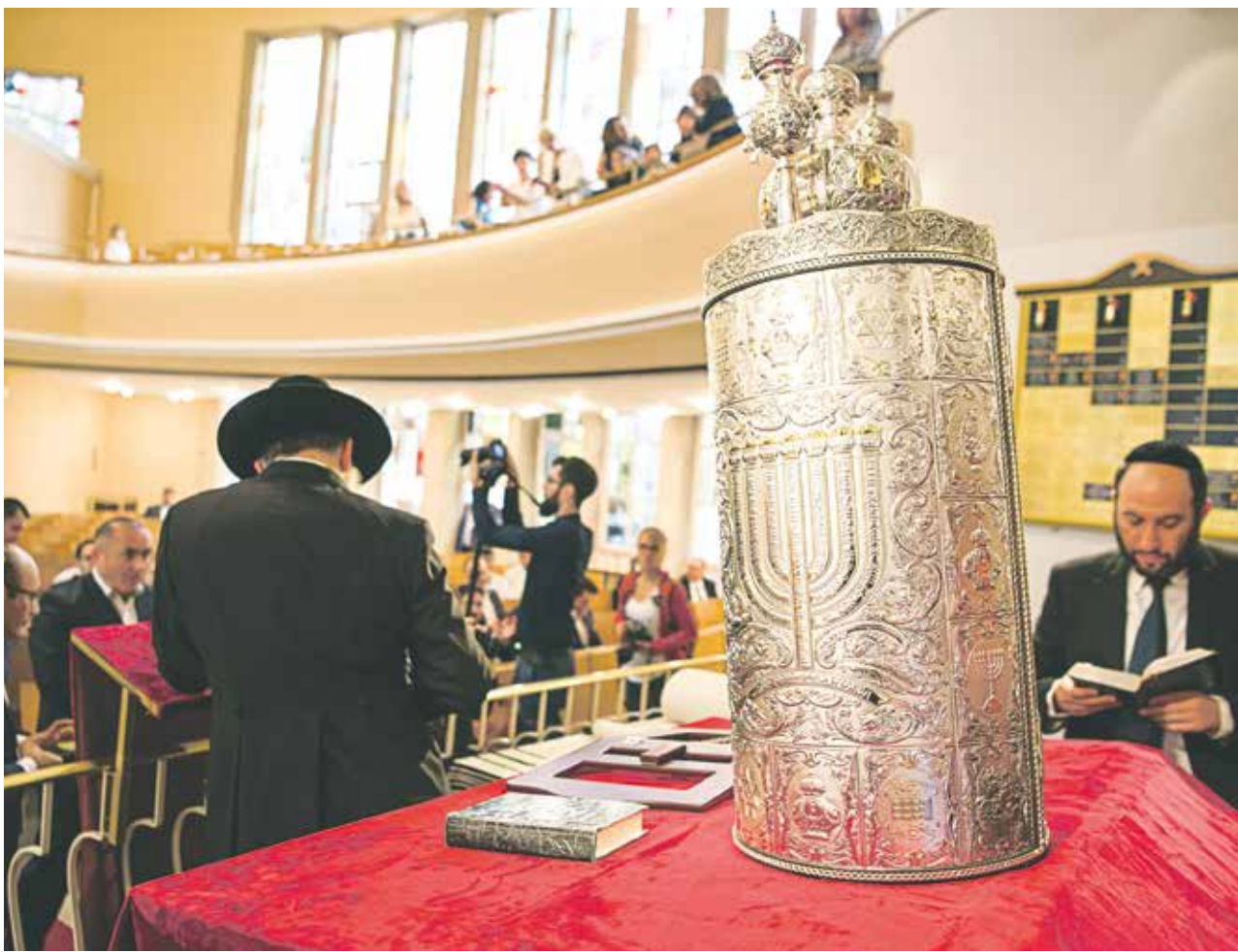
Heilige Schrift: Einweihung einer Torarolle in der Jüdischen Gemeinde Düsseldorf