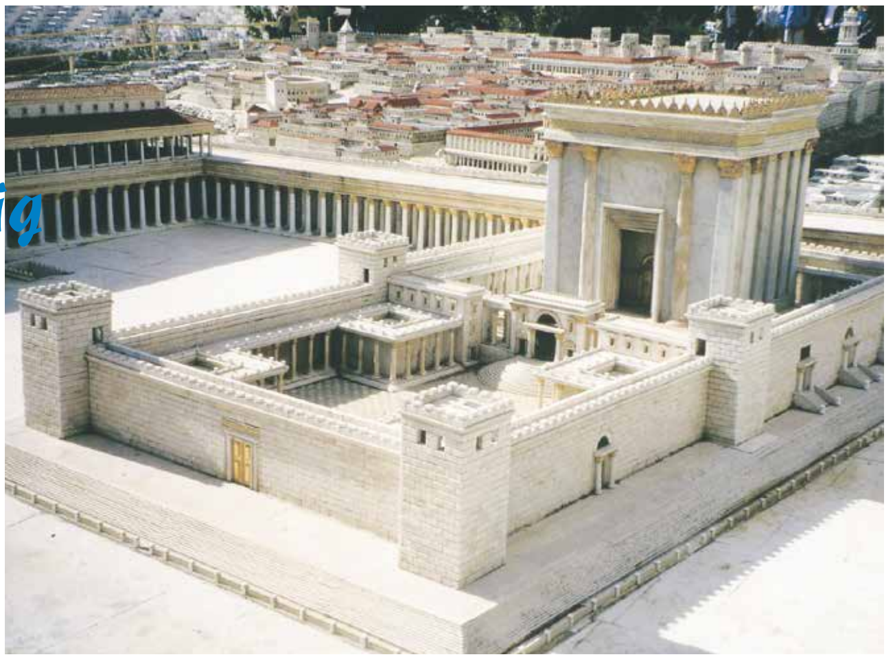
Heiliger Ort: der Jerusalemer Tempel vier Jahre vor seiner Zerstörung durch die Römer (im Bild: plastische Abbildung im Holyland-Modell in Jerusalem)

Hinsichtlich des priesterlichen Dienstes vermerkt das 3. Buch Mose