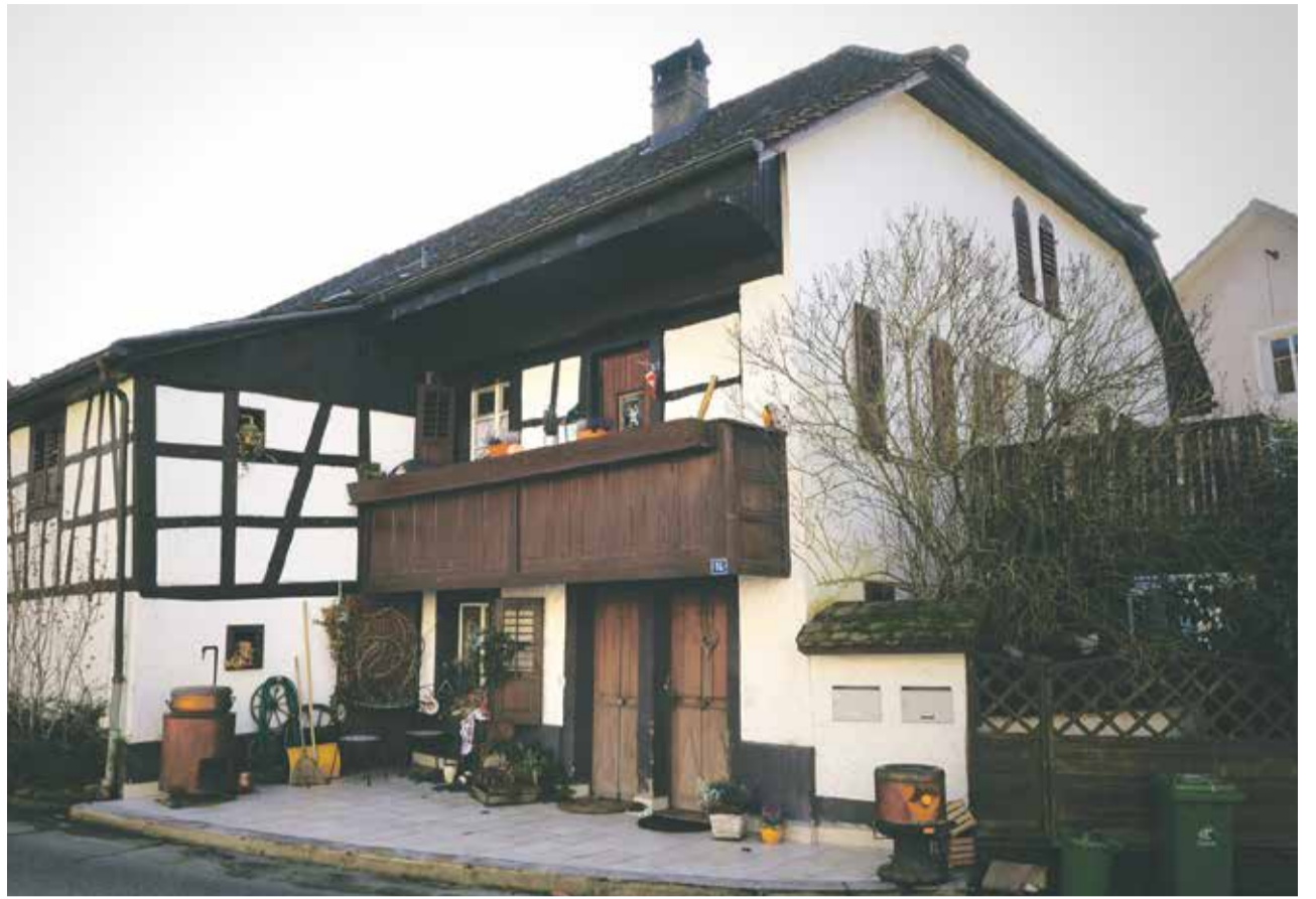
Ein Haus – zwei Türen: So wurde das Verbot gemeinsamen Wohnens umgangen (Haus in Lengnau)

Diese reichhaltige Geschichte, der der Autor Charles Lewinsky im preisgekrönten Roman „Melnitz“ ein literarisches Denkmal gesetzt hat, soll nun