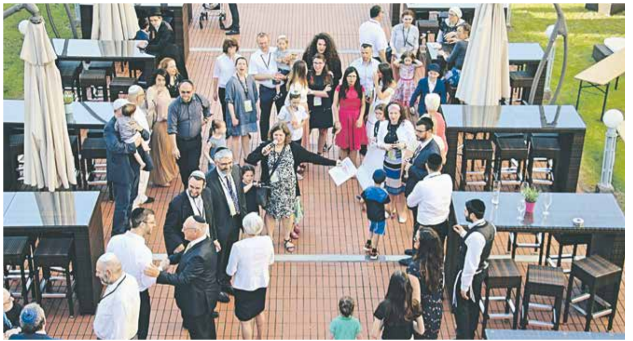
Treffpunkt: Teilnehmer des Grand Schabbaton in Radebeul.

Wir halten uns an die Halacha. Das bedeutet aber nicht, dass wir nur Ortho-