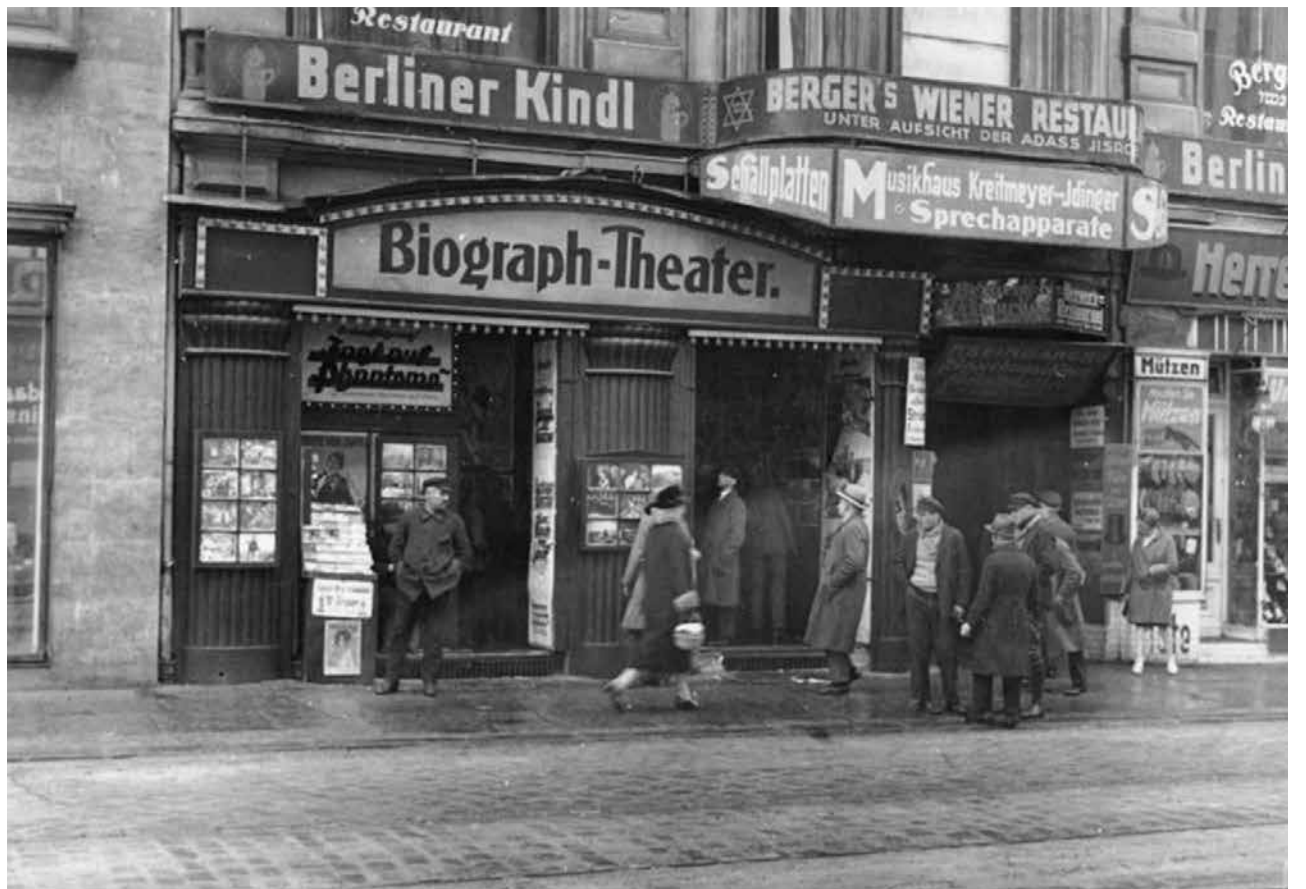
Berlin 1929: Straßenszene in der Münzstrasse im sogenannten Scheunenviertel.

Nicht so klein und vor allem viel besser dokumentiert ist die юдские Migration nach Deutschland im 19. Jahrhundert. Mit der Industrialisierung wurde Westeuropa auch für breitere Schichten attraktiv. Viele Juden aus