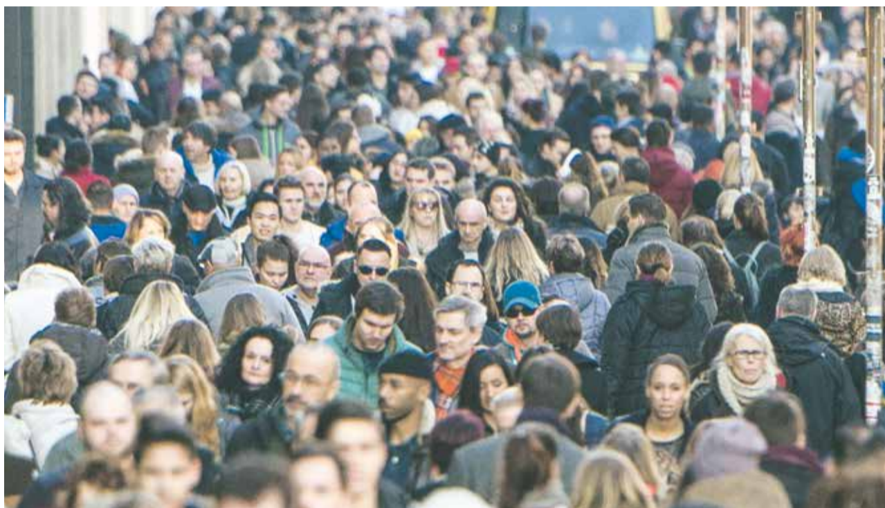
Inklusiv: Niemand darf benachteiligt werden, weil er nicht in ein bestimmtes Raster passt

В то же время важно напомнить о том, что в отличие, например, от вопросов обороны, ответственность за борьбу с антисемитизмом и любыми другими формами расизма и ксенофобии несёт не только государство. Противодействие расизму – это задача всего общества в целом, включая религиозные сообщества, профсоюзы, экономические ассоциации, спортивные общества,