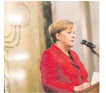
Willkommener Gast: Die Bundeskanzlerin im „Templo de Libertad“

Anlässlich ihrer Argentinienreise besuchte Bundeskanzlerin Dr. Angela Merkel am 8. Juni die Synagoge Templo de Libertad in Buenos Aires. In der Synagoge weihte die Kanzlerin