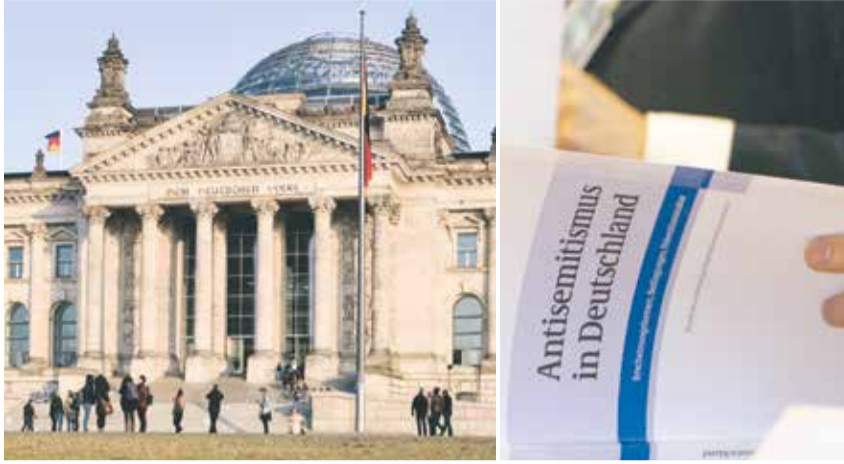
Brief ans Parlament: Handeln ist angesagt (Im Bild: Reichstagsgebäude in Berlin, der Antisemitismus-Bericht)

Umsetzung der Empfehlungen zur Antisemitismusbekämpfung gefordert / Zentralrat gehört zu Unterzeichnern